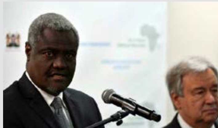
Moussa Faki Mahamat

En déplacement au siège des Nations unies, le président de la Commission de l'UA s'est exprimé avec le secrétaire général de l'ONU Antonio Guterres sur le dossier soudanais. C'est Antonio Guterres qui, à cet égard, a été le plus explicite.