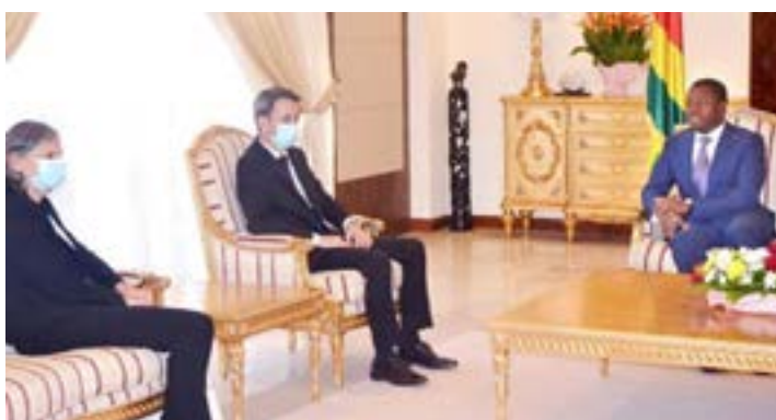
Faure Gnassingbé (à d) avec des membres de la délégation