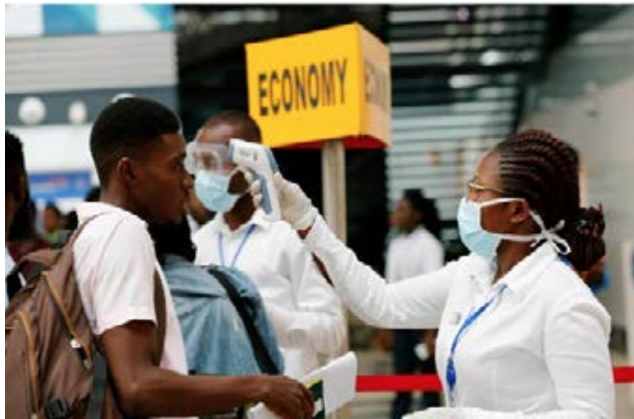
Des mesures pour les voyageurs

Au niveau mondial en date du 30 novembre 2021, plus de 261 millions (261 435 768) sont des cas confirmés, plus de 5 millions (5 207 634) de décès avec plus de 7 milliards (7 772 799 316) de doses de vaccins administrées. L'Amérique est le continent le plus touché et l'Afrique est le moins touché. En Afrique, les chiffres sont de plus de 6 millions (6 195 515) de cas confirmés, 152 299 décès contre 217 314 cas actifs.