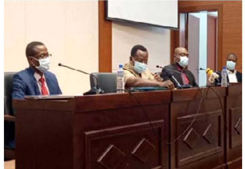
Présidium de la rencontre

Le pass vaccinal a également été au cœur des échanges. En effet, le pass vaccinal du Togo est désormais reconnu par l'Union européenne et l'Union africaine, a fait savoir le capitaine Agbagla du ministère de l'Economie numérique. Le Togo dispose également désormais d'un nouveau pass vaccinal. « Le pass vaccinal du Togo intègre l'inclusivité, la flexibilité, la robustesse et l'authenticité. Contrairement à l'ancien pass vaccinal qui ne contient qu'un seul QR code, le nouveau pass vaccinal comporte trois QR code. Une nouvelle application (PassCovidTG) qui sera opérationnelle bientôt permettra de vérifier un pass vaccinal ou un test Covid19, de