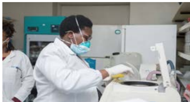
Tests au laboratoire

La Fondation Mastercard et l'initiative Saving Lives and Livelihoods de CDC Afrique (Centres de contrôle et de prévention des maladies en Afrique) ont conjointement annoncé que 151 200 doses de vaccins commandées dans le cadre de l'initiative "Sauver des vies et des moyens d'existence", ont atterri au Togo et sont prêtes à être distribuées.