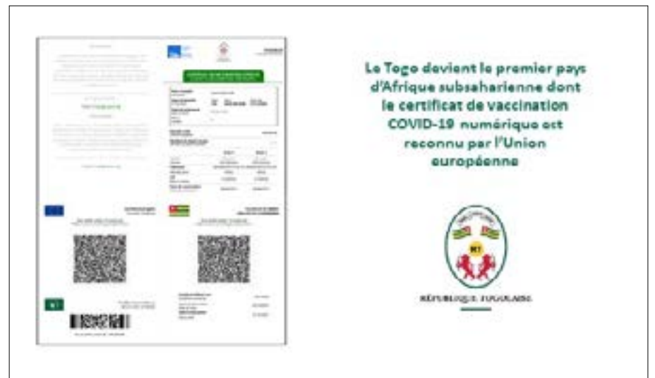
Le nouveau pass vaccinal du Togo avec 3 QR code

La préoccupation des hommes de médias à savoir quelle est la portée de la vaccination ?