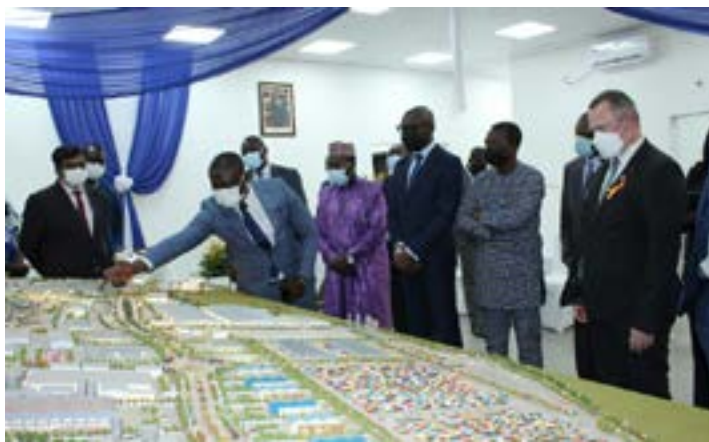
Présentation de la maquette du projet

logistiques : un parking d'une capacité de 700 camions, un parc pour le stockage de conteneurs d'une capacité de 12 500 EVP, un entrepôt pour charger, décharger et transférer les conteneurs, une plateforme de stockage du coton et d'autres matières premières, une zone de 200 000 m 2 dédiée aux autres activités logistiques, des routes et emprises routières. PIA va également permettre de