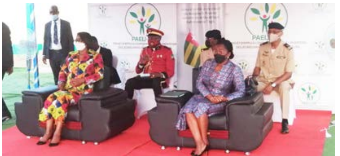
Les Premiers ministres du Gabon et du Togo

AVI SARL. Il y a également eu des présentations, échanges et témoignages de jeunes entrepreneurs accompagnés par ce mécanisme, de jeunes en mission au service de leurs communautés et de personnes bénéficiaires de filets sociaux. Étaient présents à cette cérémonie, une forte délégation ministérielle, les autorités locales et traditionnelles. Accompagnée depuis 2019 sur la chaîne de valeur Soja biologique, la PME AVI SARL, organisée en cluster, collabore avec 219 groupements, soit en tout 3 171 producteurs. Pour