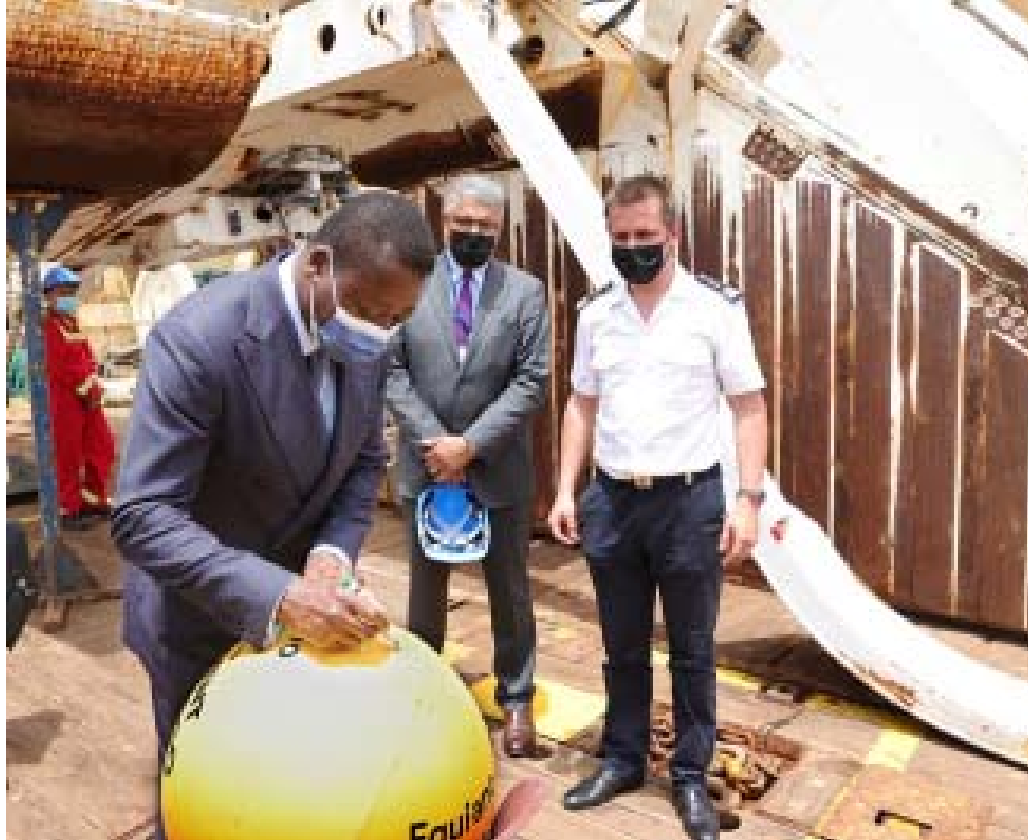
Faure Gnassingbé signe une bouée Equiano pour marquer l'événement

Le Togo a officiellement accueilli, le 18 mars 2022, le premier point d'atterrissage du câble sous-marin de fibre optique Equiano de Google en Afrique, en partenariat avec CSquared group. Il est le premier pays en Afrique à accueillir ce câble. Le Nigéria était le pays africain où devait atterrir la branche en premier mais, à cause des perturbations, cela n'a pas pu se faire. A Lomé, la cérémonie a été présidée personnellement par le président Faure Gnassingbé. Le déploiement de ce câble de dernière génération cadre avec la stratégie nationale de transformation numérique du Togo, déclinée dans la Feuille de route gouvernementale 2020-2025. Laquelle stratégie exige, entre autres, de garantir la souveraineté numérique et de s'affirmer comme un hub numérique de premier ordre dans la sous-région ouest africaine. Ce dispositif permettra d'of-