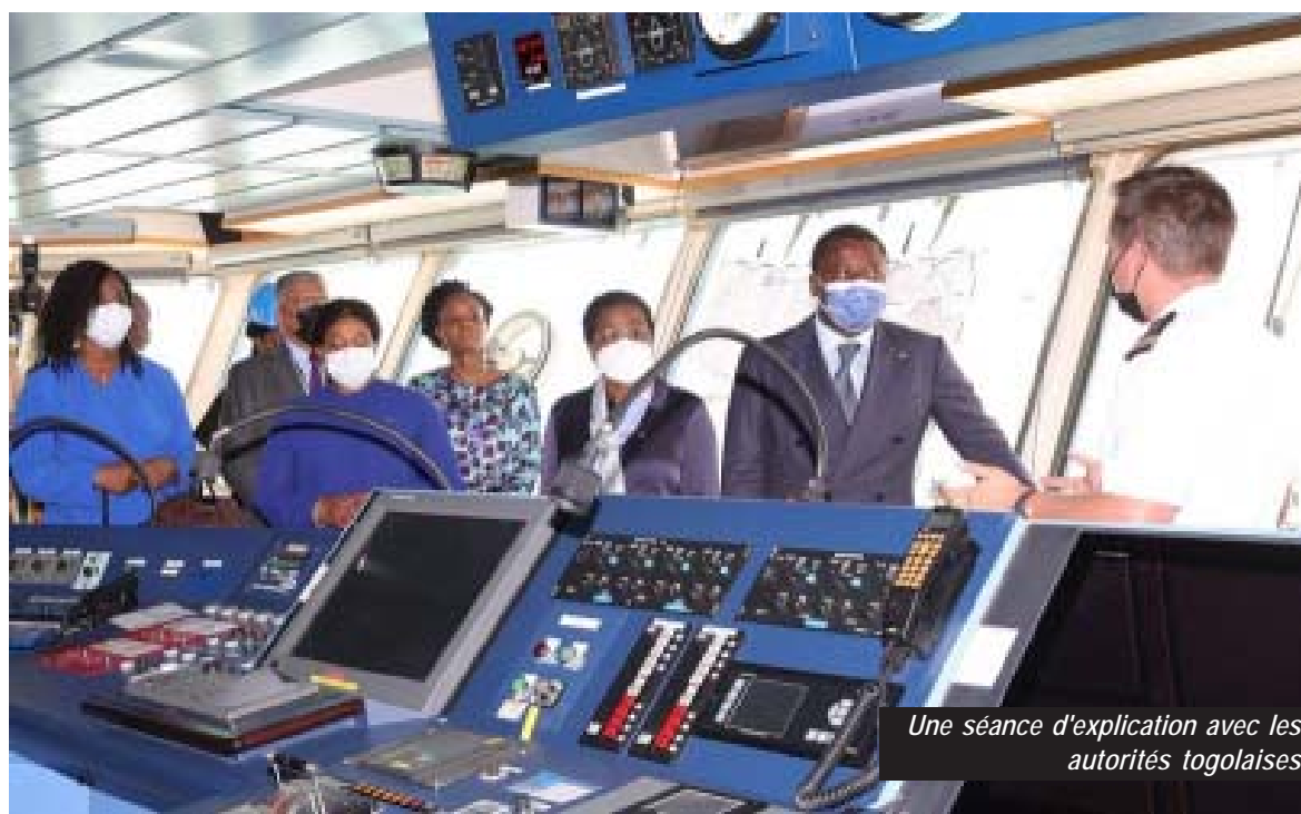
Une séance d'explication avec les autorités togolaises

...La prochaine étape est de connecter le câble au Nigeria, après la Namibie et l'Afrique du Sud, et de finaliser le branchement à Sainte Hélène. Une fois l'Afrique du Sud activée, le câble pourra être mis en service à partir du 4 ème trimestre 2022.