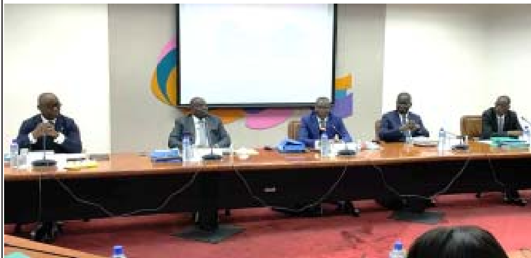
Le président du Conseil des ministres entouré des premiers responsables des Institutions de l'Union

Dans les pays membres de l'Union, la reprise des activités économiques est amorcée. Ce rebond va conduire à une croissance de 5,6% en 2021, soit le niveau moyen de la croissance économique ces dernières années