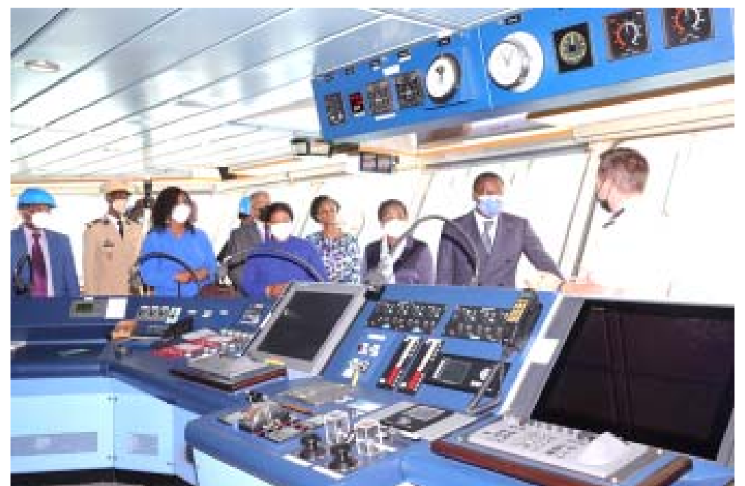
Une séance d'explication avec les autorités togolaises

Au plan mondial, le secteur de l'agriculture, foresterie et autres affectations des terres représente globalement la deuxième source majeure des émissions de gaz à effet de serre (GES), après l'énergie : 24% des émissions de GES, 50% dans les pays en développement.