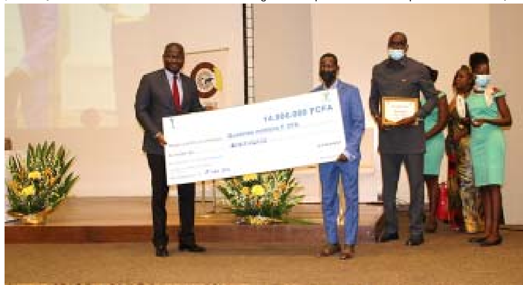
Le promoteur de ENERGIEAUX (à droite) recevant son prix

Les lauréats togolais de la 2 e édition du concours Tremplin Start-Up UEMOA ont reçu leurs prix, le jeudi 17 mars 2022 à