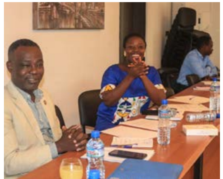
Séance de travail

Le rapport produit par Jeunes Verts et ses partenaires, est structuré en trois parties : compréhension (introduction, progrès des ODD au Togo, contribution des OSCs) ; consultation (méthodologie, analyse