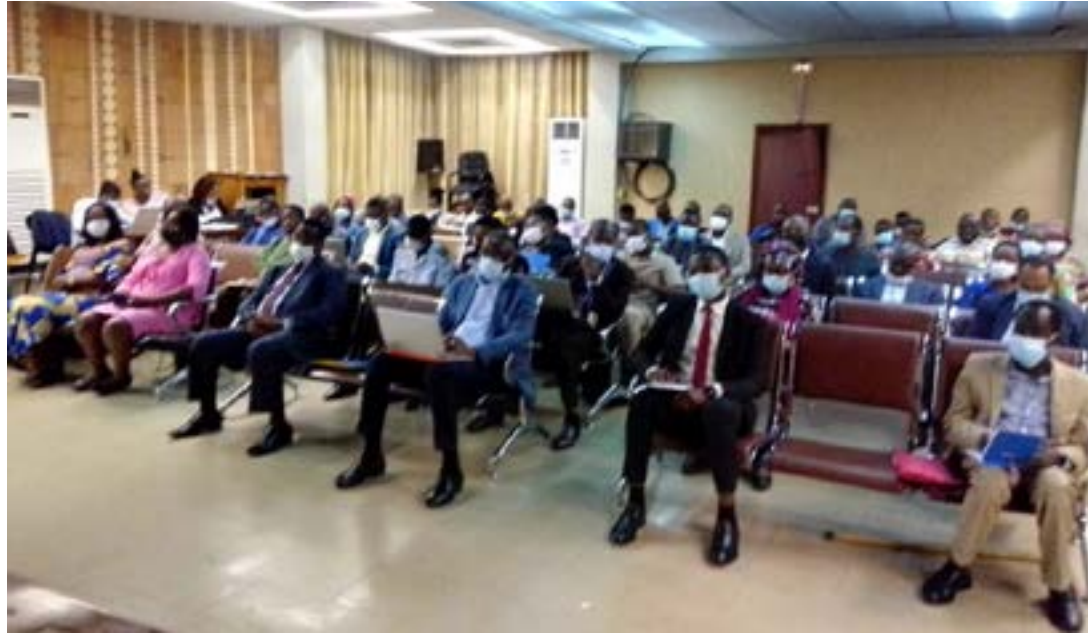
Les participants lors de la validation du rapport du gouvernement

Hier, 5 juillet 2022, s'est ouvert le Forum politique de haut niveau (FPHN) sur la mise en œuvre des Objectifs de développement durable (ODD). Sur invitation du Conseil économique et social des Nations unies, le Togo aura le privilège de présenter pour la quatrième fois son rapport de suivi du progrès des ODD. Les 24 et 25 mai 2022, le gouvernement a validé son rapport. Mais, comme il faut aussi un rapport alternatif de la société civile, cette dernière y a également travaillé. Le vendredi 1er juillet 2022, il y a eu la validation de ce rapport grâce à l'initiative de l'ONG Jeunes Verts qui a consulté toutes les composantes de la société civile sur l'ensemble du territoire national.