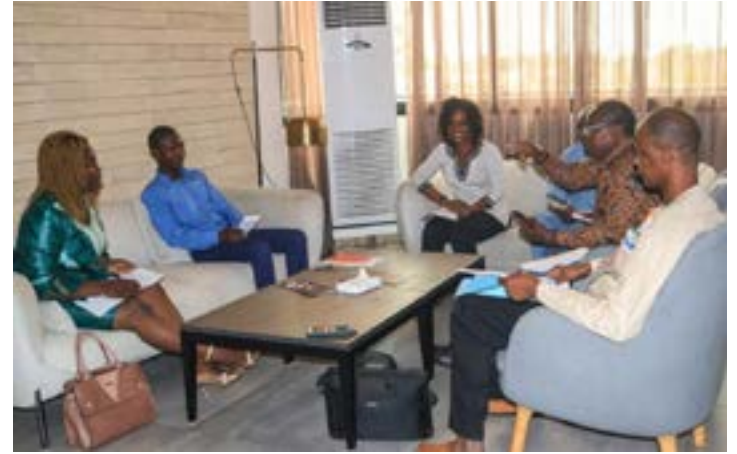
Travaux de groupes

du ministère de la Planification du développement et de la Coopération, ainsi que la société civile dans sa diversité. Cette initiative