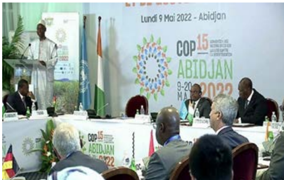
Faure Gnassingbé (à gauche) à la Cop15

l'élimination de la pauvreté, la stabilité socioéconomique et le développement durable. Les populations démunies qui vivent