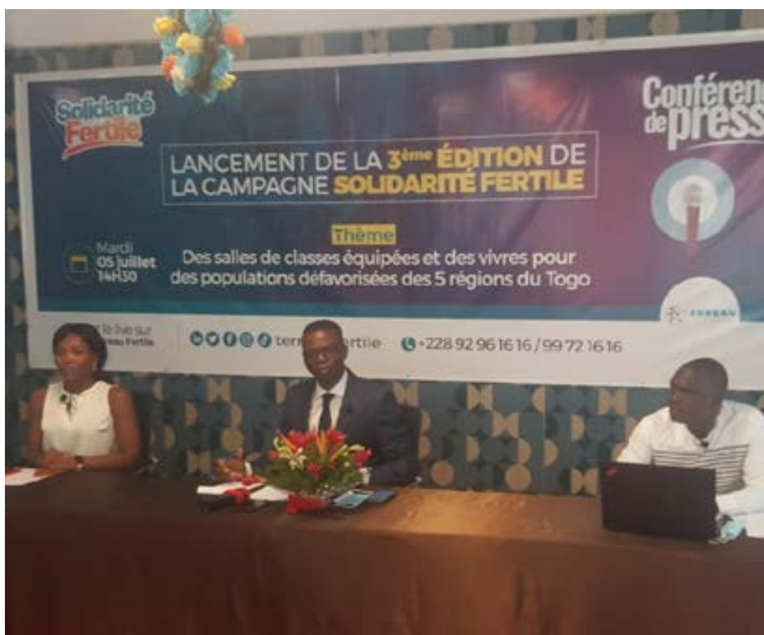
La table d'honneur

Pour soutenir cette action, l'organisation lance un appel à tous les citoyens, aux organismes, aux entreprises, aux personnes de bonne volonté à rejoindre cette campagne en vue de venir en aide aux nécessiteux. L'objectif est de mettre