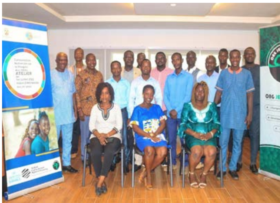
Les participants lors de la validation du rapport de la société civile

des partenaires des institutions bilatérales et multilatérales ainsi que des responsables des Organisations de la société civile (OSC). De même, lors de la validation du rapport de la société civile organisée par l'ONG Jeunes Verts le vendredi 1er juillet 2022, on pouvait noter la présence d'un représentant