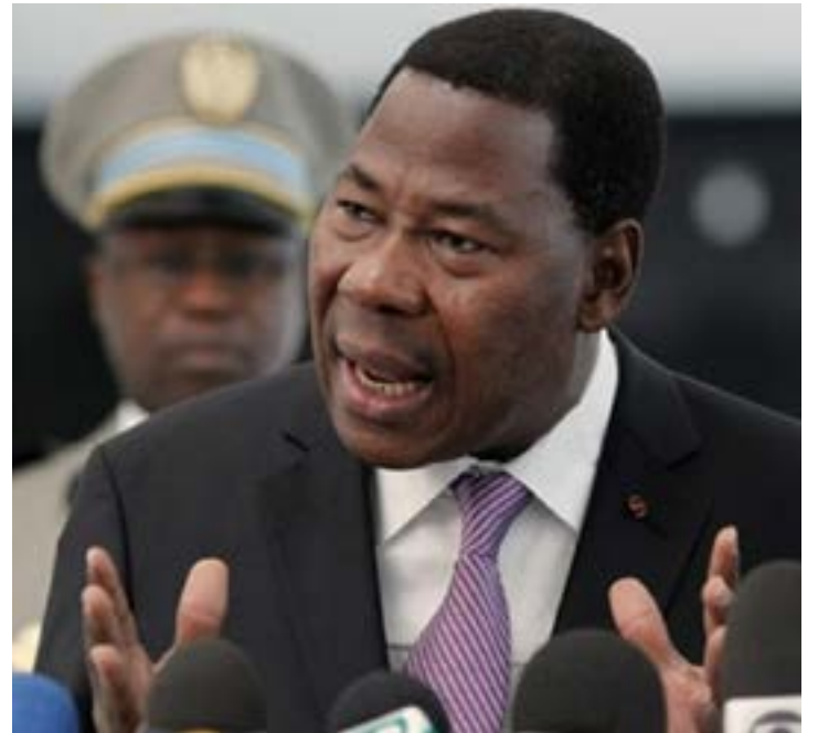
Thomas Yayi Boni