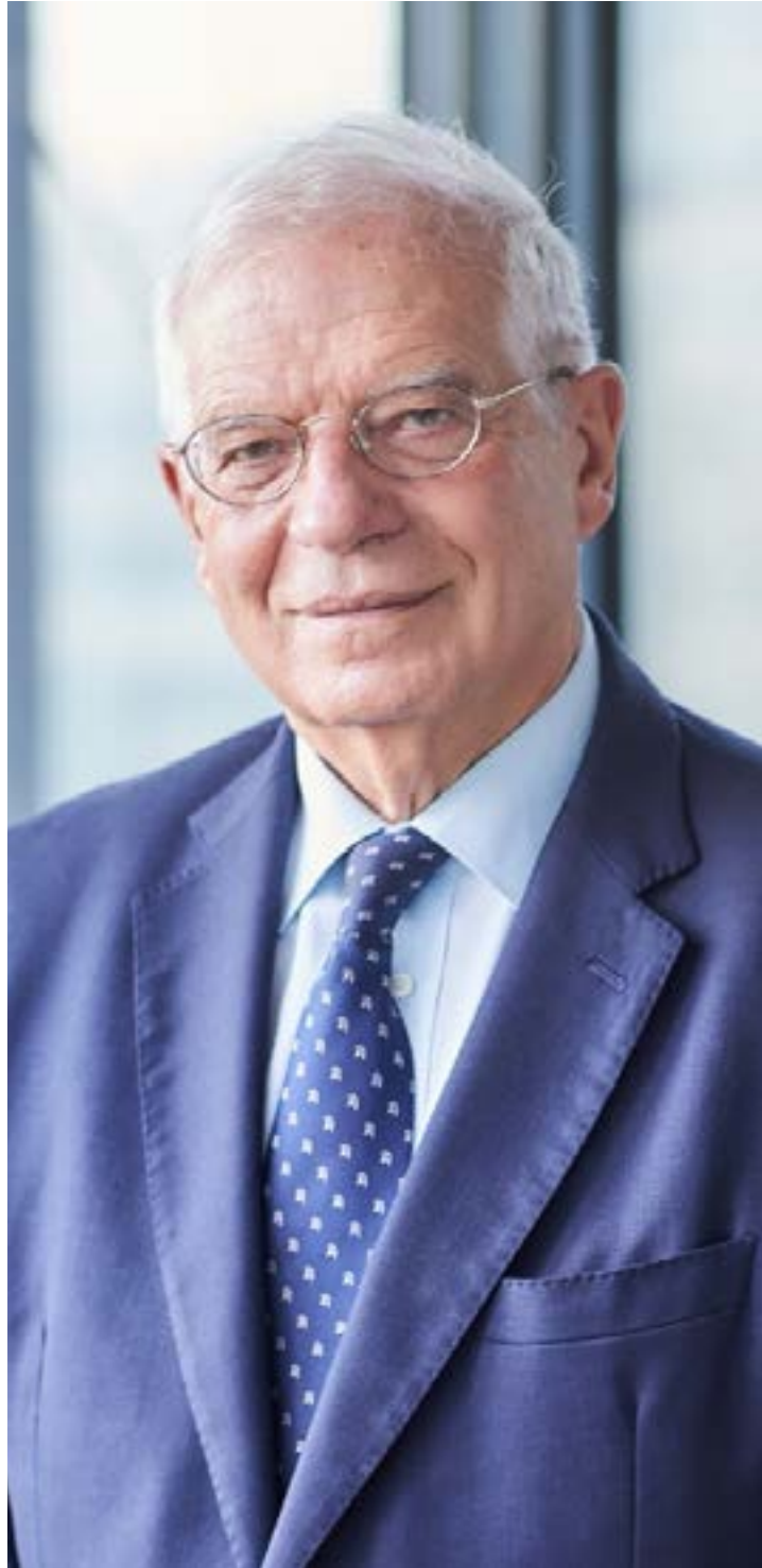
Josep Borrell Fontelles, Haut représentant de l'Union européenne pour les affaires étrangères et la politique de sécurité

Les sanctions contre la Russie sont-elles utiles ? Oui. Elles frappent déjà durement Vladimir Poutine et ses complices et leurs effets sur l'économie russe s'accroîtront au cours du temps.