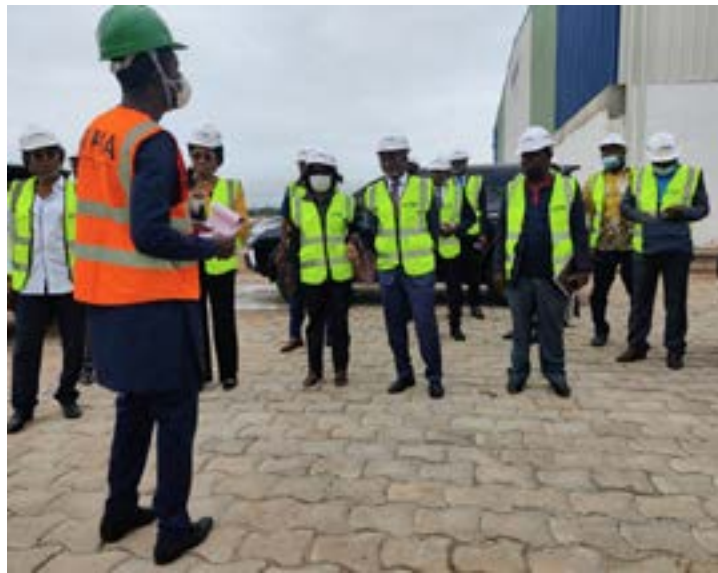
Vue partielle de la visite

La Plateforme industrielle d'Adétikopé (PIA) a reçu le 30 juin dernier la visite du Conseil national de crédit de la Banque centrale des Etats de l'Afrique de l'ouest (Bceao). Cette visite a permis de présenter aux membres de ce Conseil les avantages et les opportunités que présente la Plateforme.