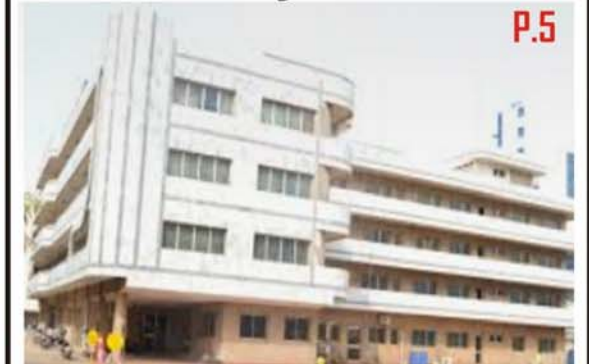
Le siège de l'INSEED à Lomé