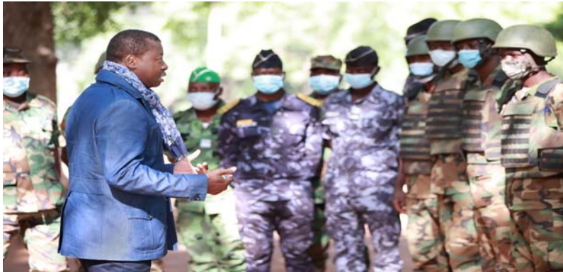
Le Président Faure Gnassingbé échangeant avec les soldats sur le terrain

produit. Le Président de la République a donné des instructions fermes pour la protection maximale des populations.