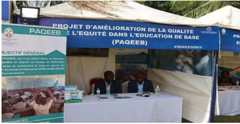
Une vue des stands

Sur les 4 années à venir, le Ministère des enseignements primaire, secondaire, technique et de l'artisanat veut instituer une vérification indépendante des indicateurs déclencheurs des résultats du projet. Pour cela, il va recruter un expert pour : évaluer la réalisation des indicateurs de performance pour les Conditions Basées sur la Performance (CBP), chaque année. Faire l'état de réalisation des CBP au cours de l'année précédente ; vérifier le niveau d'at-