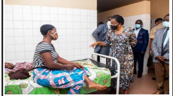
La PM Dogbé au chevet d'une patiente