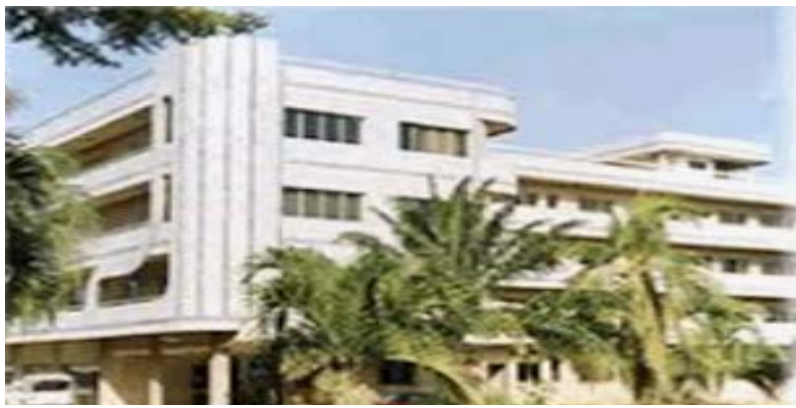
Le bâtiment de l'INSEED

Les indices des fonctions de consommation "Articles d'habillement et chaussures" et "Meubles, articles de ménage et entretien courant du foyer" ont également connu une hausse, du fait de l'augmentation du niveau