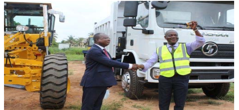
Remise symbolique des deux engins lourds

Il explique le choix du conseil en ajoutant : "donc il faut un minimum d'aménagement, un minimum de refaufilage, pour que les rues soient praticables, pour que l'image de la