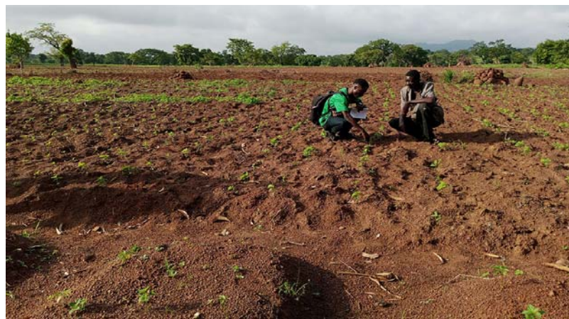
Des agriculteurs au champ

Grâce à ce don de la Banque africaine, quelques 25 500 producteurs agricoles, dont 40 % de femmes, vont recevoir 500 tonnes de semences certifiées climato-résilientes et 7 700 tonnes de fertilisants. Ils seront également accompagnés, dans la mise en valeur de 25 500 hectares de terres supplémentaires ; et des informations agro-climatiques leur seront régulièrement diffu-