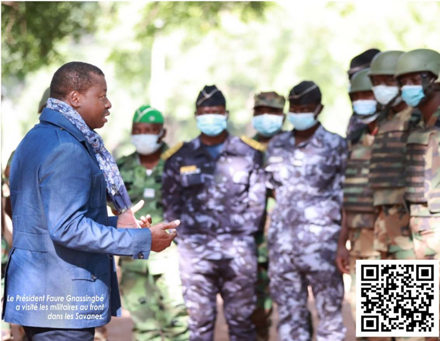
Le Président Faure Gnassingbé a visité les militaires au front dans les Savanes.