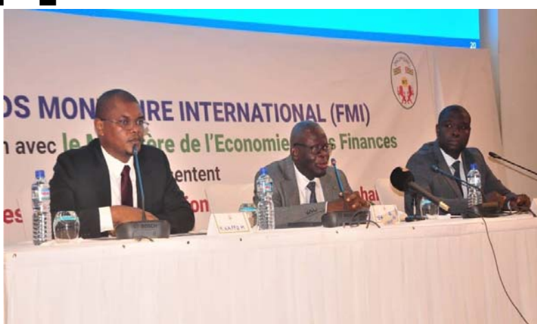
Les officiels lors de la rencontre

sion du nouveau choc sur les économies de la sous-région sont entre autres, les prix de l'énergie, des produits alimentaires et du coût du financement.