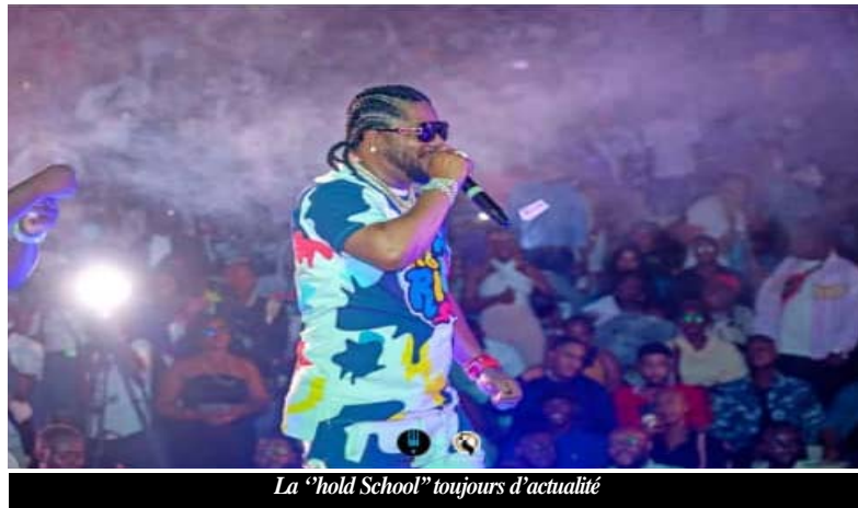
La "hold School" toujours d'actualité