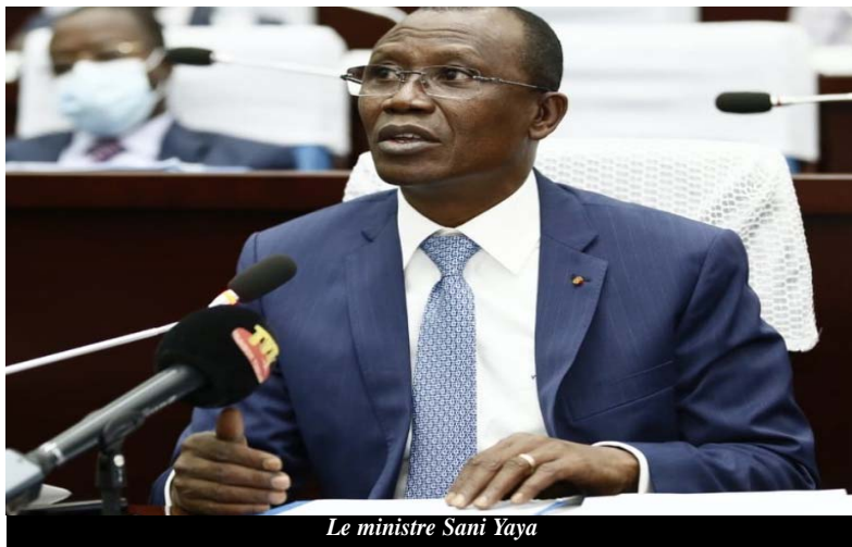
Le ministre Sani Yaya

L'Assemblée générale des actionnaires d'Africa 50 s'est tenue la semaine dernière à Marrakech au Maroc. Cette session a été l'occasion d'échanger sur le recyclage des actifs en tant qu'approche de financement innovante pour attirer davantage de capitaux d'investisseurs privés et institutionnels nationaux et internationaux dans les infrastructures africaines. Le recyclage des actifs est un moyen pour les gouvernements de lever des fonds assez rapidement pour financer leurs investissements. Cet instrument peut s'avérer pertinent dans le contexte de relance actuel.