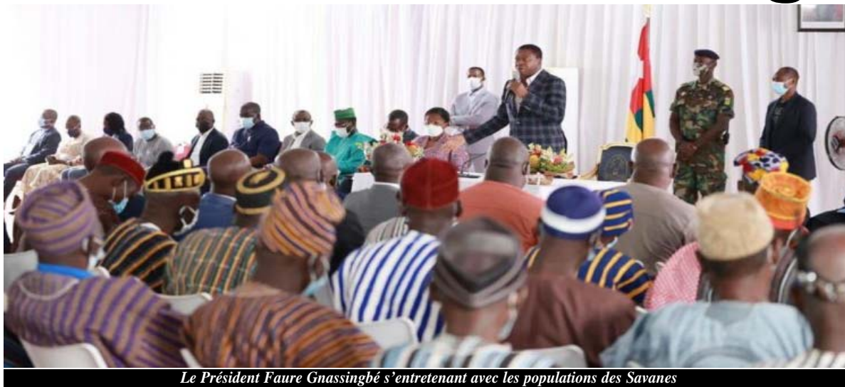
Le Président Faure Gnassingbé s'entretenant avec les populations des Savanes

Ainsi le mercredi 20 juillet dernier, Faure Gnassingbé était allé à la