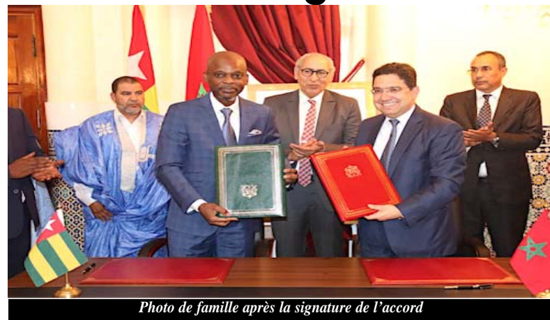
Photo de famille après la signature de l'accord

Depuis le 21 juillet 2022, le Togo a son consulat général à Dakla au Maroc. La cérémonie d'ouverture a été présidée par Robert Dussey, ministre togolais des affaires étrangères, de l'Intégration africaine et des togolais de l'extérieur en présence de son homologue marocain, Nasser Bourita. Lors de la cérémonie d'ouverture du consulat, les deux personnalités ont signé un accord portant sur la