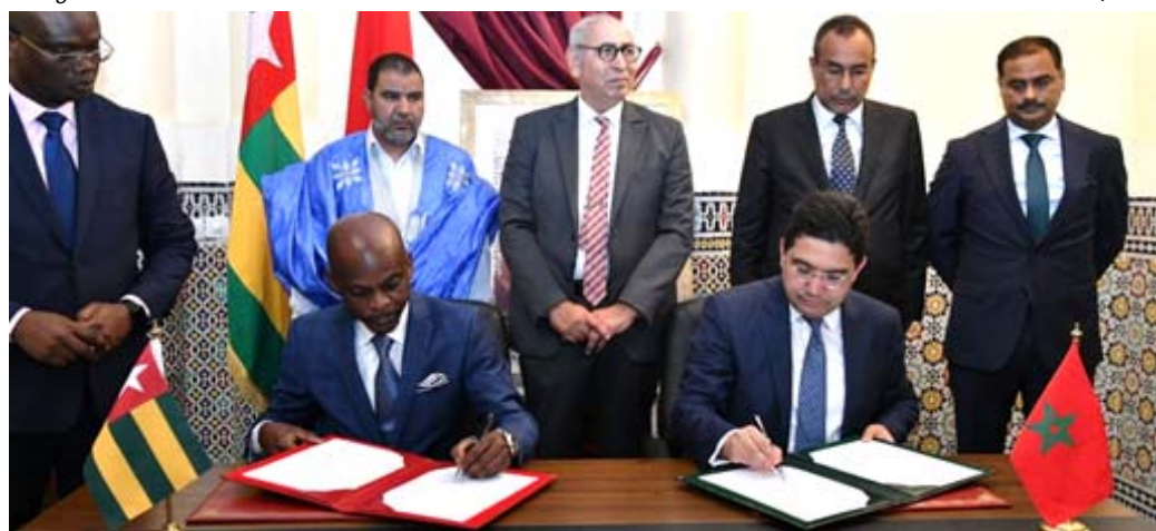
Signature de l'accord d'exemption de visas

En outre, M. Bourita a considéré que l'ouverture d'une représentation consulaire à Dakhla permet de revigorer les relations bilatérales en matière de formation, soulignant qu'il a été convenu d'octroyer 30 bourses supplémentaires au profit des étudiants togolais dans les centres et instituts de formation à Dakhla et Laâyoune. Ces bourses s'ajoutent aux 70 bourses académiques et 30 bourses de formation professionnelle, portant ainsi le nombre à 130 bourses, ce qui fait