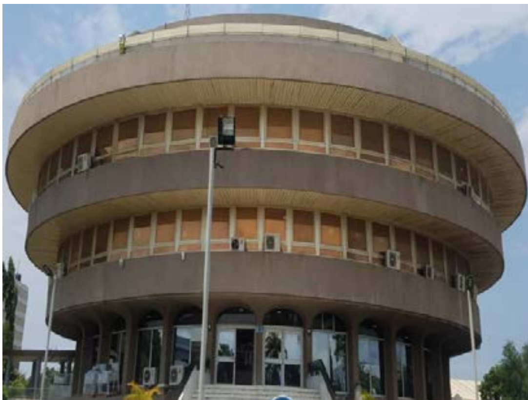
La direction du trésor public

L'objectif est de mobiliser l'épargne des personnes physiques et morales en vue d'assurer la couverture des besoins de financement du budget de l'Etat dans le cadre des plans de relance économique. Elle devrait permettre de contenir les effets de la pandémie COVID-19 et de renouer avec les performances d'avant la crise sanitaire. Pour rappel, les Obligations de relance sont un ensemble d'instruments qui permettent d'accompagner