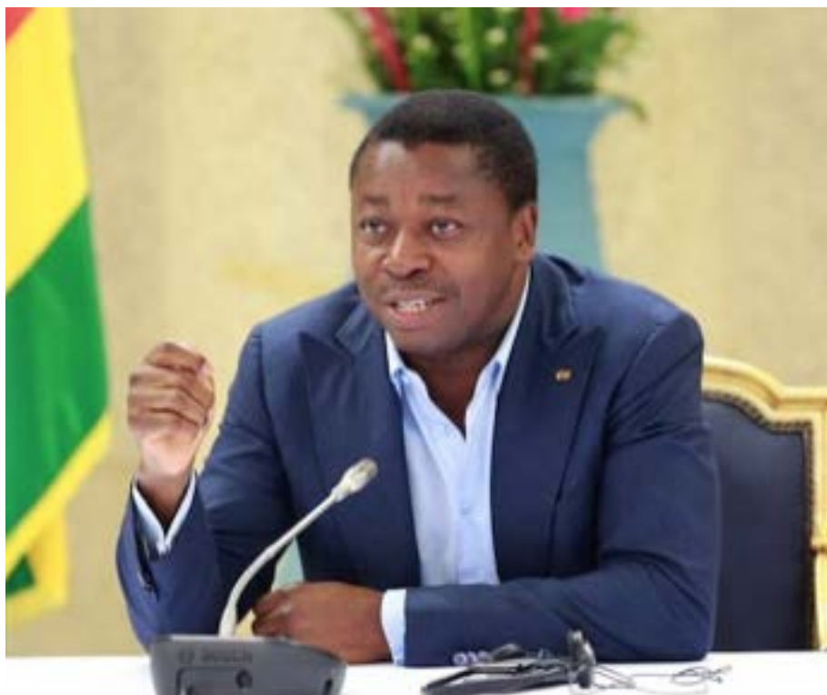
Faure Gnassingbé, président du Togo

Financé avec plus de 28 milliards de francs CFA (52 millions de