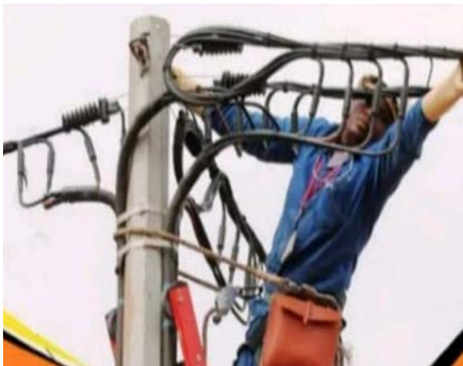
Maintenance de la CEET

centrales solaires sont prévues à Sokodé (préfecture de Tchoudjo) et à Awandjé (préfecture de la Kara) ayant respectivement des capacités de production de 60 et 80 MWc. Des travaux pour lesquels des indemnités sont prévues à l'endroit des populations qui seront expropriées dans les périmètres des sites devant abriter les centrales.