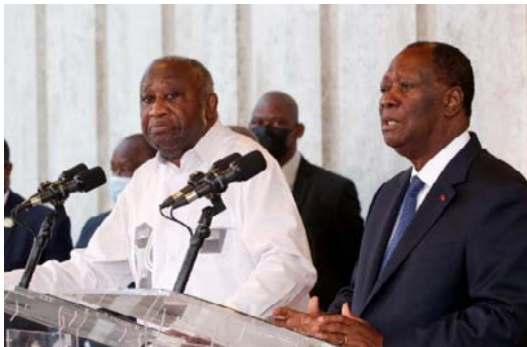
Gbagbo et Ouattara

En choisissant de gracier Laurent Gbagbo, Alassane Ouattara effectue un geste politique important. Car cette condamnation dans l'affaire dite « du casse de la Bceao » était au cœur des discussions entre le camp Gbagbo et le pouvoir ivoirien depuis deux ans, avant même son acquittement définitif par la CPI en 2021. Laurent Gbagbo qui n'a jamais admis cette condamnation, n'a d'ailleurs jamais été réellement inquiété pour cette affaire depuis son retour en Côte d'Ivoire en juin 2021. Mais la condamnation restait pendante.