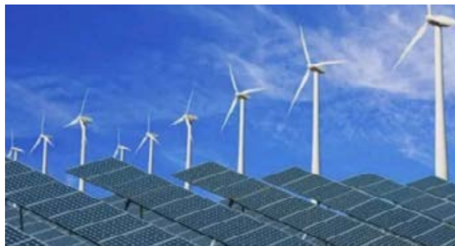
Les plaques solaires

Lancé par le chef de l'État en décembre 2017, le projet d'électrification rurale Cizo apportera de l'électricité à 02 millions de Togolais à l'horizon 2022. Parallèlement à cet objectif, l'État injecte 46 milliards de francs CFA dans le Programme d'extension de réseau électrique dans les centres urbains du Togo (Perecut). Un investissement grâce auquel 500 000 personnes dans