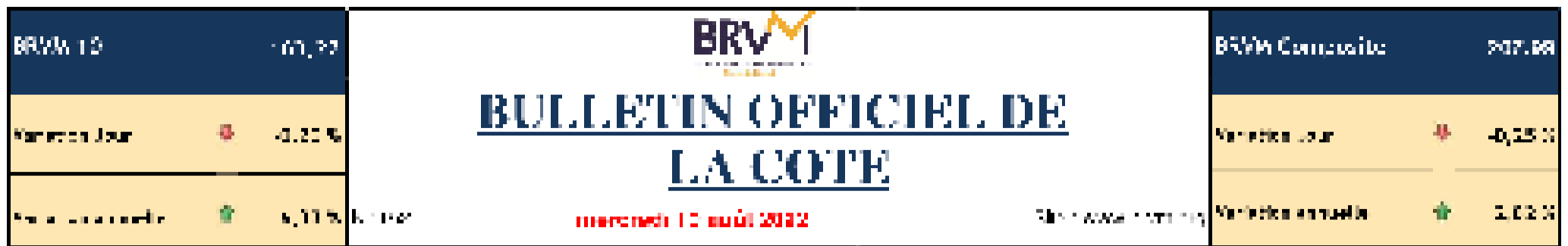
Evolution de la cote