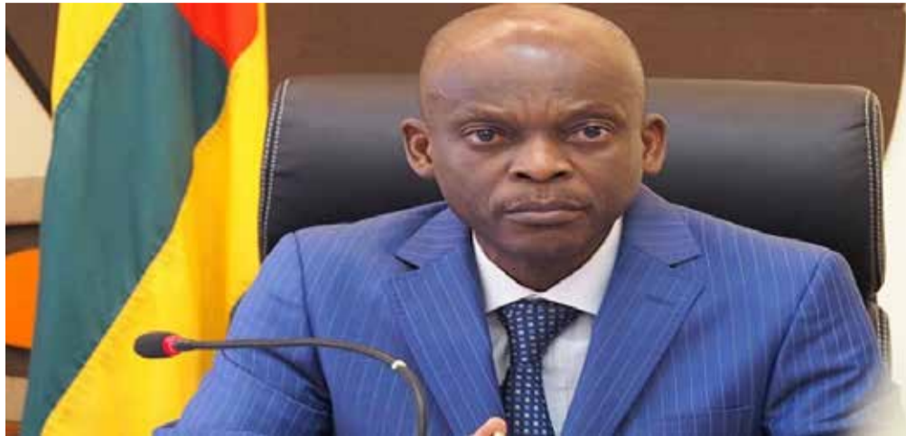
PROF ROBERT DUSSEY ministre en charge des Affaires étrangères

Invité d'honneur au sommet mondial de la jeunesse pour la paix qui se tient à Islamabad, le Togo est représenté par le ministre des Affaires étrangères, de l'intégration régionale et des Togolais de l'étranger, le Professeur Robert Dussey. Cette rencontre internationale se tient les 11 et 12 août 2022 à Islamabad au Pakistan. A en croire les organisateurs, le sommet mondial de la jeunesse pour la paix est une plate-forme conçue par des jeunes prometteurs. Ce sommet quatrième du genre, communique quelque chose de spécifique d'harmonie, de succès, d'amabilité et d'avancement dans le monde entier. Il attire des jeunes