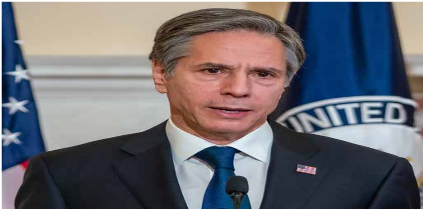
Antony Blinken secrétaire d'Etat Américain

Ce programme dénommé « Global Fragility Act », est doté d'une enveloppe de 2 milliards de dollars qui sera étalée sur une période de dix ans pour soutenir la démocratie et la bonne gouvernance en Afrique subsaharienne. Global Fragility Act, vise à favoriser des sociétés plus pacifiques, plus inclusives et plus résilientes dans des endroits où les conditions sont propices aux conflits. L'initiative concerne plusieurs pays tels que le Mozambique et les pays côtiers d'Afrique de l'Ouest tels que le Bénin, la Côte d'Ivoire, le Ghana, la Guinée et le Togo. Selon le secrétaire d'Etat américain, cette stratégie s'appuie sur