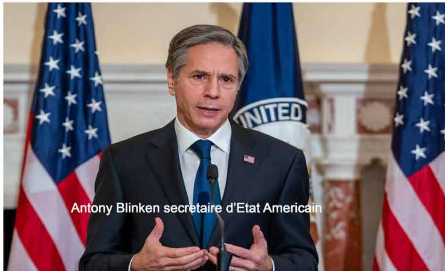
Antony Blinken secrétaire d'Etat Américain