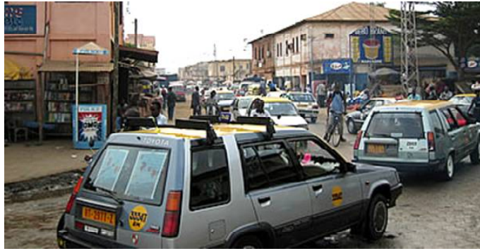
La fonction "Transports" a fait bondir les prix

L'Indice national harmonisé des prix à la consommation (INHPC), produit mensuellement, permet de capter l'évolution des prix à la consommation. Il est calculé à partir d'une méthodologie harmonisée pour les huit pays membres de l'Union économique et monétaire ouest africaine (UEMOA) dont le Togo. Il prend en compte aussi bien le milieu urbain que rural ; sa couverture est donc nationale. Pour le mois de juillet 2022 , l'Institut national de la statistique et des études économiques et démographiques (INSEED) renseigne que l'INHPC a progressé de 0,3% par rapport à son niveau de juin 2022. C'est la