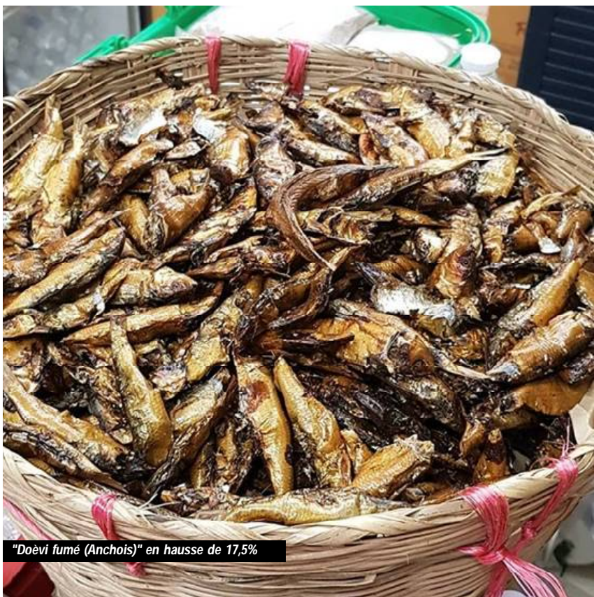
"Doèvi fumé (Anchois)" en hausse de 17,5%