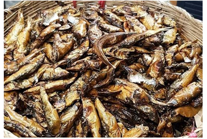
"Doëvi fumé (Anchois)" en hausse de 17,5%

taires, le niveau général des prix a enregistré une hausse de 0,5% sur le plan national. L'inflation sous-jacente (variation mensuelle de l'indice hors énergie, hors produits frais) a également progressé de 0,4%. Eu égard à l'état des produits, les prix ont augmenté de 0,6% pour les produits de l'« Énergie » et diminué de 0,6% pour les « Produits frais ». Relativement à la provenance, les prix des produits « importés » ont progressé de 1,5% et ceux des produits « locaux » ont diminué de 0,3%. Du point de vue de la classification sectorielle, la hausse du niveau général des prix est principalement due à celle des prix des produits du secteur secondaire (+0,7%). Pour ce qui est de la durabilité, la hausse observée provient essentiellement de l'augmentation des prix des produits « Semi-durables » (+0,8%).