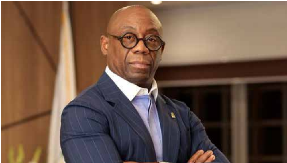
SERGE EKUE président de la BOAD

La Banque ouest africaine de développement (BOAD) a au cours de l'année 2021 financé plusieurs projets dans les pays membres de l'Union économique et monétaire ouest africain (UEMOA) en vue du renforcement de l'intégration régionale. Les projets ayant contribué le plus à cet axe sont entre autres, le projet de création et d'exploitation d'un parc industriel et logistique par la société Plateforme industrielle d'Adétikopé (PIA) au Togo. D'une superficie de 132 ha, le projet financé à hauteur de 20 milliards FCFA, va favoriser le renforcement de la capacité de traitement des marchandises du port autonome