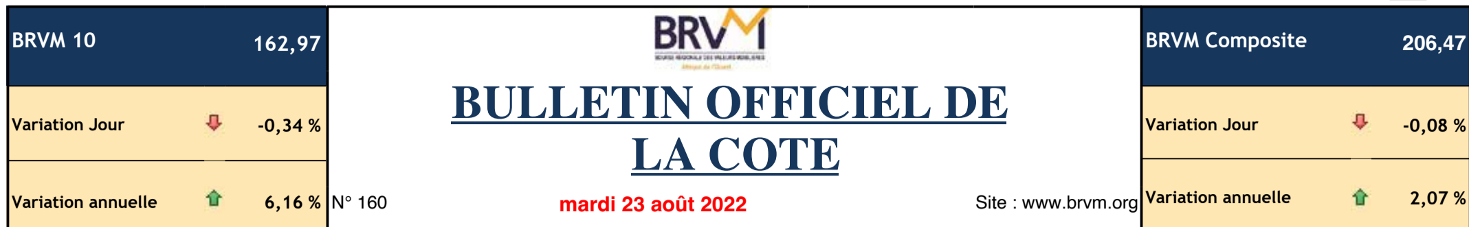
Evolution des indices