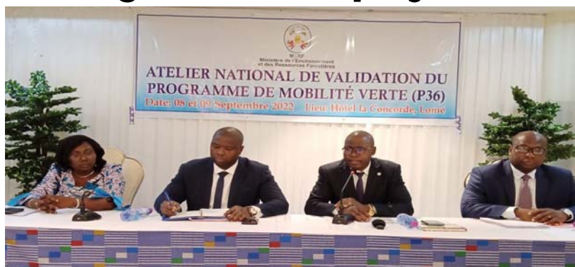
La table d'honneur

L e projet d'appui à la transition vers la mobilité électrique au Togo a été lancé ce 5 septembre 2022 à Lomé, par le ministère de l'environnement et des ressources forestières. Il est financé par le Fonds pour l'Environnement Mondial (FEM), et a pour agence d'exécution, le Programme des Nations Unies pour l'Environnement (PNUE).