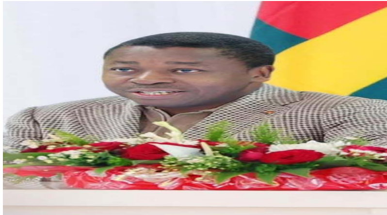
Une vue des membres du gouvernement lors des travaux présidés par le Chef de l'Etat

Selon le Gouvernement, ces rencontres périodiques permettent de renforcer le dispositif de la mise en œuvre des projets en relevant les bonnes pratiques, les difficultés et tous les autres goulots d'étranglement dans leur exécution. Une fois les difficultés identifiées, des solutions sont préconisées pour un aboutissement heureux des projets. Construite autour de la vision " un Togo en paix, une Nation moderne avec une croissance économique inclusive et durable ", la feuille de