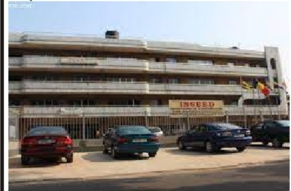
Le siège de l'INSEED à Lomé.