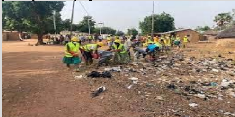
Une opération de ramassage d'ordures

Des recherches effectuées par des experts ont permis de conclure qu'un sac en plastique prend environ 400 ans avant de se dégrader, soit 04 siècles, ce qui n'est pas rien. Au rang des nombreuses initiatives prises pour garder la ville de Lomé et