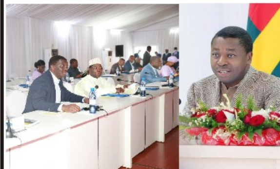
L'exécutif au complet autour du Chef de l'Etat lors des travaux.