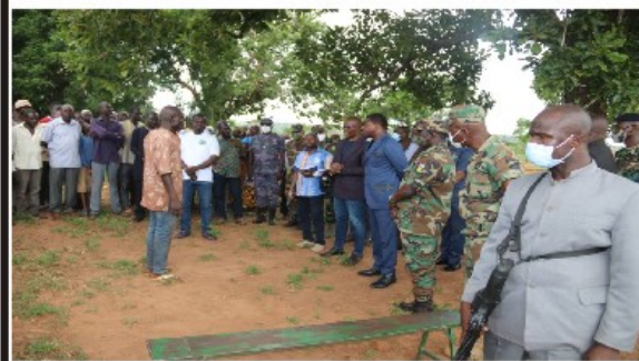
Le Chef de l'Etat, Faure Gnassingbé, au contact des populations des Savanes.