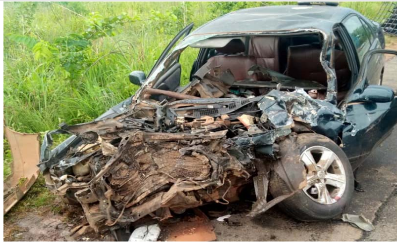
Un cas d'accident de la route

Il faut dire que durant tout le semestre, la Police et la Gendarmerie ont procédé à des sensibilisations des usagers sur le code de la route, les facteurs de risque des accidents de la circulation, la nécessité et la procédure d'obtention du permis de conduire catégorie A. Notamment aux fidèles des Témoins de Jéhovah