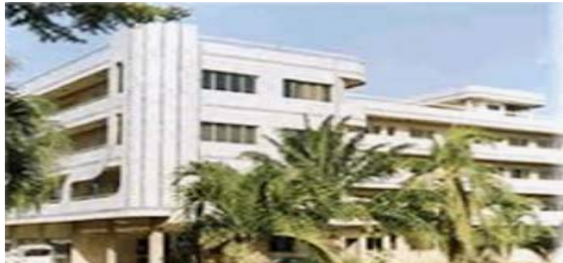
Le bâtiment abritant le siège de l'INSEED à Lomé

L'augmentation du niveau des indices, observée en août 2022, est le fait du renchérissement des variétés suivantes : "Gas-oil ordinaire dans les stations-services administrés" (+14,9%) ; "Essence "SUPER" dans les stations-services administrés" (+6,7%) ; "Mélange 2 temps" (+5,5%) ; "Essence mélange de rue" (+1,0%) ; "Essence super de rue" (+0,3%) ; "Transport inter-urbain, Lomé-Aného" (+16,7%) ; "Transport inter-urbain en minibus, Lomé-Sokodé"