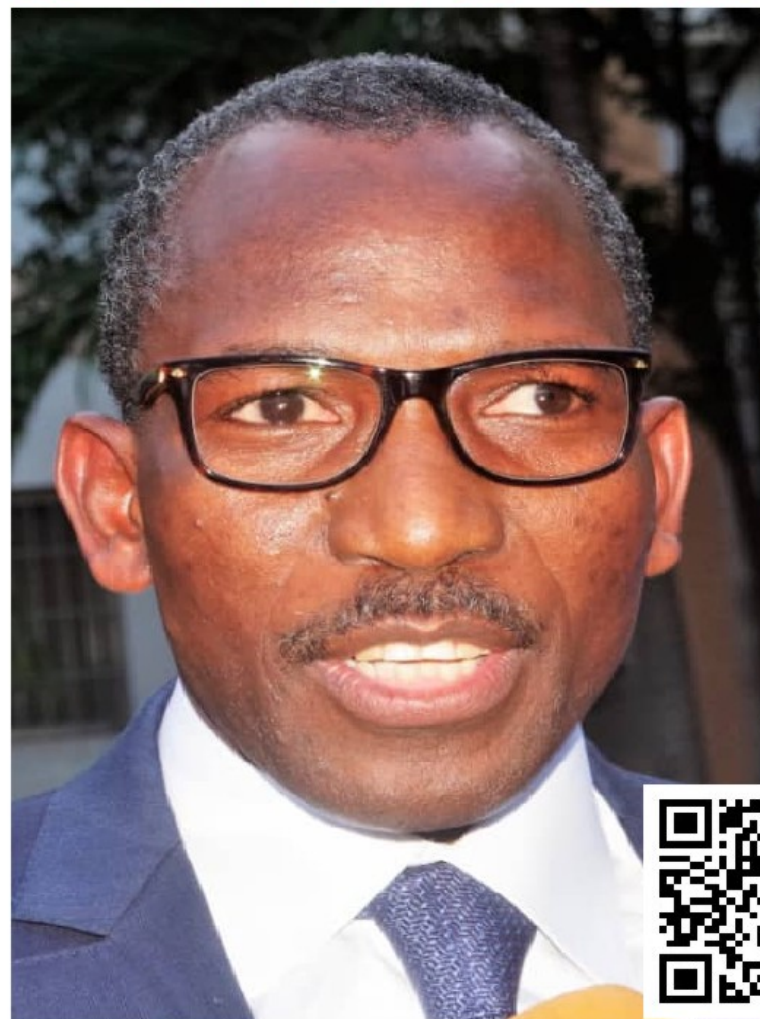
Le ministre Gilbert Bawara