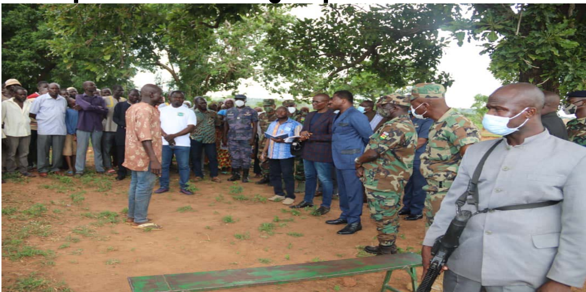
Le Chef de l'Etat, Faure Gnassingbé, au contact des populations des Savanes

C'est ce qui a été fait pendant les trois premiers mois de l'état d'urgence. Mais aussi, cette période a permis aux forces de défense et de sécurité (FDS) d'intensifier les échanges avec les populations, de renforcer la