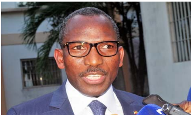
Le ministre Gilbert Bawara

"Dans les prochains jours, les résultats du dernier concours de