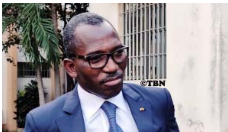
Le ministre Gilbert Bawara

claré Gilbert Bawara, ministre en charge du dialogue social. Le ministre est conscient que les périodes de rentrée scolaire sont des moments d'angoisse pour les parents d'élèves par rapport à la situation de la vie chère et au coût des fournitures. Il a évoqué la situation en Ukraine et son impact marqué par une inflation galopante, l'augmentation des prix des produits pétroliers, la crise sécuritaire avec les attaques terroristes enregistrées dans la région des savanes. Des situations qui ont provoqué la vie chère. « Le gouvernement a saisi l'occasion pour expliquer les mesures prises à savoir la subvention des engrais, les exonérations sur certains produits. Nous avons écouté aussi les préoccupations que les organisations syndicales avaient. Nous avons pris conscience que nous devons