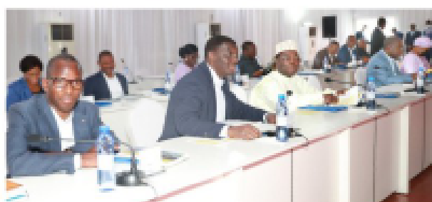
Vue partielle des ministres lors du séminaire