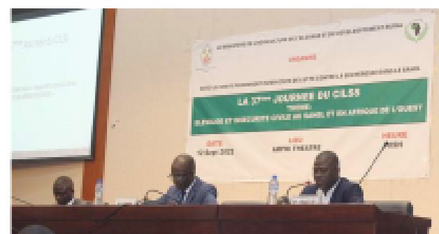
Table d'honneur lors de la journée du CILSS