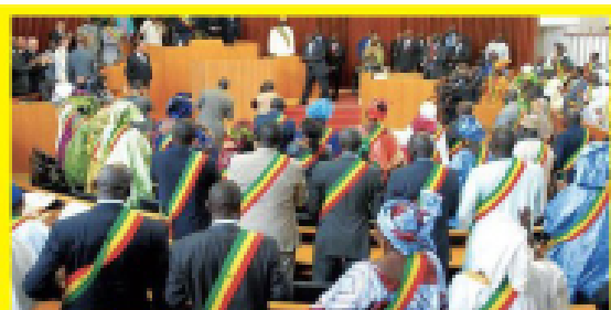
Scène barbare à l'Assemblée nationale