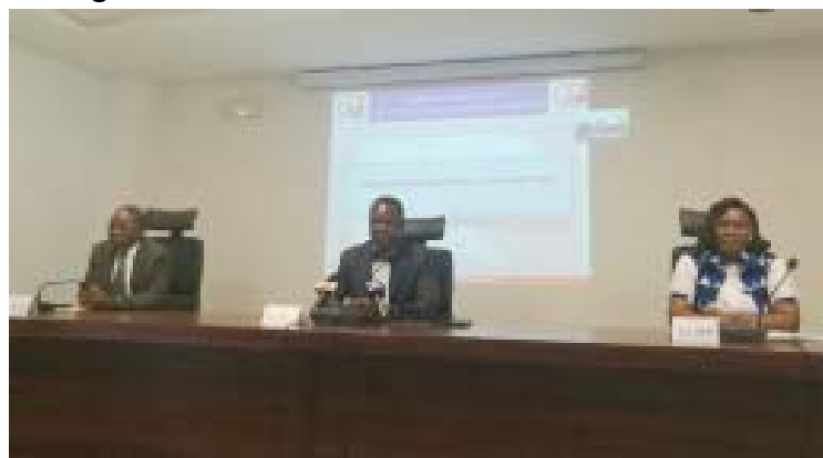
Table d'honneur à l'ouverture de la célébration

L'Office Togolais des Recettes (OTR) introduit désormais dans l'agenda annuel de ses activités, une journée « sécurité et santé au travail ». La première édition de cette journée -dont le but est d'assurer le bien-être des agents- a été observée, vendredi 9 septembre 2022 au siège de l'institution.