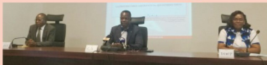
Table d'honneur à l'ouverture de la célébration