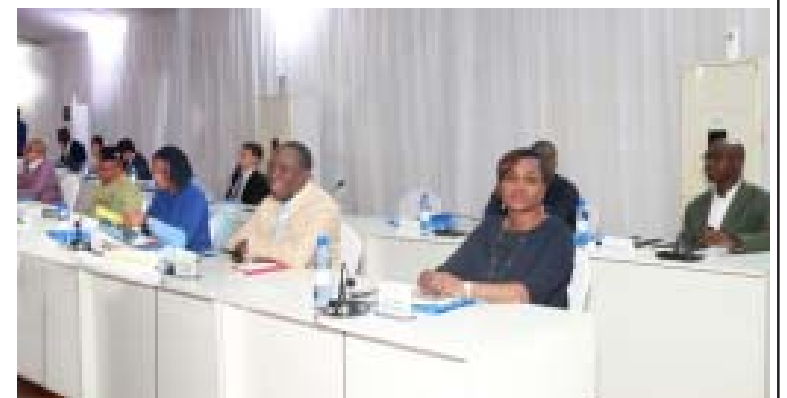
Vue partielle des ministres lors du séminaire

A la fin des deux jours d'intenses activités il est annoncé de fortes résolutions prises par l'exécutif pour améliorer le quotidien de la population dans différents domaines. Avec l'appui de partenaires techniques et d'experts, les membres du gouvernement ont réfléchi sur la