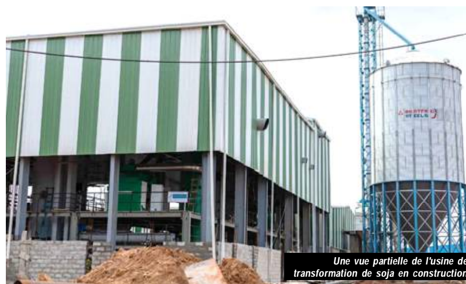
Une vue partielle de l'usine de transformation de soja en construction