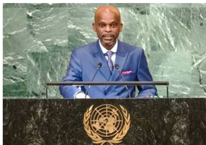
Prof. Robert DUSSEY, Ministre des Affaires Etrangères

Justement, en parlant de ce Conseil de sécurité, le chef de la diplomatie togolaise s'interroge : «Nous foulons bien trop souvent aux pieds nos engagements multilatéraux. Nous leur avons parfois enlevé toute leur essence, leur force et leur racine. Sinon comment comprendre que le Conseil de sécurité demeure encore aussi exclusif ? Pourquoi ne pas travailler de bonne foi à la réforme de cet organe important du système sécuritaire interna-