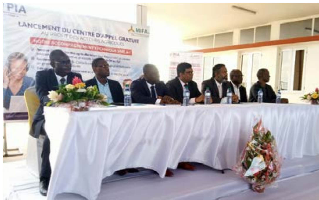
La table d'honneur au lancement

Le centre d'appel est installé au siège du Mécanisme incitatif de financement agricole fondé sur le partage de risques à Lomé