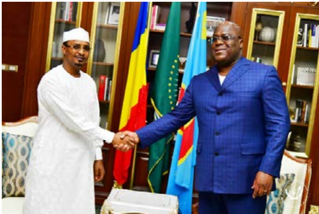
Mahamat Déby et Félix Tshisekedi

Le président congolais Félix Tshisekedi est désigné, mardi 25 octobre, « facilitateur » dans la crise tchadienne par la Communauté économique des Etats de l'Afrique centrale (Ceeac), réunie en sommet extraordinaire à Kinshasa, selon le communiqué final de la rencontre.