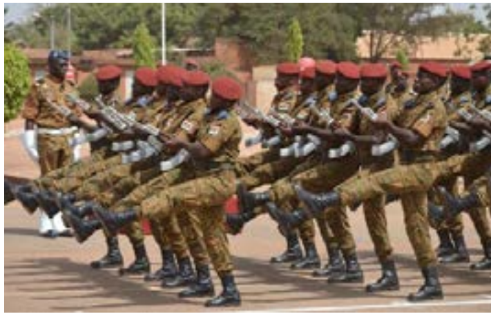
Parade de militaires burkinabé

Ils reçoivent une formation civile et militaire de quatorze jours avant d'être armés et dotés de moyens de communication. Ces volontaires paient un lourd tribut dans les attaques djihadistes qui frappent