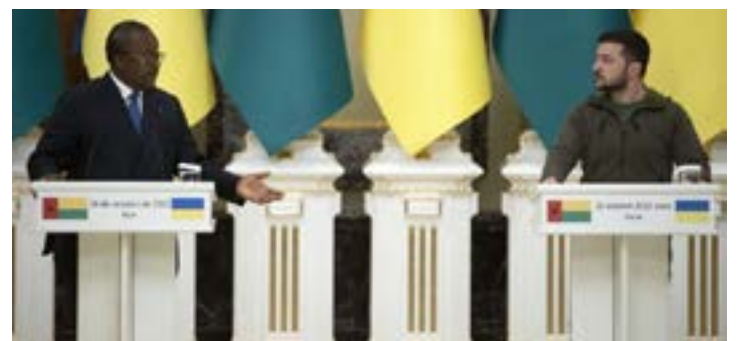
Umaro Sissoco Embaló et Volodymyr Zelenski

En Ukraine, et avant d'être reçu par le président Zelenski