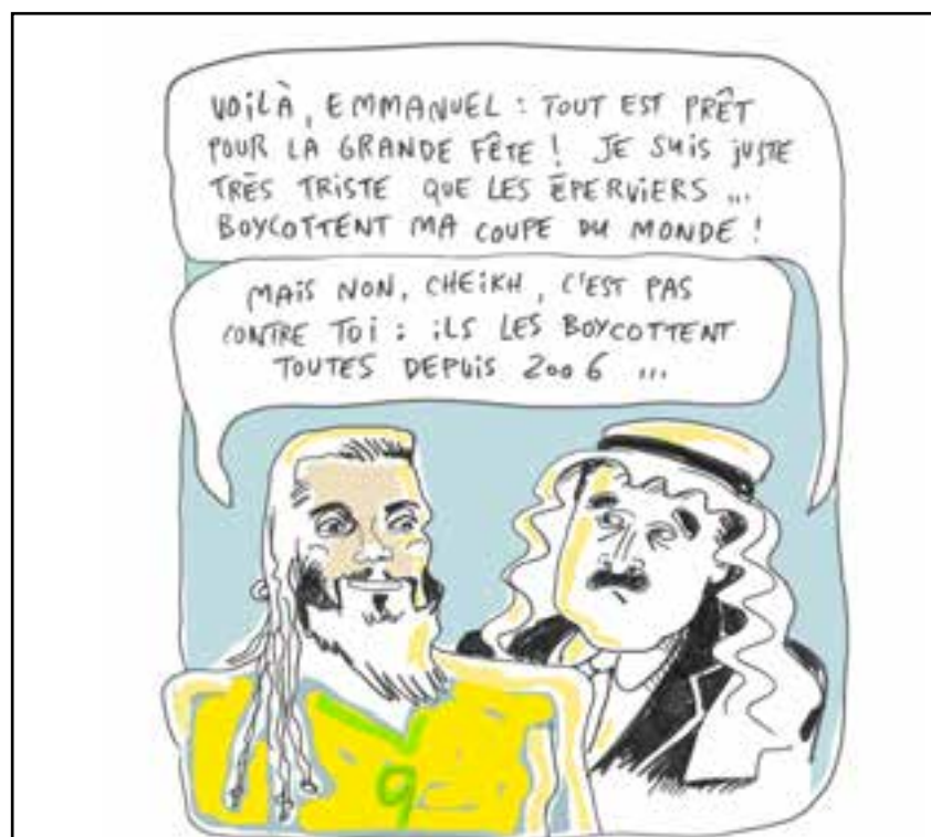
Dessin de S. Tatchev