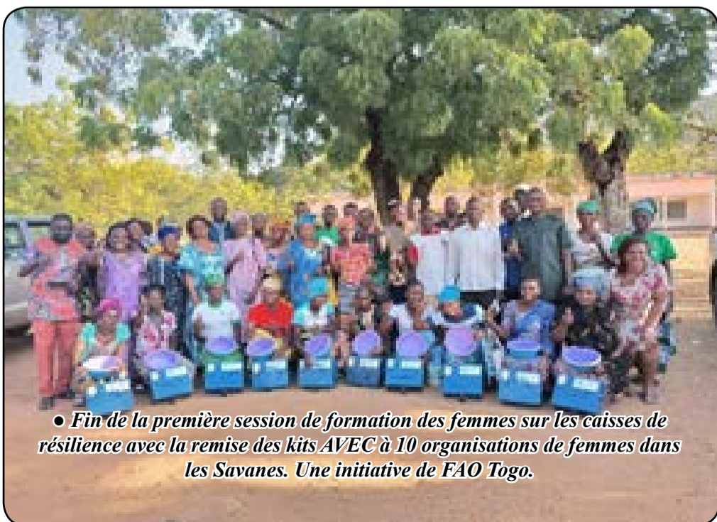
● Fin de la première session de formation des femmes sur les caisses de résilience avec la remise des kits AVEC à 10 organisations de femmes dans les Savanes. Une initiative de FAO Togo.