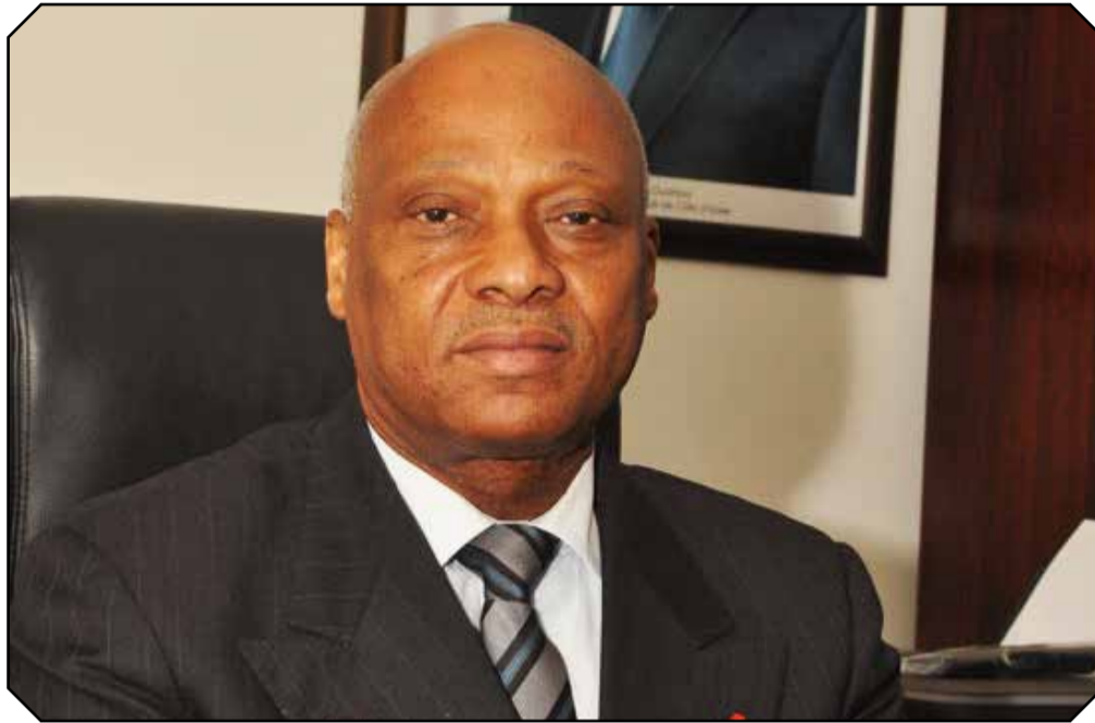
Jean-Claude Kassi Brou directeur de la Banque Centrale

Selon le communiqué signé du président du Comité de Politique Monétaire (CPM), Jean-Claude Kassi Brou, le principal taux directeur auquel la Banque Centrale prête ses ressources aux banques passe de 2,50% à 2,75%. « Cette hausse, la troisième de cette année, s'inscrit dans le cadre de la normalisation graduelle de la politique monétaire entamée depuis juin 2022. Elle devrait contribuer à ramener progressivement l'inflation dans l'intervalle cible de la Banque Centrale (1% à 3%) sur le moyen terme », indique le communiqué de la BCEAO. Le taux d'inflation dans