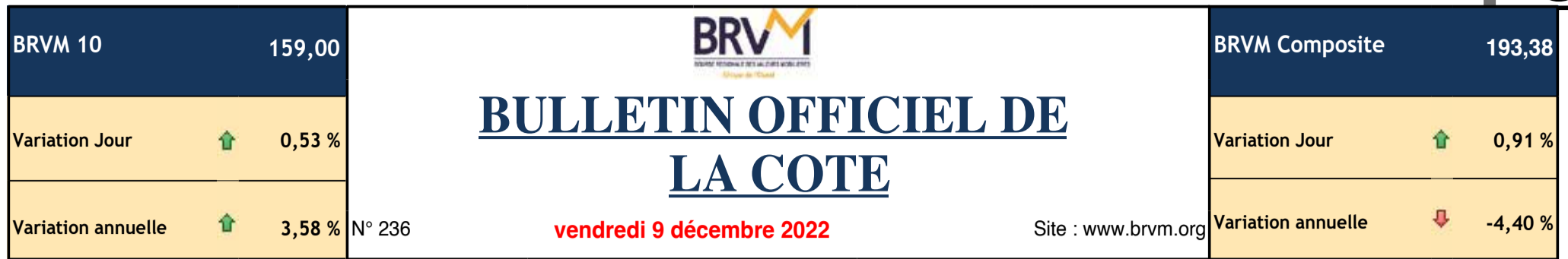
Evolution des indices