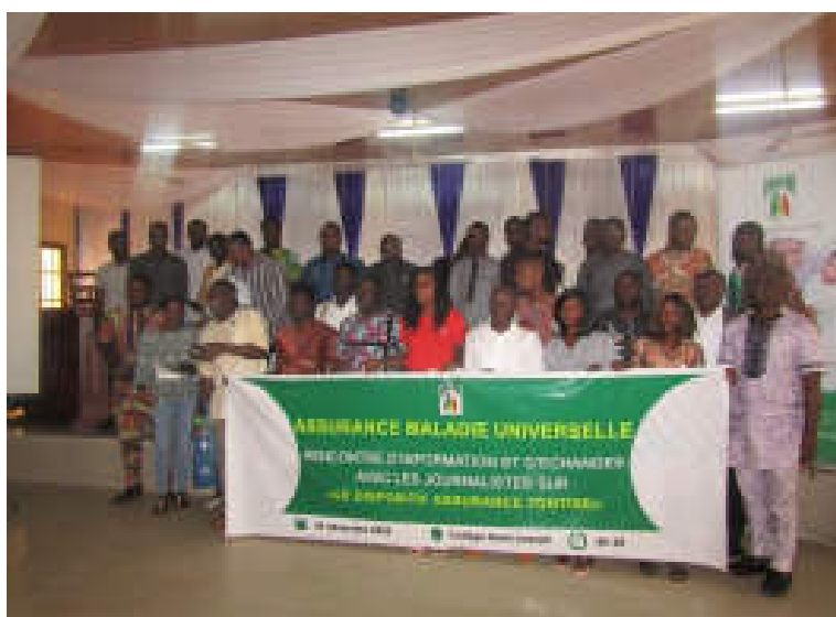
Photo de famille

Le dispositif « assurance tontine » permet également au souscripteur, de payer ses cotisations par transfert d'argent (Tmoney ou Flooz) par tranche et à une fréquence adaptée aux activités sous forme de tontine. Les personnes morales agréées appelées agrégateurs sont identifiées