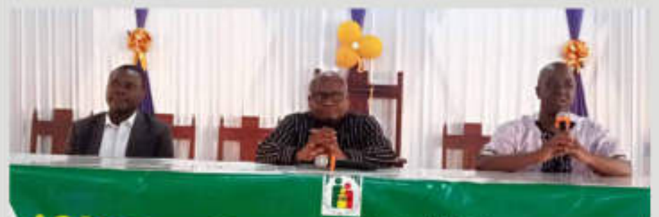
Des responsables de l'INAM

Le dispositif « Assurance- Tontine », présenté aux journalistes par l'INAM P.5