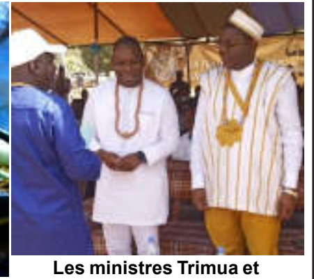
Les ministres Trimua et Lamadokou

mercier les mânes des ancêtres et le Tout Puissant pour la protection inlassable des familles des deux communautés ; ce qui aura permis une bonne récolte à la fin de l'année.