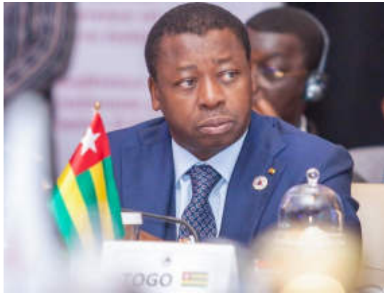
Le Chef de l'Etat Faure Gnassingbé

« Cette rencontre internationale de haut niveau intervient dans un contexte mondial particulier, marqué par des crises économique, sanitaire et sécuritaire. Les