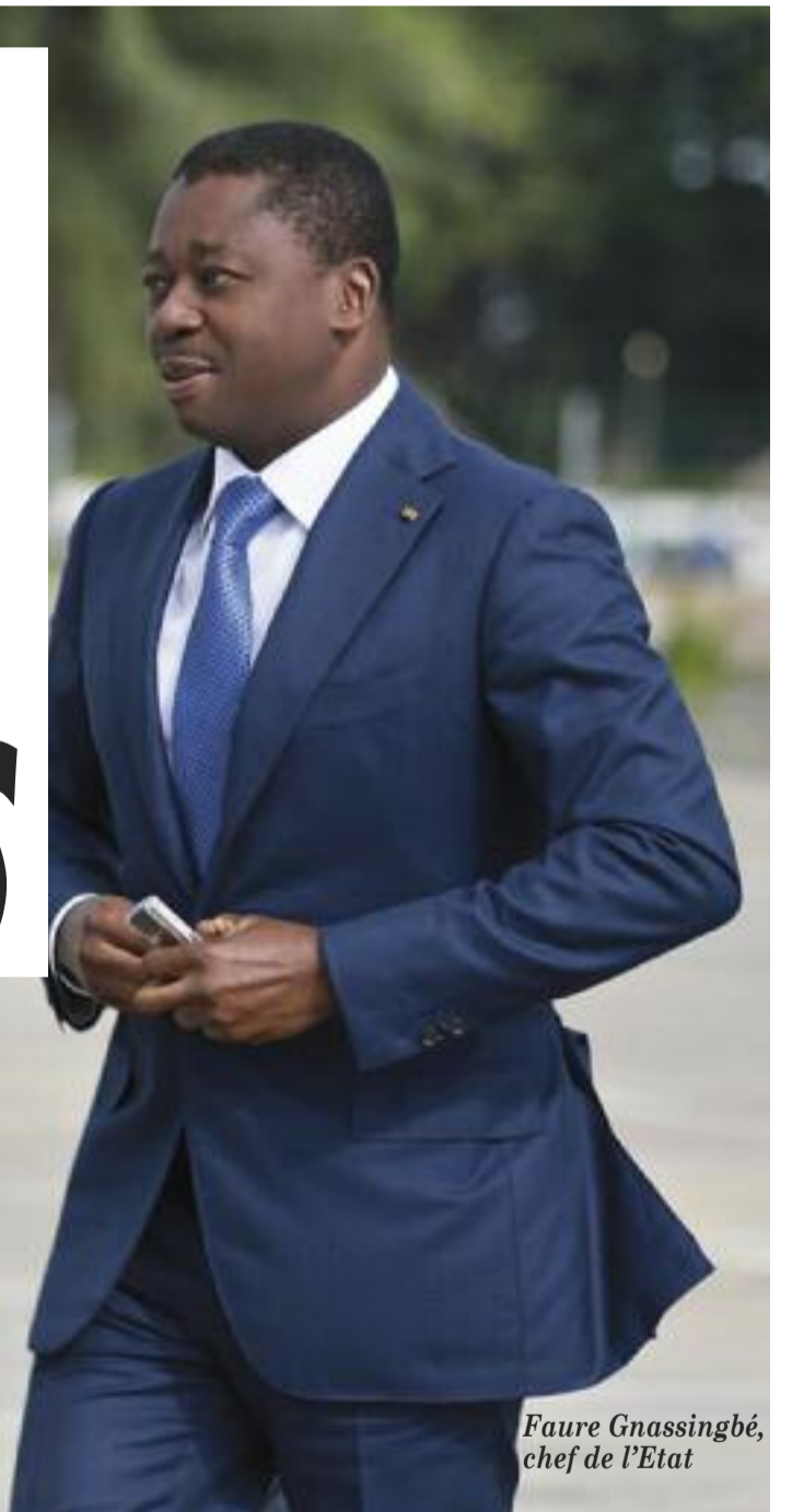
Faure Gnassingbé, chef de l'Etat

F aure Gnassingbé, le président de la république a adressé le 31 décembre 2022, son discours à l'occasion des vœux de la nouvelle année 2023. Un discours axé sur la lutte contre le terrorisme, l'inclusion sociale, et les élections