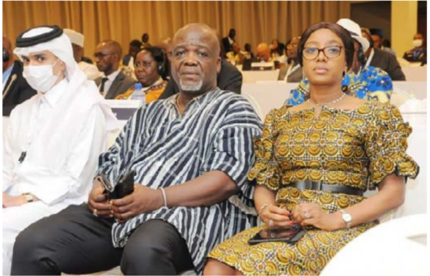
Des députés togolais aux côtés des participants internationaux