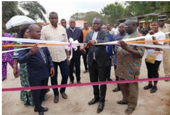
Coupure de ruban à l'EPP Aklakou

Pour soutenir le secteur de l'éducation, GTA Assurances a construit deux blocs sanitaires d'un montant total de 16 millions FCFA aux Écoles primaires et publiques (EPP) d'Aklakou et de Zalivé. La cérémonie d'inauguration de ces infrastructures s'est déroulée, vendredi 20 janvier, dans ces deux localités situées respectivement dans les communes des Lacs 2 et Lacs 1.