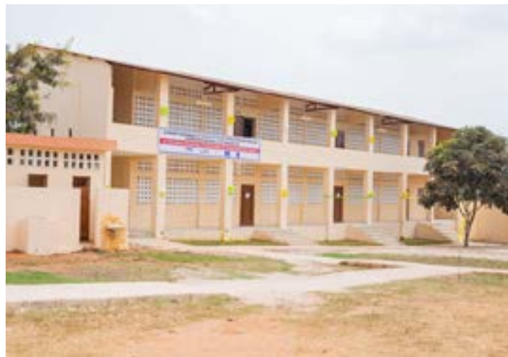
Le nouveau visage de l'EPP d'Adétikopé Centrale

Le projet de reconstruction de cette école a commencé en février 2022 et les travaux ont duré 11 mois. Les nouveaux blocs scolaires et l'extension de l'établissement scolaire ont été réalisés par l'entrepreneur et partenaire M/s AFALCO.