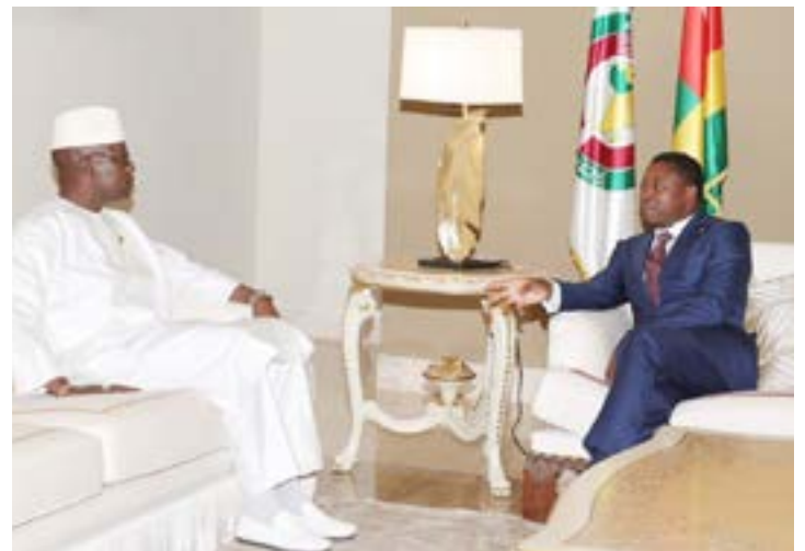
... avec Malick Diaw, président du Conseil national de Transition (CNT) du Mali

jeunesse un acteur clé de la lutte contre les menaces sécuritaires. Le chef de l'Etat a accordé aussi une audience au colonel Malick Diaw, président du Conseil national de Transition (CNT) du Mali.