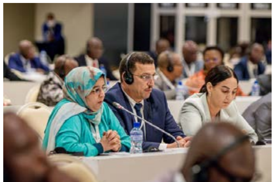
Une partie de l'assistance