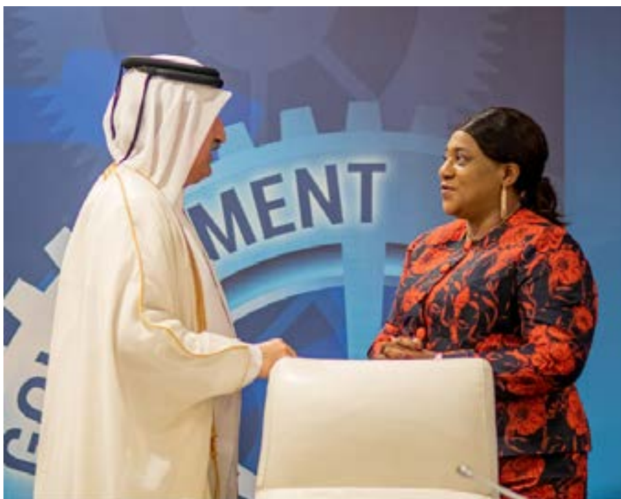
Expression de la complicité entre le Togo et le Qatar dans cette lutte