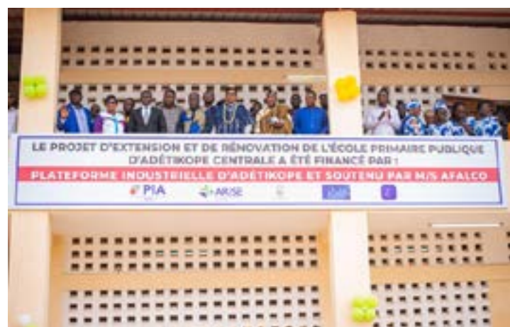
Photo de famille des bénéficiaires et officiels

les installations connexes, les dirigeants de la PIA, les partenaires, et toutes les parties prenantes ont officiellement remis à l'administration locale, et aux enseignants les bâtiments rénovés ainsi que