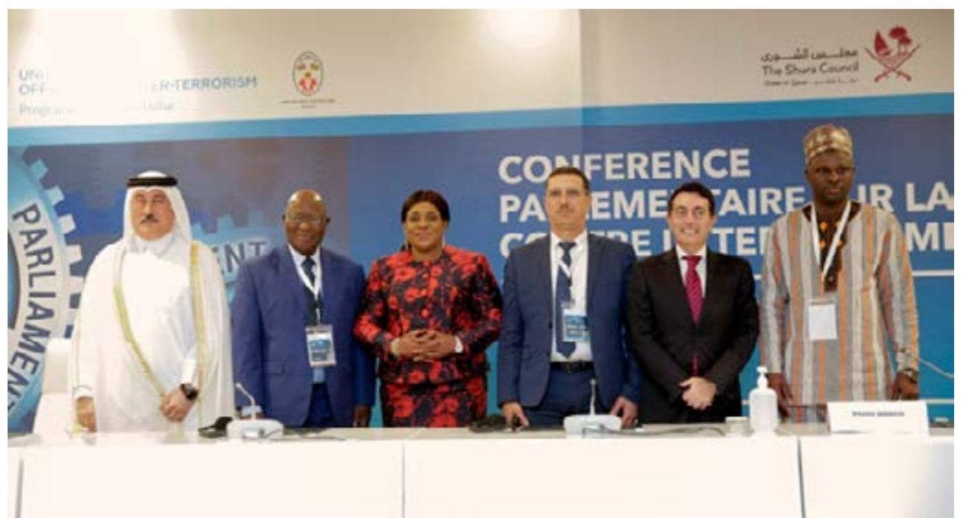
Le présidium à la fin des travaux

été faite, le groupe disposera d'un cadre de travail pour agir selon les priorités définies par les Parlements eux-mêmes. Un plan