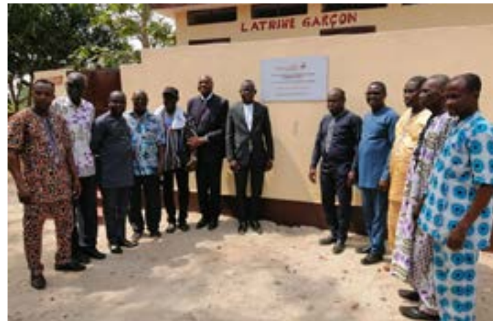
Photo de famille avec les autorités à l'EPP Zalivé

d'Aklakou. Un bloc sanitaire composé de 4 latrines et des urinoirs d'un coût total de 8 millions FCFA a été également offert à cette école pour une meilleure santé des élèves et l'assainissement du village. La société a reçu les remerciements des