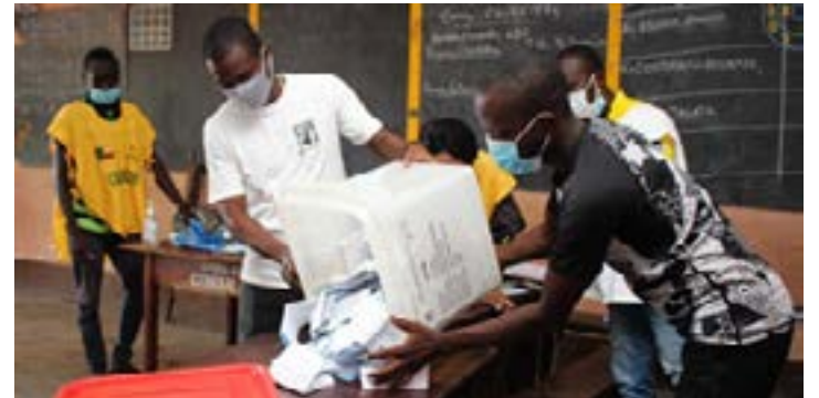
Opération de décompte de voix dans un bureau de vote au Bénin

de ce principal recours, le parti Les Démocrates a déposé 6 autres pour l'invalidation des sièges d'élus du camp Talon.