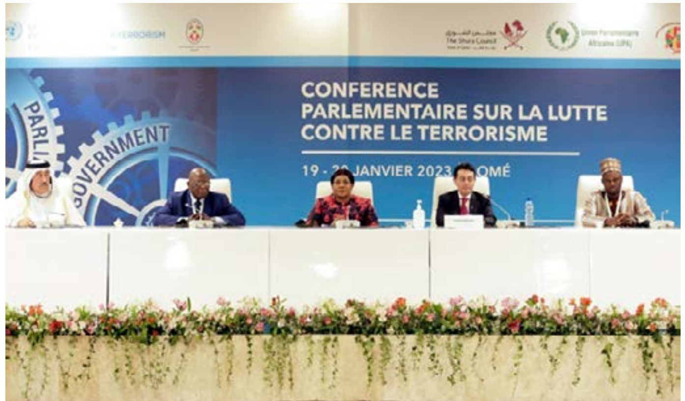
La table d'honneur lors de la clôture