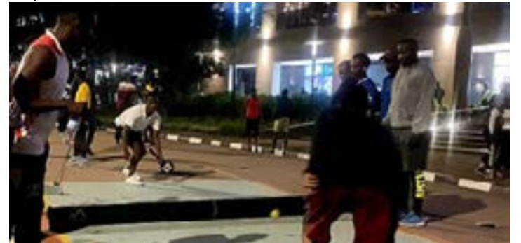
Pratique du tennis de rue

Le tennis a conservé quelques codes de ses origines aristocratiques : silence du public, ramasseurs de balles, juges immobiles, code vestimentaire élégant, retenue de la part des joueurs (on n'a jamais vu un vainqueur du Grand Chelem courir autour du court, en hurlant torse nu). On trouve différentes surfaces de court de tennis, chacune ayant ses particularités. D'ailleurs, les tennismen de haut niveau ont souvent leurs terrains de prédilection.