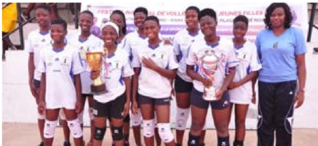
Centre d'Agoé Marché et Noameshie Nathalie

L'actualité sportive au Togo est marquée par le Festival de volley-ball des jeunes filles leaders, tenu le 14 janvier 2023 au stade omnisports de Lomé. Sur les cinq équipes en lice, celle du Centre d'Agoé Marché a remporté le trophée en battant en finale l'équipe de Dapaong (2 sets à 0).