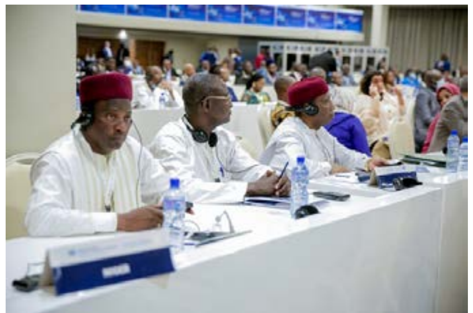
Vue partielle des participants