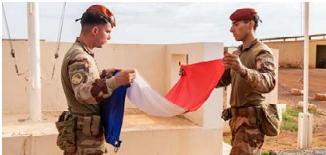
Des militaires français pliant un drapeau

L'information a fait le tour des réseaux sociaux depuis le weekend dernier sans qu'une source officielle puisse la confirmer. Elle fait suite à une nouvelle manifestation, vendredi 20 janvier 2023 de plusieurs centaines de milliers de Burkinabé dans les rues de Ouagadougou, pour réclamer une fois encore le départ de l'ambassadeur de France au Burkina Faso.