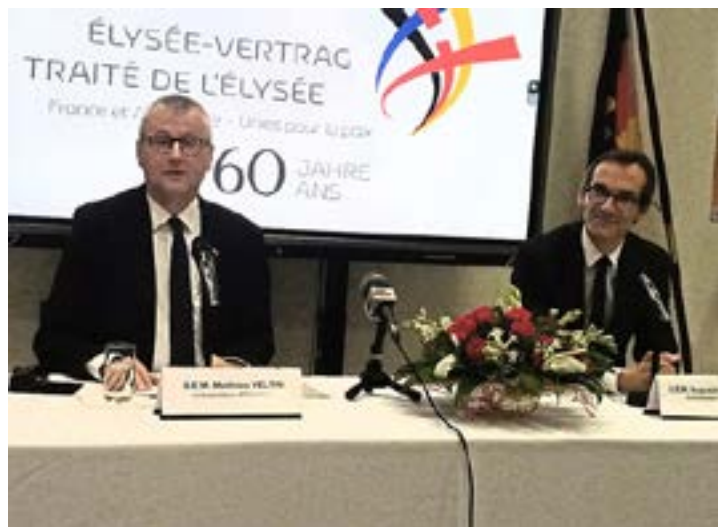
Les deux ambassadeurs

« L'Allemagne n'a pas d'autres relations plus étroites, plus élargies qu'avec la France. Même si nous sommes ensemble depuis 60 ans, cela ne veut