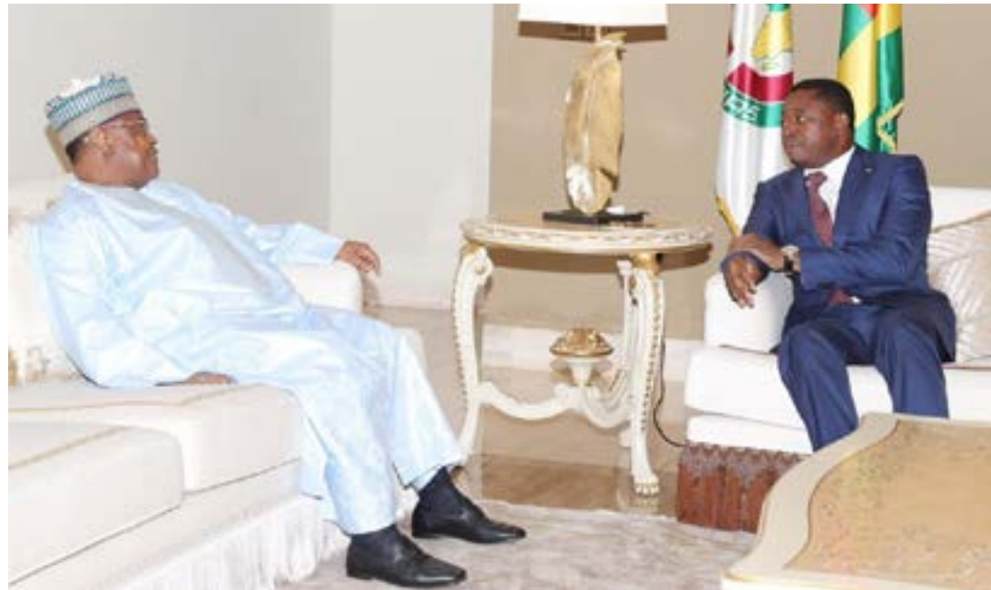
... avec président de l'Assemblée nationale du Niger, M. Seini Oumarou