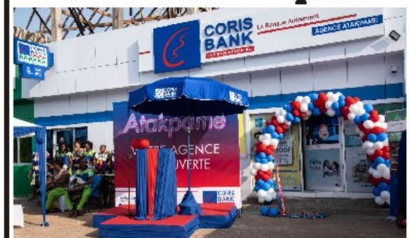
La nouvelle agence CBI-Togo d'Atakpamé