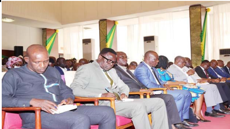
Une vue de l'assistance lors de la rencontre

Le 24 janvier 2023 dernier à Kara, le Président de la République, Faure Essozimna Gnassingbé a rencontré lors d'échanges les directeurs régionaux des services déconcentrés des régions Centrale, de la Kara et des Savanes. Moment de partages et d'écoute interactifs avec les acteurs impliqués à divers niveaux dans la mise en œuvre, l'évaluation et le suivi des projets prioritaires de la Feuille de route.