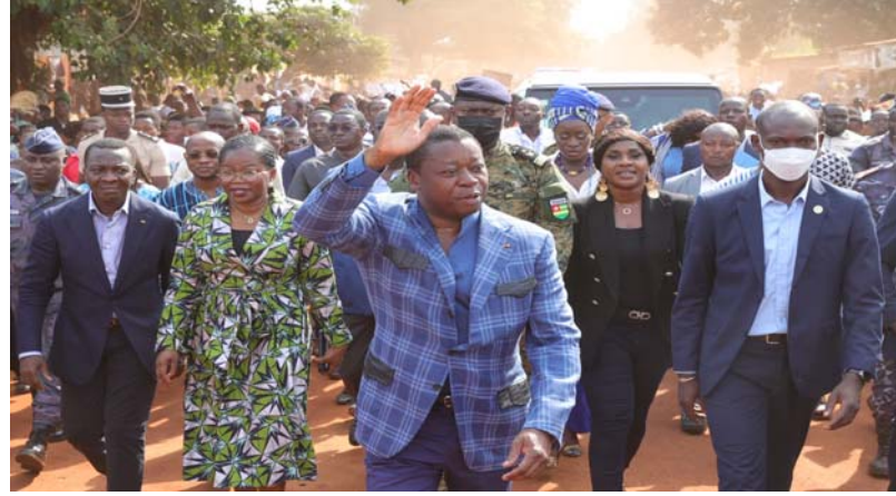
Le Président Faure Gnassingbé saluant les populations de Tsévié et de ses environs

Emboitant le pas au Président de la République, le ministre en charge du secteur a insisté sur la réflexion à mener pour rentabiliser les activités agricoles, afin que les productions ne servent pas seulement pour la