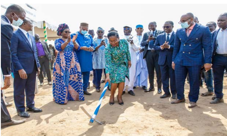
La PM Dogbé donnant le coup d'envoi des travaux

Long de 86 km, cette route permettra, à terme, une réduction du temps de parcours et du coût du transport, avec accès facile aux