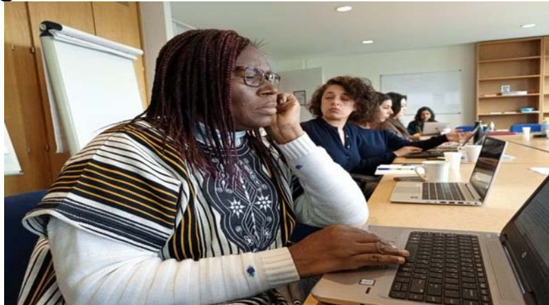
Une vue de l'assistance lors des travaux

La réunion note cependant qu'après une période de restriction de l'espace public, liée à la COVID 19 et la lutte antiterroriste, il y a, en ce moment, une accalmie dont on