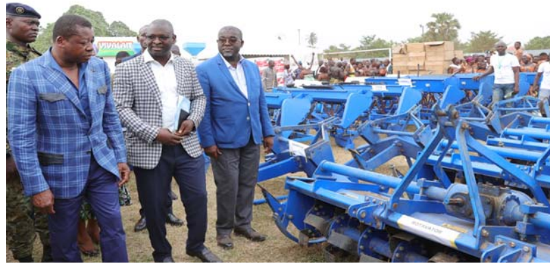
Faure Gnassingbé visitant les stands; ici le matériel agricole exposé.

région est propice à l'élevage des ovins, caprins et volailles, lapins, porcs, et la production halieutique avec la pêche maritime et continentale (poissons d'eau douce, de mer) et des étangs piscicoles. La région maritime est la zone de production maraichère par excellence et de manioc (34% de la production nationale.). Émaillée de divers plans d'eau à savoir le fleuve Zio, le Mono, le Haho, le lac Togo et les lagunes de Lomé et d'Aného, le potentiel des terres irrigables est estimé à 43 000 ha.