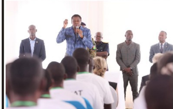
Faure Gnassingbé échangeant avec les acteurs agricoles à Tsévié.