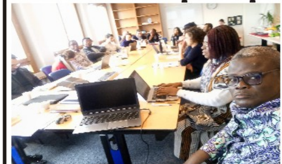
Une vue de l'assistance lors des travaux