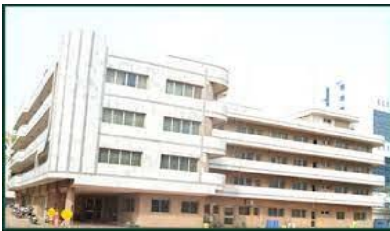
Le bâtiment abritant le siège de l'INSEED

Ainsi, le secteur des " Transports et entreposage "