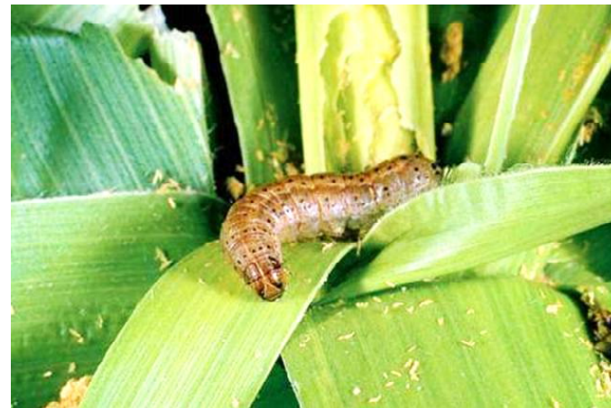
Une chenille légionnaire d'automne

Un document de la BAD rappelle les activités menées qui ont permis cette avancée : la dotation de la Direction de la protection des végétaux en 15 motos tout-terrain, 1 véhicule 4x4 et matériel informatique ; la formation de 40 techniciens formateurs, puis 168 techniciens sur la bio-écologie de la chenille légionnaire d'automne, les méthodes de lutte et l'utilisation de l'application relative au Système de surveillance et d'alerte rapide sur la légionnaire d'automne (FAMEWS) ; la distribution à 120 techniciens agricoles de smartphones équipés de l'application FAMEWS et formation aux diverses versions de l'application ; la mise en place d'une plateforme électronique de suivi instantané de la chenille légionnaire d'automne ; la formation et équipement de 200 brigades villageoises au traitement phytosanitaire ; l'installation de 100 pièges à phéromones dans 39 préfectures et formation de 90 techniciens agricoles de vulgarisation (dont 21 femmes) à l'installation et à la maintenance des pièges ; l'organisation de 80 champs-écoles de producteurs animés par 78 anima-