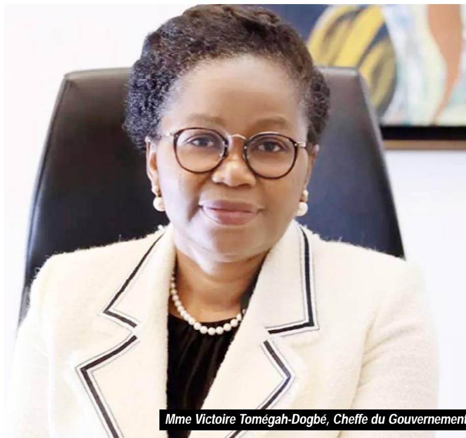
Mme Victoire Tomégah-Dogbé, Cheffe du Gouvernement