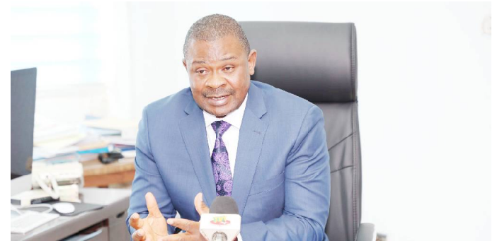
Koffi Tsolenyanou, Ministre de l'urbanisme, de l'habitat et de la réforme foncière

« Il est demandé aux maires d'exiger la présentation de cette autorisation préalable du ministre de l'urbanisme, de l'habitat, et de la réforme foncière avant toute opération de lotissement sur le ressort territorial afin de contribuer à l'éradication des