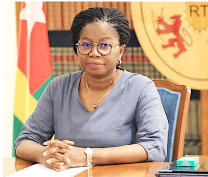
Mme Victoire S. Tomégah-Dogbé, Chef de Gouvernement

Passé la phase d'un PIP bien élaboré, il faut une mise en œuvre efficace et efficiente des investissements publics que nécessitent