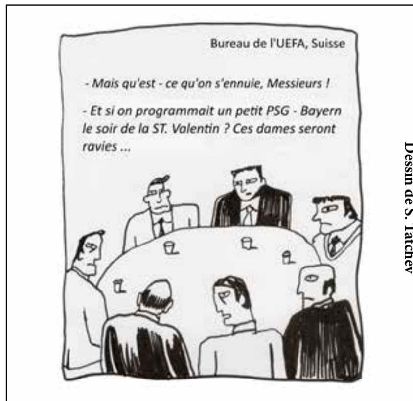
Dessin de S. Tatchev

Lancé en 2015 à l'occasion de la COP21 de Paris, le programme Readiness multipays est une initiative africaine qui s'inscrit dans le cadre de la mise en œuvre des projets d'adaptation et d'atténuation. Il couvre 23 pays africains, dont le Togo.