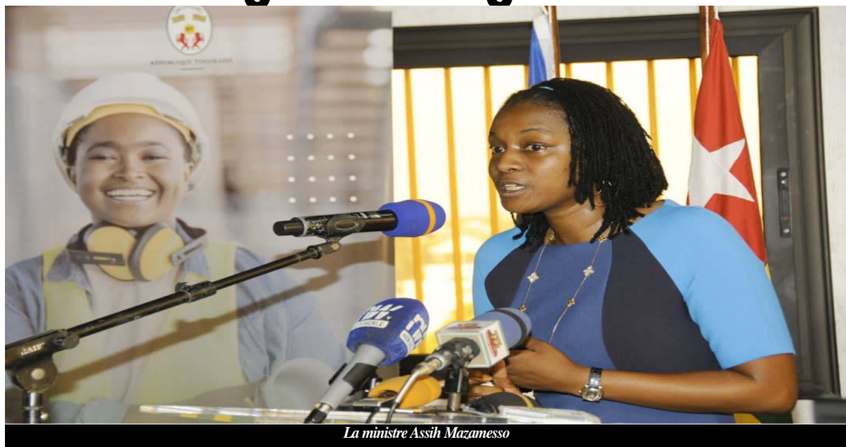
La ministre Assih Mazamesso

Pour Mazamesso Assih ministre chargé de l'inclusion financière et de l'organisation du secteur informel, l'appui se fera à travers des aides financières et techniques et le renforcement des organisations qui soutiennent les entrepreneurs. Selon la ministre, cette initiative s'inscrit dans une perspective de consolidation de tous les efforts consentis au niveau pays en matière d'accompagnement des entrepreneurs et des TPME.