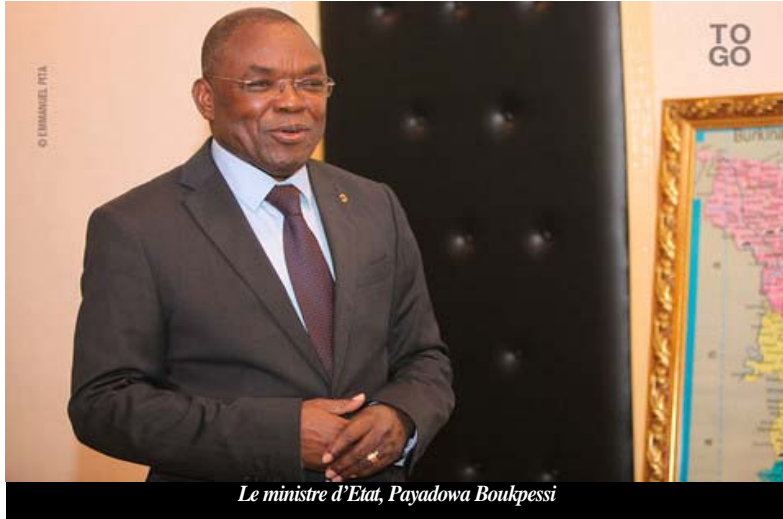
Le ministre d'Etat, Payadowa BoukpeSSI

Jadis sous le couvert des bailleurs et partenaires financiers dont il reste dépendant pour l'organisation des scrutins constitutionnels, le Président Faure Gnassingbé a su faire pren-