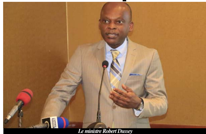
Le ministre Robert Dussey

entre autres. C'est dans le cadre de cette coopération que le Chef de la diplomatie togolaise le professeur Robert