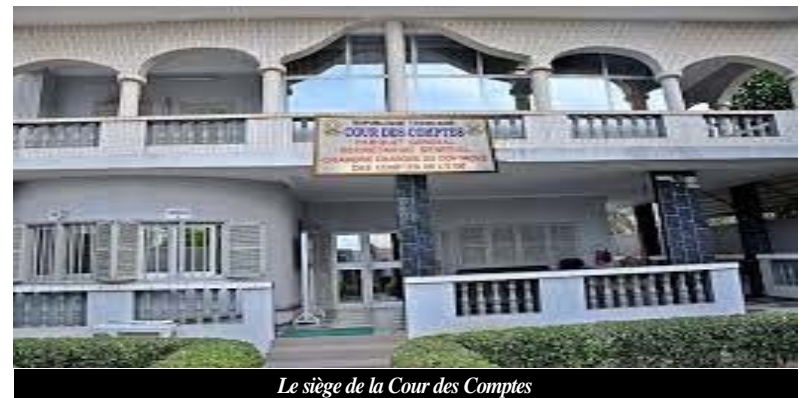
Le siège de la Cour des Comptes