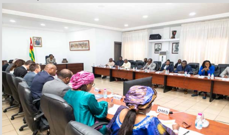
Une vue de l'assistance