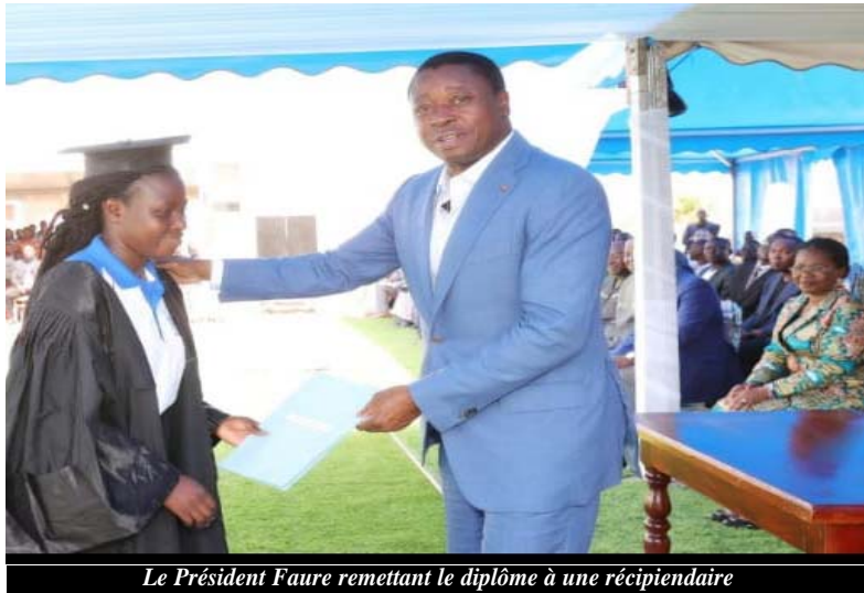
Le Président Faure remettant le diplôme à une récipiendaire

La cérémonie de remise de diplôme est la consécration de trois ans de formation sanction-