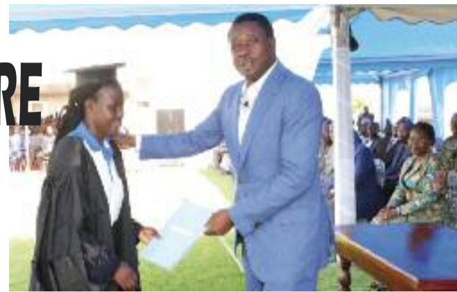
Faure remettant le diplôme à un étudiant de l'IFAD

FAURE HONORE LES PREMIERS DIPLOMÉS Page 2