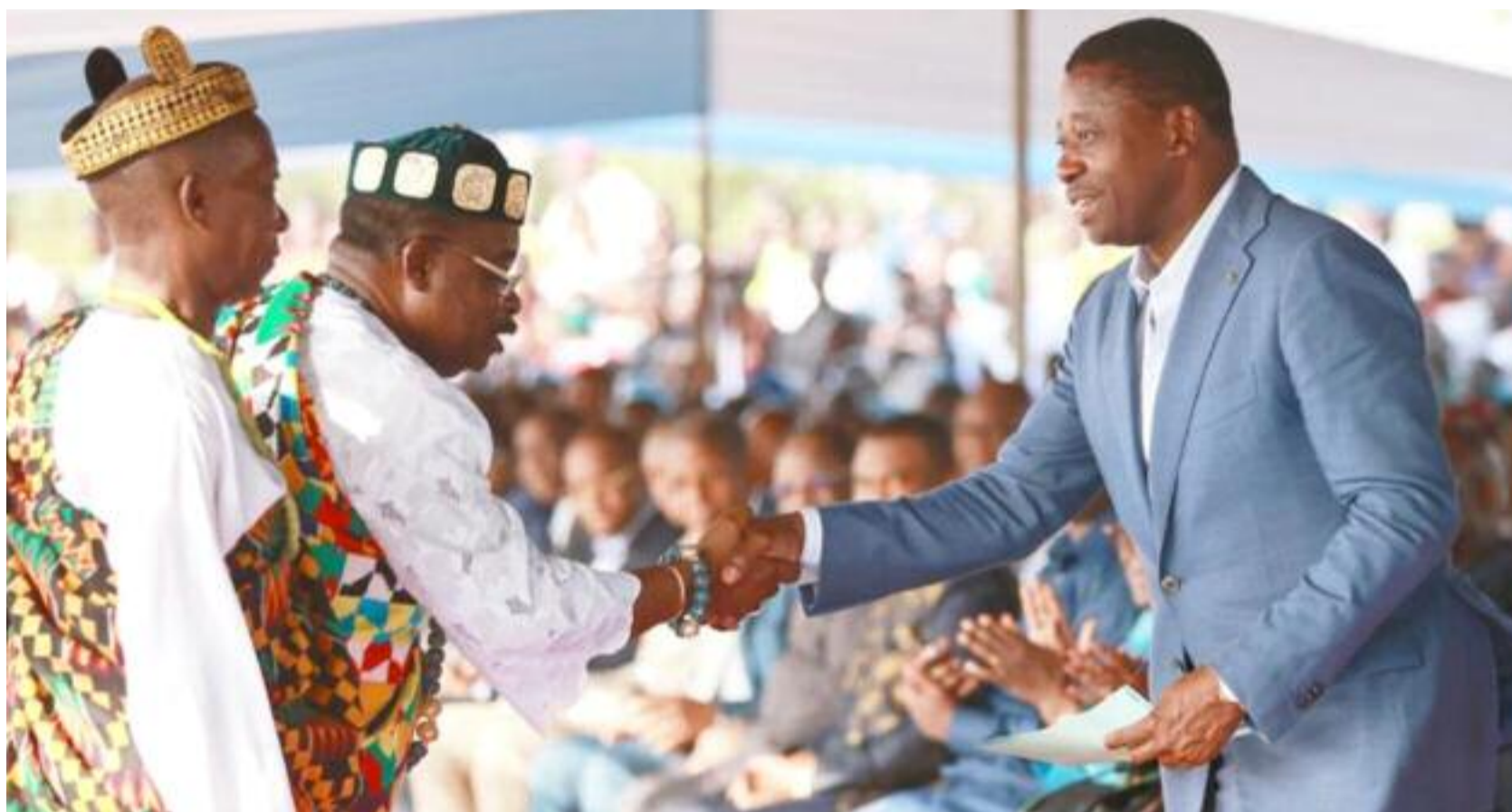
Faure Gnassingbé saluant les chefs traditionnels après leur entretien ( FoPAT région des Plateaux)

tion structurelle de l'agriculture togolaise, défis et les perspectives », de la région des plateaux dont le thème a été le même que celui de la maritime.