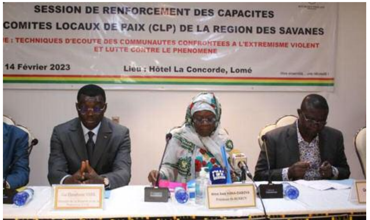
Table d'honneur à l'ouverture de l'atelier

« Nous tenons à remercier le HCRRUN et sa présidente pour l'initiative. Votre décision d'associer le ministère la sécu-