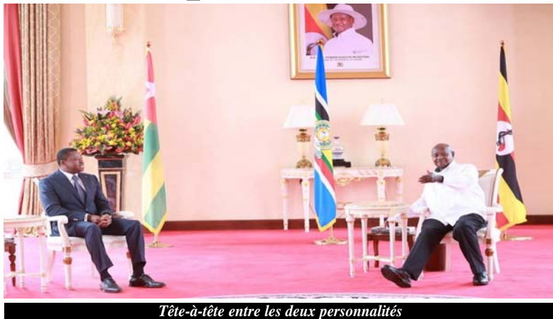
Tête-à-tête entre les deux personnalités

La visite officielle du Président de la république a été également une occasion de partages d'expériences dans ces différents domaines susmentionnés.