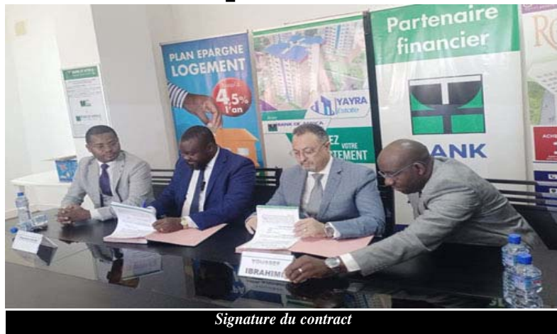
Signature du contract

Avec la concrétisation de ce partenariat, 2.500 appartements de hautes qualités répondant aux standards internationaux, seront