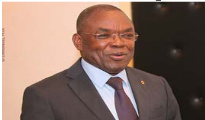
Le ministre d'Etat, Payadowa BoukpeSSI

Le Togo continue sa marche démocratique avec l'organisation des élections crédibles et voulues par tous en tenant compte des dispositions prévues par la constitution. Même si aucune date n'est encore retenue, cette année 2023, le Togo va une fois encore mettre en pratique les années d'expériences accumulées dans l'orga-