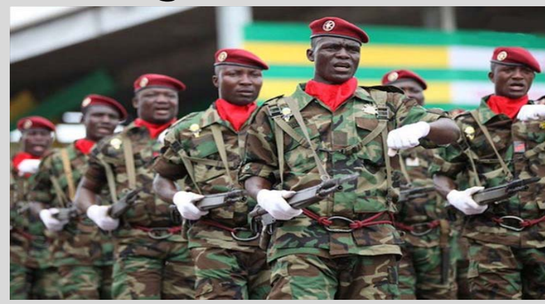
Des éléments des FAT

Outre la signature du Numéro 1 Togolais, ce décret concernant la nomination des magistrats militaires porte également la signature de Mme le Premier Ministre et celle du ministre de la justice. Selon le décret, le tribunal militaire