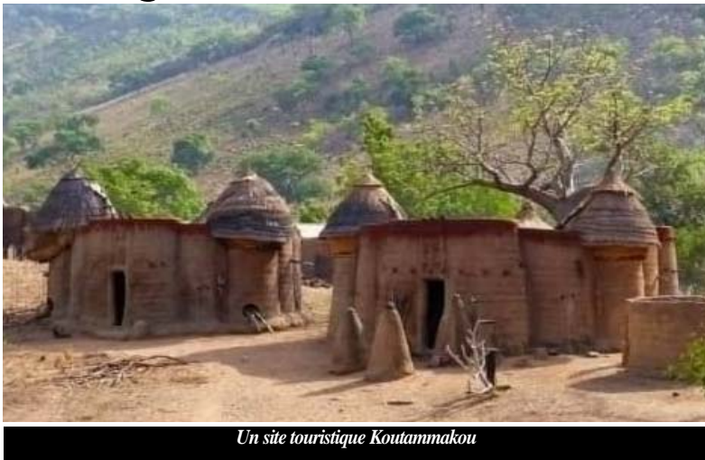
Un site touristique Koutammakou

vernement entend apporter un appui de diverses manières aux propriétaires pour la restauration de leurs " Sikien " .