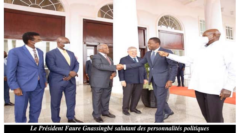
Le Président Faure Gnassingbé saluant des personnalités politiques

Faure Gnassingbé a remercié son homologue Ougandais d'être toujours disponible pour partager