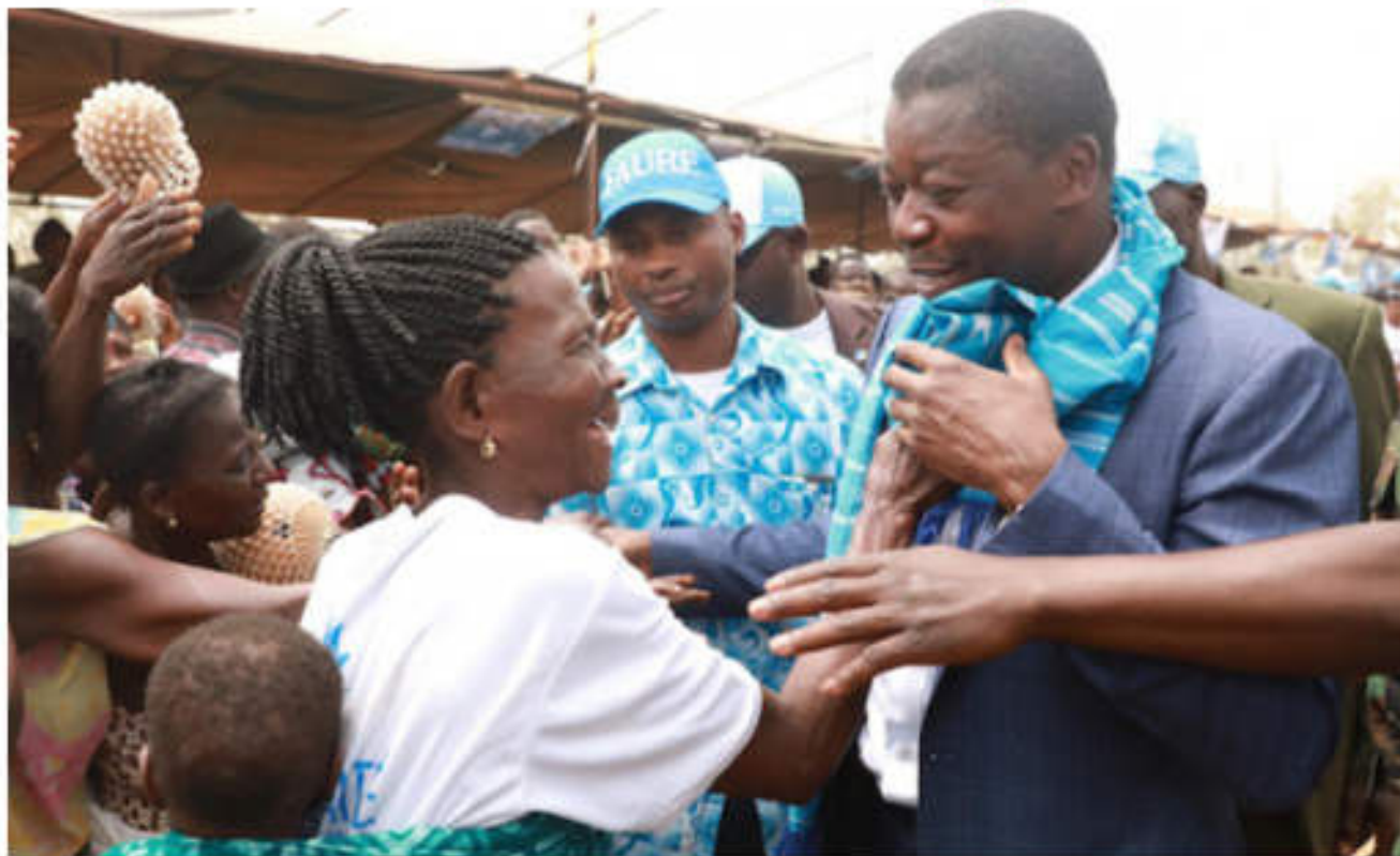
Le Chef de l'Etat Faure Gnassingbé, adulé par des femmes

Les élections législatives et régionales: