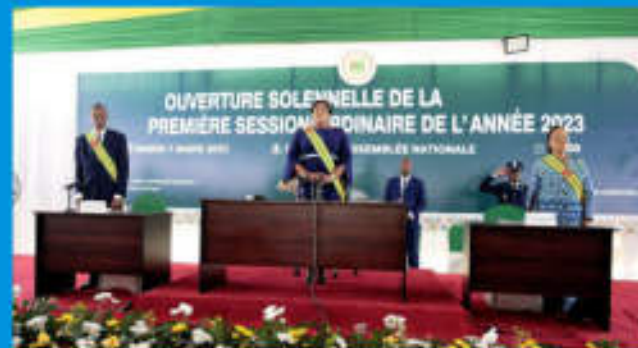
La Présidente entourée des vice-Présidents à l'ouverture de la rentrée parlementaire

4 mois avec 24 projets de loi sur la table