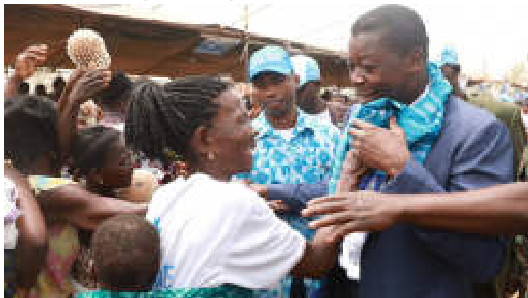
Le Chef de l'Etat Faure Gnassingbé ici adulé par des femmes

Le président Faure Gnassingbé, est connu de toutes les institutions internationales qui militent pour la promotion et autonomisation de la gente féminine, par son engagement à nommer des femmes à des postes de décision et à des portefeuilles très substantiels. A l'occasion de la célébration, du 8 Mars 2023, de la Journée internationale de la femme, le Président de la République renouveau sa détermination à accentuer sa politique de la promotion du genre, l'autonomisation de la femme et les droits de la petite fille. Dans un message qu'il a adressé à toutes les femmes togolaises pour leur souhaiter une bonne commémoration du 8 Mars, le chef de l'État a relevé l'importance de la femme dans le développement de notre société. Il rassure cette dernière surtout à compter sur sa détermination à construire une société togolaise égalitaire.