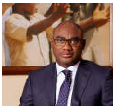
Prof. Dodzi Kokoroko, ministre de l'enseignement primaire et secondaire

Au total 1989 écoles primaires et secondaires sont en règles à l'issue de l'enquête et dont 459 dans le grand Lomé réparties comme suit : 116 à Lomé-Ouest, 64 au Grand Lomé-Ouest, 48 Lomé-Centre, 52 pour l'IEPP Lomé, 111 dans le Grand Lomé-Est et 68 dans la préfecture d'Agoè-