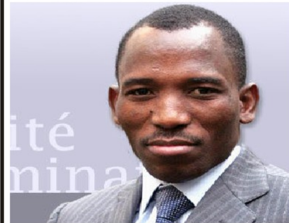
Le ministre Gilbert Bawara

HAUSSE DU SMIG : Bilan et discussion après les 1ers mois de mise en œuvre P.3