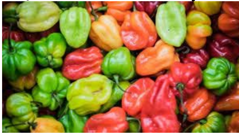
Plus forte baisse (-20,3%)

Celle de l'indice de la fonction " Restaurants et hôtels " est due à l'influence des services des " Restaurants, cafés et établissements similaires " (+0,2%).