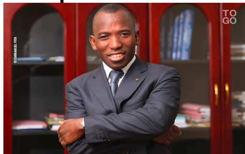
Le ministre Gilbert Bawara

Au nom de la volonté de dynamiser la création d'emplois en s'appuyant sur les forces de l'économie, le Togo tâche de se doter des moyens pour relever le défi d'une nation moderne, avec une croissance économique inclusive et durable. Quoi de plus réconfortant que l'augmentation du Salaire minimum interprofessionnel garanti (SMIG). Il est passé de 35 000 francs CFA à 52 500 francs CFA. Une hausse de 50%.