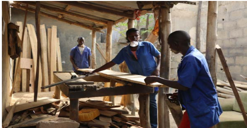
Une menuiserie installée grâce au projet

En 2013, le gouvernement a lancé le Programme d'appui au développement à la base (Pradeb). L'objectif est de réduire la pauvreté, améliorer les conditions de vie des populations vulnérables, créer des opportunités pour favoriser l'insertion des femmes et des jeunes dans la vie économique. En 10 ans, des résultats ont été engrangés.