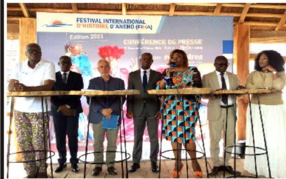
Les officiels lors de la conférence de presse

CULTURE : Le Brésil, pays invité d'honneur au FIHA 2023 P.2