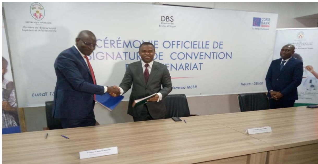
Echange de documents après la signature

Dénommé CORIS ACADEMIA, le produit que propose CBI TOGO au MESR est un compte courant particulier destiné aux étudiants inscrits dans les universités publiques (ou privées selon le cas) du Togo. Ce compte permet à l'étudiant de percevoir des allocations et bourses accordées par l'État ou par les organismes internationaux accrédités.