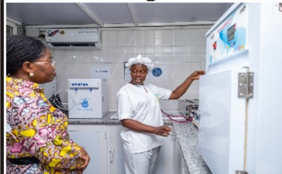
La PM Dogbé en visite guidée des installations

CRÉATION DE RICHESSE : L'installation des usines de transformation prend forme au Togo P.5