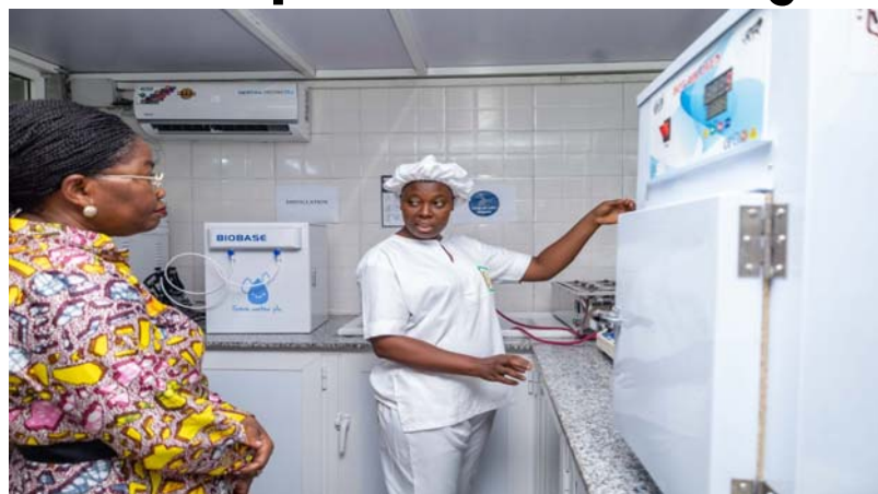
La PM Dogbé visitant les installations

Le Gouvernement fait savoir que la mise en activité de l'usine va être à l'origine de la création d'emplois massifs et la réduction du chômage. A son actif, l'usine compte déjà 268 employés et sera en collaboration avec 5 800 femmes, partenaires et collectrices des amandes des régions Centrale, Plateaux, Kara. L'infrastructure compte également expédier 2 000 tonnes d'amandes pour la première année. Ce projet vient également encourager les producteurs d'amandes de karité, qui pourront tirer profit de leurs activités agricoles. " La création de cette unité s'inscrit parfaitement dans la dynamique de création massive