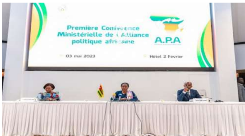
Les officiels lors de la cérémonie d'ouverture

L'idée d'une telle rencontre des ministres des affaires étrangères et des diplomates du continent africain est consécutive au discours de Robert Dussey, à la 77 e session de l'Assemblée générale des nations unies. Il disait : " L'Afrique actuelle n'est plus celle des années 1945, encore moins des années 1960... L'Afrique s'attend à plus d'égalité, de respect, d'équité et de justice dans ses relations et partenariats avec le reste du monde, avec les