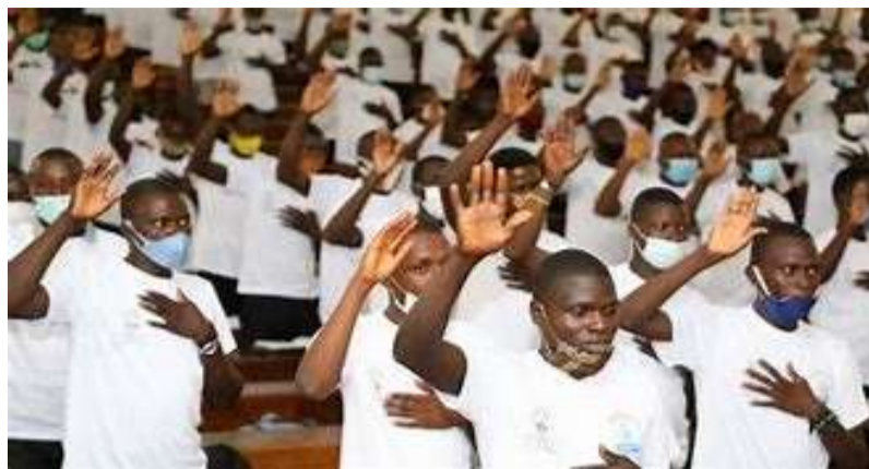
Une vue des volontaires nationaux

L'une des formes de volontariat développé au Togo est le volontariat national de compétences. Il est ouvert aux jeunes diplômés, sans