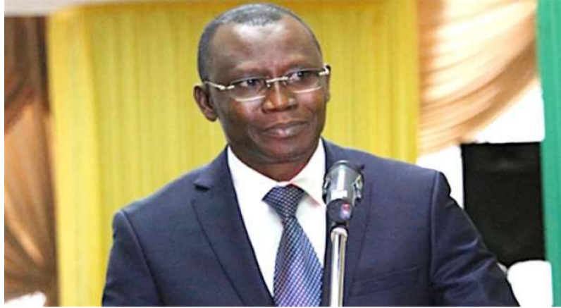
Sani Yaya, ministre de l'Economie et des finances

Selon le ministère de l'économie et des finances, les perspectives macroéconomiques pour la période 2022-2025 restent vulnérables à travers les risques potentiels qui pourraient ralentir la croissance économique du Togo. Ce sont : la crise sanitaire due à la