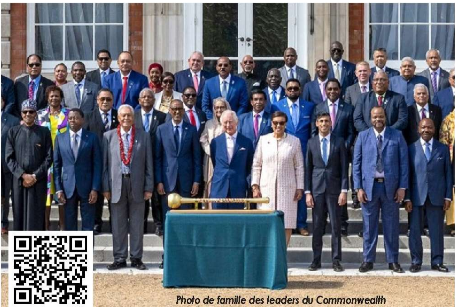
Photo de famille des leaders du Commonwealth