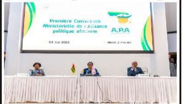
Les officiels à l'ouverture des travaux

EmploiTogo.com Des annonces, des offres d'emploi, une banque de Cvs, des formations. Journalemploi.com Tel 22 20 05 53