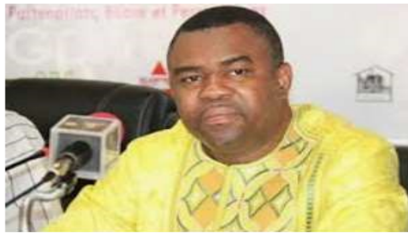
Prof Sa Majesté Ihou Watéba, ministre de l'Enseignement supérieur et de la recherche

Les faiblesses ci-après, en opposition avec le cahier des charges, ont été aussi relevées : admission des étudiants en Master sans soutenance de Licence, dont 4 de façon systématique, alors que la soutenance est un examen qui vaut 30 crédits ; absence de système de sécurisation des diplômes chez 6 établissements (code QR, code barre, cachet sec, papier personnalisé) ; absence ou insuffisance de remplissage des cahiers de textes ; incohérence entre le nombre d'heures indiquées dans le syllabus