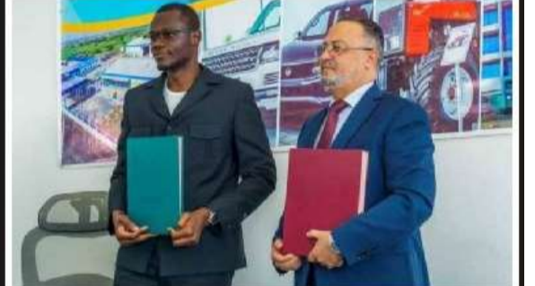
Le DG de BKG et le DG de BOA après la signature