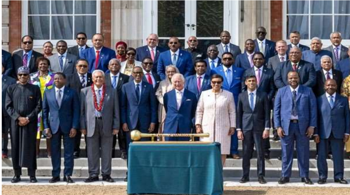
Photo de famille des leaders du Commonwealth

A en croire la Présidence togolaise, Faure Gnassingbé et ses pairs ont renouvelé leurs engagements à poursuivre les politiques de renforcement de la grande famille du Commonwealth, et à promouvoir l'unité, l'autonomisation des jeunes dans cet espace. Patricia Scotland KC, la Secrétaire générale du Commonwealth s'est félicitée de cette rencontre qui confirme la détermination des dirigeants des pays membres à promouvoir les potentialités de l'organisation inter-gouvernementale. Elle s'est réjouie de l'agrandissement du Commonwealth en compétences géographiques et en influence, avec l'adhésion du Togo intervenue à l'issue de la 26 e réunion des chefs d'Etat et de gouvernement de l'organisation, le 24 juin 2022.