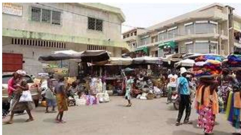
Le Grand Marché de Lomé

L'ambition de ce programme public d'investissement est de soutenir une croissance économique projetée à plus de 7%. Une raison essentielle pour favoriser les