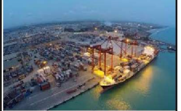
Le PAL, poumon de l'économie togolaise