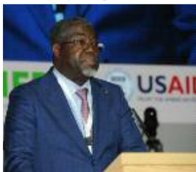
Antoine Lékpa Gbégbéni, ministre de l'Agriculture...

tion locale des engrais, infrastructures de distribution, et commerce intrarégional des engrais, celle relative à l'utilisation d'engrais et gestion durable des sols, les institutions et capacités humaines pour assurer une gestion durable des engrais et de la santé des sols seront entre autres sujets qui seront dé-