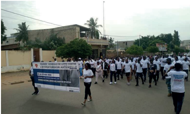
Le personnel lors de la marche dans les rues de Lomé

L'Office togolais des recettes (OTR) a organisé samedi 27 mai 2023 dans les rues de Lomé et en région, une marche sportive à l'intention de son personnel pour marquer la journée mondiale de lutte contre l'hypertension artérielle. La veille, s'est tenue une rencontre de sensibilisation sur les bonnes pratiques couplée jusqu'au 2 juin, d'une campagne de dépistage.