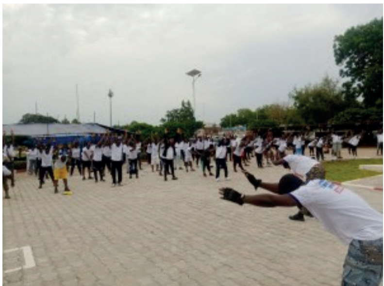
Sur place, les sportifs se sont rassemblés pour les exercices physiques qui leur ont permis de travailler les différentes parties du corps.