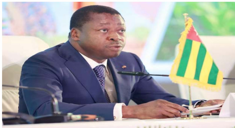
Le Président Faure Gnassingbé lors de la rencontre

Portée par la Commission de la CEDEAO, la Déclaration de Lomé relève que les Etats membres de la CEDEAO, de l'UEMOA et du CILSS s'engagent, avec le soutien de ses partenaires techniques et financiers et du Secteur Privé, à améliorer d'urgence l'accès aux engrais minéraux et organiques des petits producteurs et productrices agricoles, en mettant l'accent sur les cultures assurant la Sécurité et la Souveraineté Alimentaires des populations, notamment à travers des programmes d'interventions publiques ciblés (subventions intelligentes, appui budgétaire pour l'acquisition d'engrais, etc.). " Conscients de la nécessité et l'urgence d'agir individuellement et collectivement pour changer significativement les trajectoires des systèmes de production agroalimentaire en faveur d'une productivité agricole plus durable et résiliente, dont la santé des sols est la pierre angulaire, nous déclarons l'engrais, tant de source minérale qu'organique, produit stratégique sans frontières, libre de circuler sans entraves, dans l'espace CEDEAO, UEMOA et CILSS, conformément aux dispositifs réglementaires régionaux en vigueur ou à améliorer ; Déclarons la santé des sols comme un pilier critique de la sécurité alimentaire et d'un modèle agricole durable ; et par conséquent, les programmes de sa préservation/restauration doivent