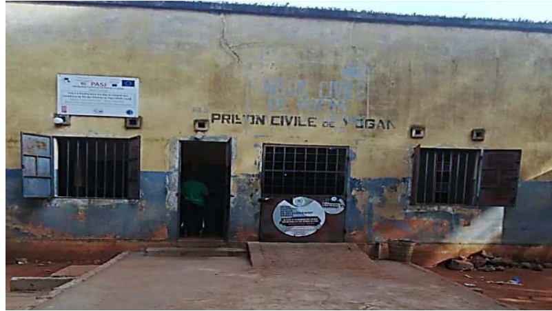
La prison civile de Vogan

disposent pas de structures répondant aux normes et standards internationaux en matière de détention, notamment les aires d'attente et de repos, les locaux médicaux, les salles uniquement dédiées aux interrogatoires. Dans toutes les unités visitées, les interrogatoires se font dans les bureaux des agents enquêteurs.