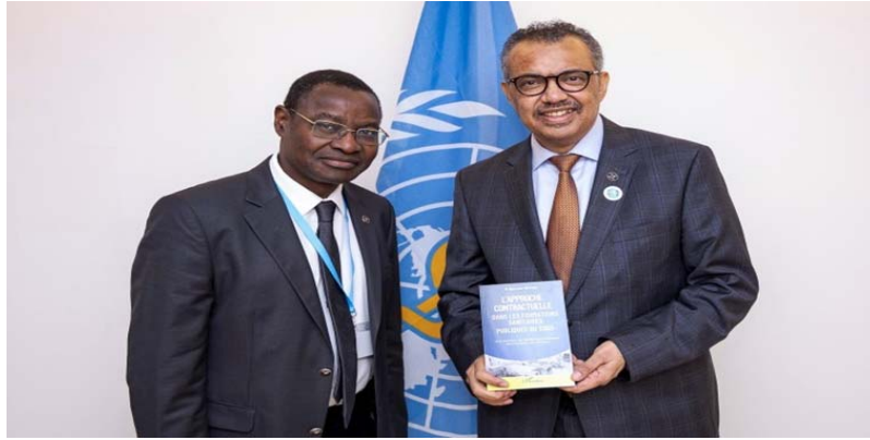
Le ministre Moustafa Mijiyawa(g) et le DG de l'OMS, Dr Tédros (dt)

En marge de ces travaux, Moustafa Mijiyawa a eu une séance de travail avec le DG de l'OMS, Dr Tédros. En l'occasion, il lui a remis un exemplaire de son chef d'œuvre la contractualisation " à la togolaise " bien appréciée par ses pairs. Le ministre togolais a aussi conversé avec