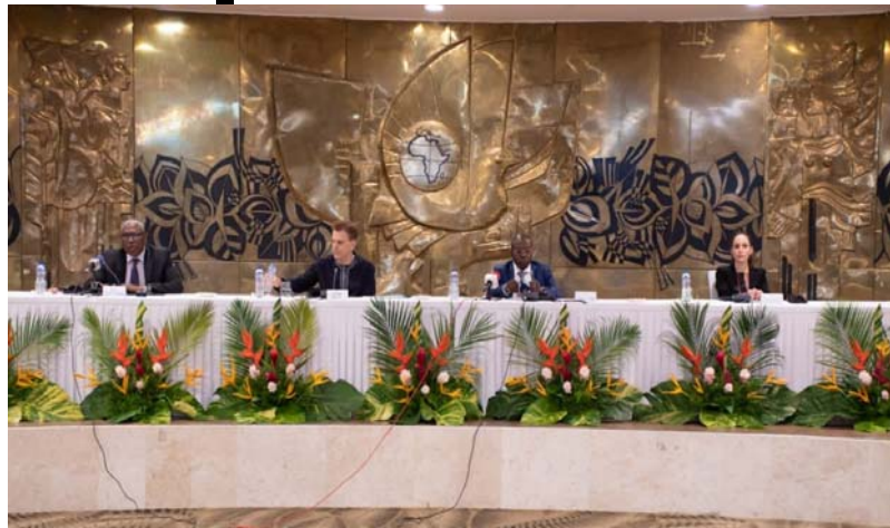
La table d'honneur

Porté par la CEDEAO avec l'appui technique et financier des partenaires dont la Banque mondiale, le Système Interconnecté de Gestion des Marchandises en