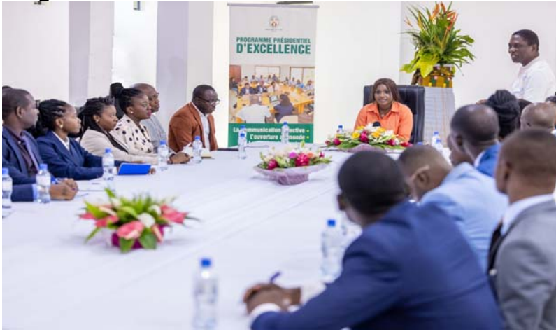
Une vue de l'assistance lors de la rencontre