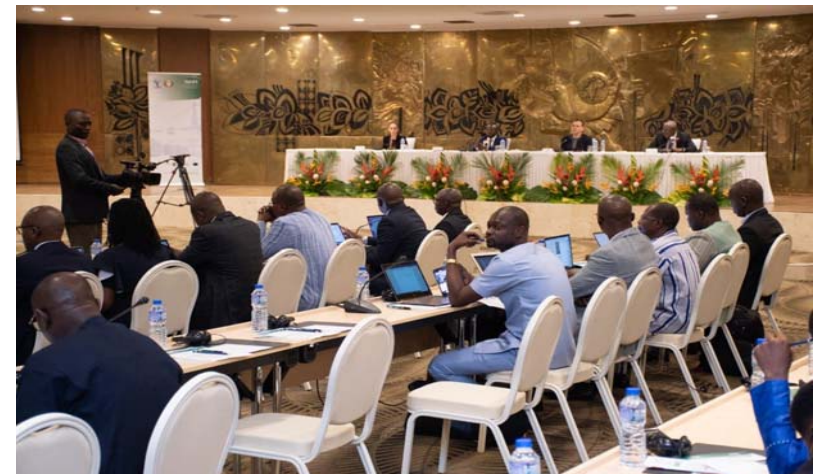
Une vue de l'assistance

" Avant qu'une cargaison ne quitte son pays d'origine, l'opérateur économique est tenu de faire une déclaration de transit auprès du bureau de douane de départ. Ce bureau attribue un numéro unique (MRN) de transit à la car-