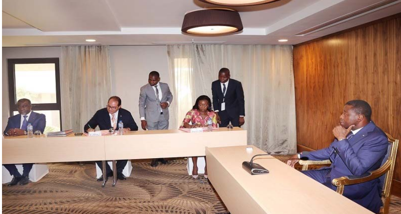
Une vue de la cérémonie de signature des deux accords

Le second accord, paraphé par la ministre déléguée en charge de l'énergie et des mines, porte sur le renforcement des capacités locales par l'OCP qui va apporter son expertise et son support technique pour le développement et la valorisation locale des phosphates de la mine de Hahotoé. Une étude de faisabilité