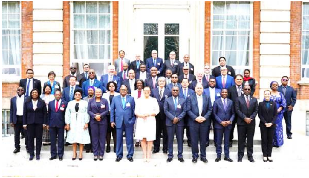
Le ministre Kodzo Adédzé (1 er rang, 3 e à partir de la droite) et ses homologues du Commonwealth

Les participants à la rencontre de Londres ont examiné le rapport des travaux des hauts fonctionnaires du commerce qui portait sur : les résultats de la 1 ère réunion des hauts fonctionnaires sur la coopération au sein du Commonwealth pour accroître la sécurité alimentaire ; le rôle du commerce dans l'agriculture et l'économie verte, la coopération sur l'économie numérique et la coopération multilatérale ; l'appui du Commonwealth au renforcement du système commercial multilatéral ; la politique commerciale internationale, la compé-