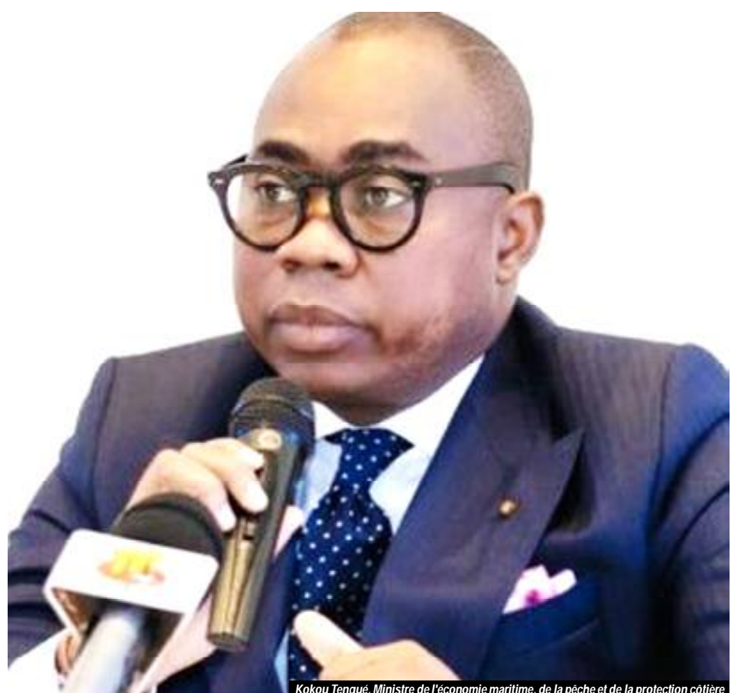
Kokou Tengué, Ministre de l'économie maritime, de la pêche et de la protection côtière