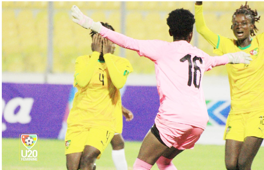
Togo et la Guinée Bissau.

La République Démocratique du Congo ira défier le voisin zambien. Demi-finaliste de la dernière édition du Mondial Féminin de cette catégorie d'âge, le Nigeria sera confronté au Burundi. Quant à leur représentant africain lors du tournoi en Inde, le Ghana affrontera le vainqueur du duel entre le