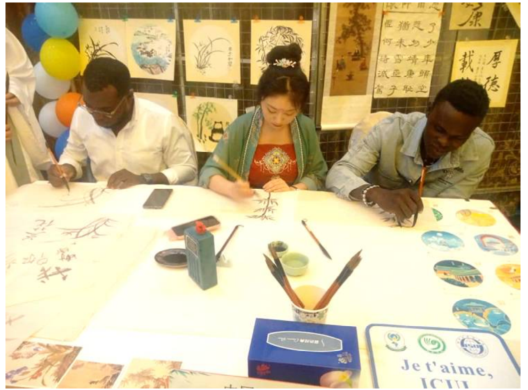
Une partie de calligraphie chinoise

culture chinoise, ne peut se passer de Kung-fu » a déclaré la maîtresse de cérémonie circonstancielle. Et oui, on a eu droit à une démonstration du Wu-shu, un art de combat (martial) chinois qui n'est autre que le Kung-fu modernisé. Et dites-vous, c'est un Togolais qui était