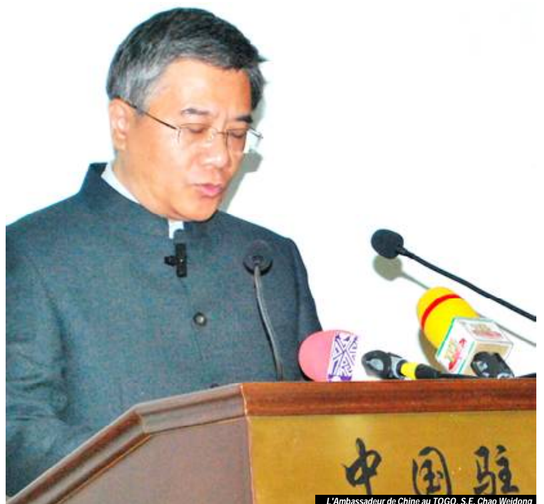
L'Ambassadeur de Chine au TOGO, S.E. Chao Weidong