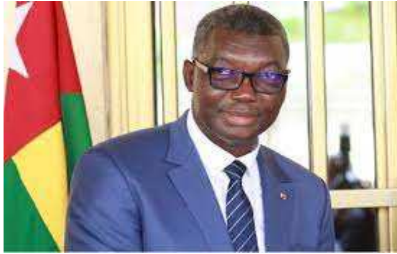
Le ministre Yark Daméhame

Dans la lutte contre ce phénomène, le ministre de la sécurité et de la protection civile, le Gal Yark Daméhame a insisté sur le fait que, "la détention, l'achat, la consommation, la culture des plantes et substances