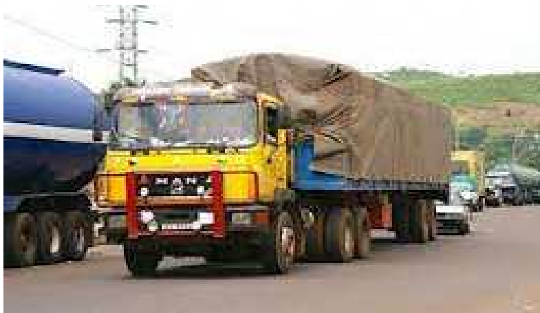
De gros porteurs

Des sanctions sont annoncées par le gouvernement à l'encontre des transporteurs ayant modifié les gabarits de leurs camions. Selon la note des autorités, ces transporteurs perfides ont jusqu'à fin juillet pour se conformer aux normes en vigueur. Cette mesure s'inscrit dans le cadre des textes liés au règlement 14 de l'UEMOA.