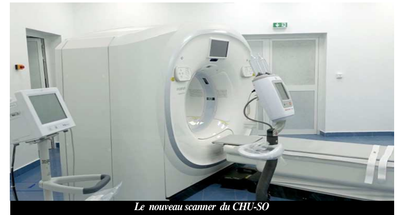
Le nouveau scanner du CHU-SO

tion est portée au secteur de la santé, donc à la construction/réhabilitation et à l'équipement des infrastructures sanitaires.