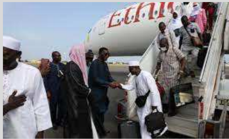
Le ministre Yark Damehame accueillant les pèlerins

La première vague des pèlerins Togolais qui étaient à la Mecque dans le cadre du HADJ 2023 sont de retour au pays. Ils ont été accueillis par le ministre de la Sécurité et de la Protection civile, Gal Damehame Yark mardi dernier à l'Aéroport Gnassingbé Eyadema de Lomé. Ils sont au total 341 pèlerins à être reçus par les autorités du pays. Après un mois d'intenses prières et d'invocations adressées à Allah le Miséricordieux, sur les lieux saints en Arabie Saoudite, les pèlerins sont rentrés au pays.