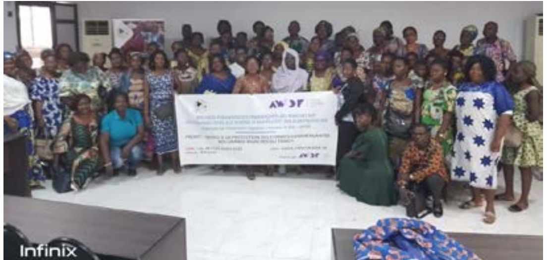
Photo de famille lors de la rencontre