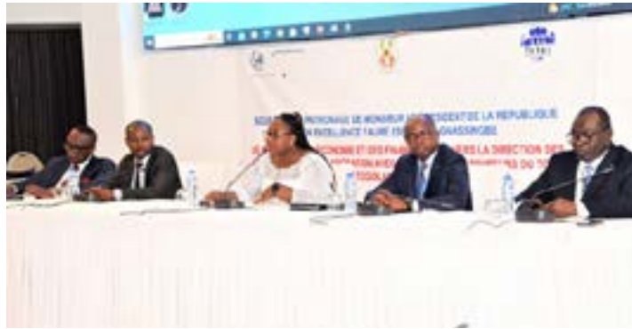
Etats généraux sur l'assurance automobile à Lomé

Malgré ces avancées, des difficultés en termes de mise en œuvre de la réglementation en vigueur dans le secteur persistent. « Il s'agit, entre autres, du non-respect de la réglementation relative à l'obligation d'assurance