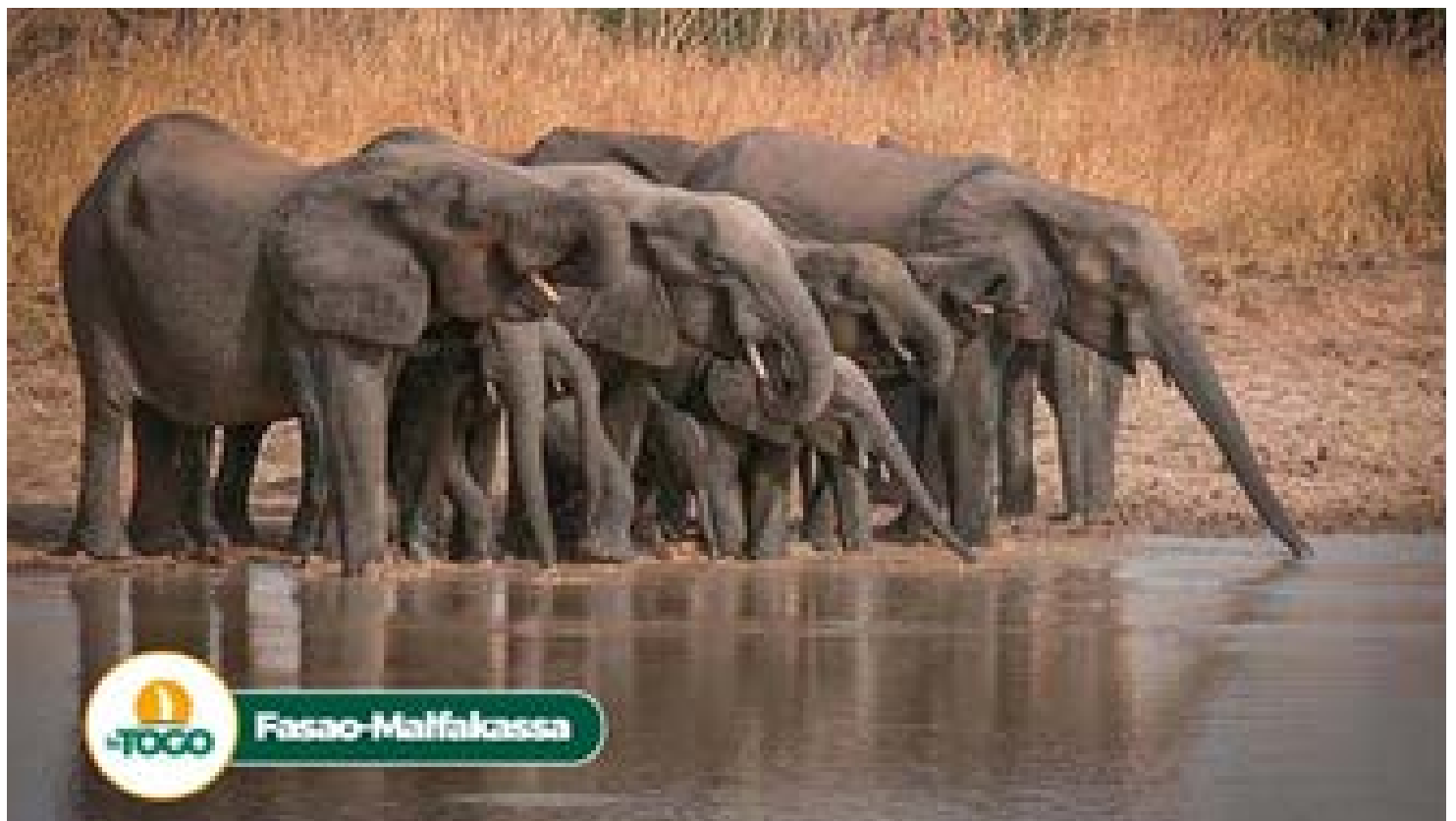
Des éléphants du parc national de Fazao-Malfakassa

fosse sacrée de Doung au fond de laquelle coule une rivière poissonneuse abritant des crocodiles, le tout entouré d'une galerie forestière au micro-climat favorable au pique-nique et à la détente. On peut y également visiter" la fosse sacrée de Tanlona "