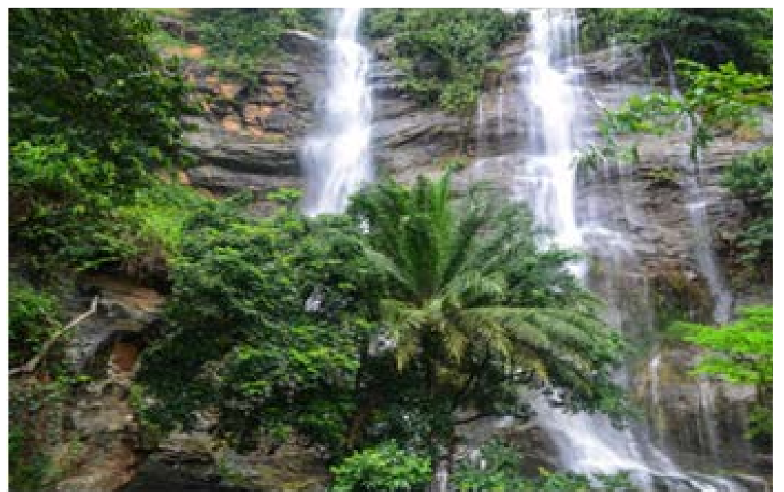
L'une des cascade de Kpalimé

C'est la région des pics, des chutes et des cascades. Kpalimé et ses environs. Le pic d'Agou: Altitude 986 mètres, point culminant du Togo. Dans la vallée se développent l'élevage industriel d'Avétonou et la station agro-industrielle de Tové. Les forêts classées de Missahohoe, d'Atilakoutsé et de Kpimé. Le château présidentiel et des grottes aux chauves-souris de Kevuvu. Le plateau de Danyi et ses forêts de wawas