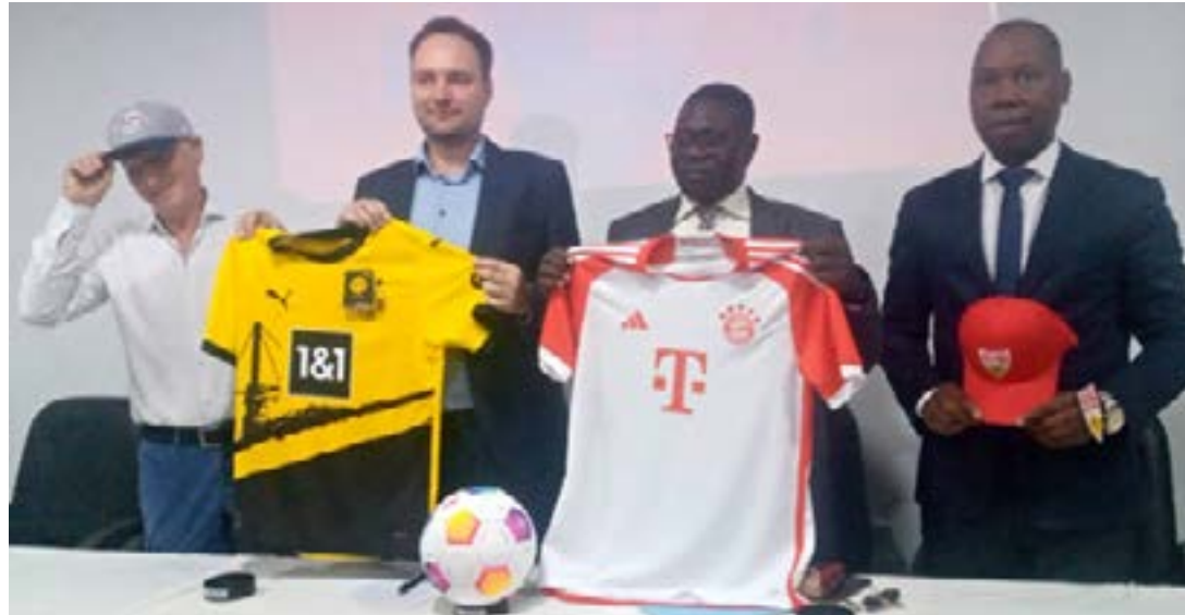
Présentation du partenariat à Lomé

Outre la Supercoupe, New World TV détient les droits non exclusifs de diffusion payante de Bundesliga (1ère division) et Bundesliga 2 (deuxième division) dans les langues locales pour 22 pays d'Afrique subsaharienne francophone. Elle diffusera également les matchs de barrage de Bundesliga qui ont lieu à la fin de chaque saison. D'après le directeur du droit audiovisuel de la Bundesliga, Henning Brinkmann, « Nous sommes fiers d'ajouter New World à notre partenariat avec les pays d'Afrique