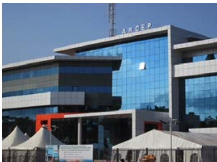
Siège de l'Arcep à Lomé

En 2022, l'Autorité de régulation des communications électroniques et des postes (Arcep) a vu sa contribution au budget de l'Etat augmenter. De 3,94 milliards FCFA en 2021, son apport passe à 4 milliards en 2022, ce qui est dû essentiellement aux pénalités financières infligées à des sociétés de télécommunications.