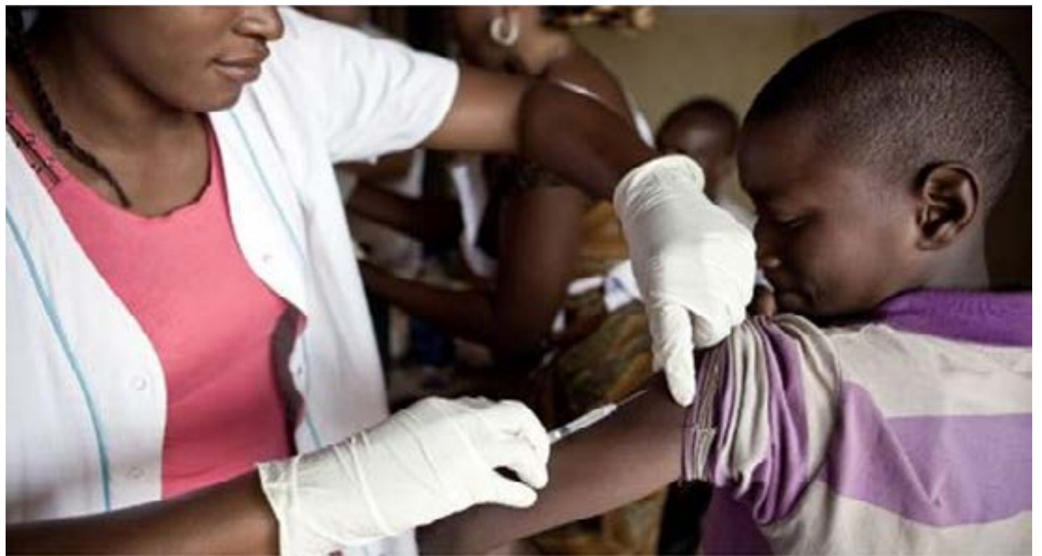
Une séance de vaccination

accroître l'offre, nous devons nous assurer que les doses dont nous disposons sont utilisées aussi efficacement que possible, c'est-à-dire appliquer tous les enseignements tirés de