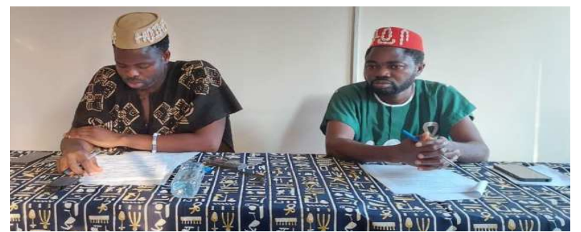
La table d'honneur

Selon l'organisation, pour que les Africains retrouvent leurs valeurs d'antan, il est essentiel qu'ils renouent avec les traditions ancestrales. Ainsi, une lutte contre la suprématie blanche s'avère nécessaire pour y parvenir. " Cette Renaissance va nous aider à retrouver tout ce qu'on a perdu sur le plan économique, culturel et de l'estime de soi afin de remonter dans le concert des nations ", a souligné