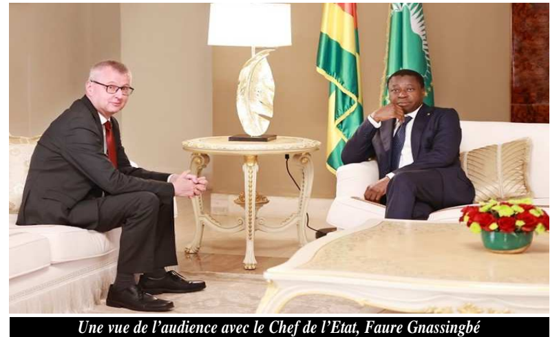
Une vue de l'audience avec le Chef de l'Etat, Faure Gnassingbé

quitte le Togo, mais à l'issue de son audience chez le numéro togolais, il n'a pas manqué de rassurer l'opinion de la continuité de la coopération entre le Togo et l'Allemagne, surtout dans un contexte sécuritaire sensible, marqué par les menaces terroristes récurrentes.