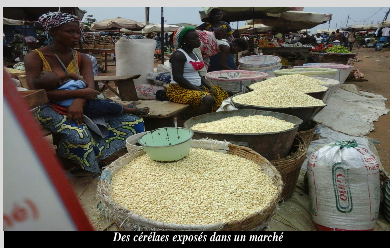
Des céréales exposées dans un marché

Le plan septennal de sécurité alimentaire du Togo sur la période 2024-2030 a été validé le mercredi 19 juillet 2023 à Lomé. Il est axé sur les grandes priorités de la transformation structurelle des systèmes alimentaires au Togo, conformément à l'ambition des autorités déclinée dans la feuille de route gouvernementale 2020-2025.