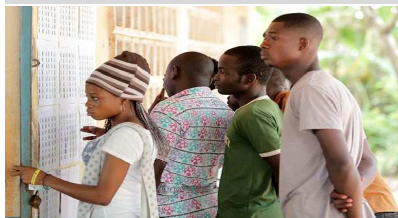
Des listes affichées dans les CRV

Après la phase d'enrôlement du recensement électoral, le traitement des données s'est poursuivi et a abouti à l'affichage de listes électorales provisoires dans les centres de recensement et de vote hier jeudi 20 juillet.