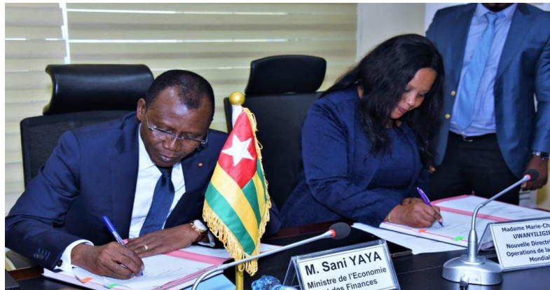
Une vue de la signature de l'accord

(...) Madame la Directrice des opérations, je voudrais avant tout propos, je voudrais vous souhaiter la cordiale bienvenue ici au Togo, chez vous. Je vous invite à vous sentir ici comme chez vous. Nous sommes une terre d'hospitalité, d'accueil et de fraternité. Vous allez le sentir très rapidement et vos collaborateurs qui sont ici, vous en parleront. Je voudrais ensuite vous féliciter pour votre nomination à ce poste de Directrice des opérations pour le Togo, le Bénin, la Côte d'Ivoire et la Guinée. C'est un poste très prestigieux. Je voudrais vous souhaiter plein succès dans votre mission. Je voudrais ensuite me réjouir de l'excellence de la qualité des relations entre la Banque Mondiale et notre pays le Togo et cette relation a été portée par l'équipe de la Banque Mondiale au Togo avec à sa tête la Directrice des opérations. Il y en a une qui est entrée, il y en a une qui est partie.