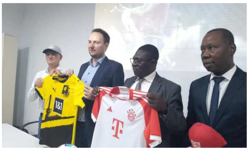
Une vue des officiels

Après la diffusion avec succès de la Coupe du Monde 2022, New World TV ne compte pas s'arrêter en si bon chemin. Cette fois ci, la chaîne de télévision panafricaine basée à Lomé vient d'acquérir les droits de diffusion en direct de la Bundesliga. La bonne nouvelle a été annoncée ce mercredi 19 juillet 2023 à travers une conférence de presse animée par les responsables de la chaîne.