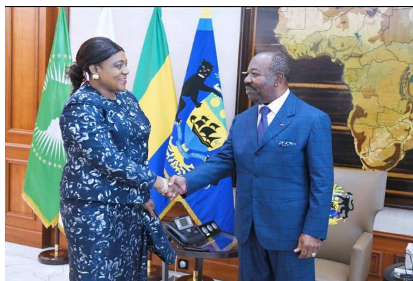
La PA Tségan (g)...

Ce voyage des cadres UNIR au Gabon, s'il est parfaitement apprécié par les partisans de Faure Gnassingbé, est en revanche