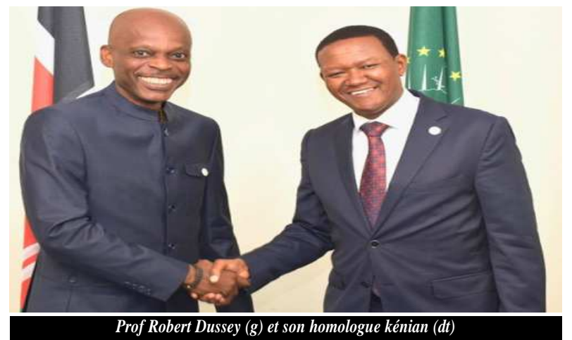
Prof Robert Dussey (g) et son homologue kényan (dt)

depuis les États-Unis. L'objectif est de fournir des données satellitaires précises et régulières pour ce pays touché par une sécheresse historique. Les informations serviront, entre autres, dans les domaines de l'agriculture et de la sécurité alimentaire, de la gestion des ressources