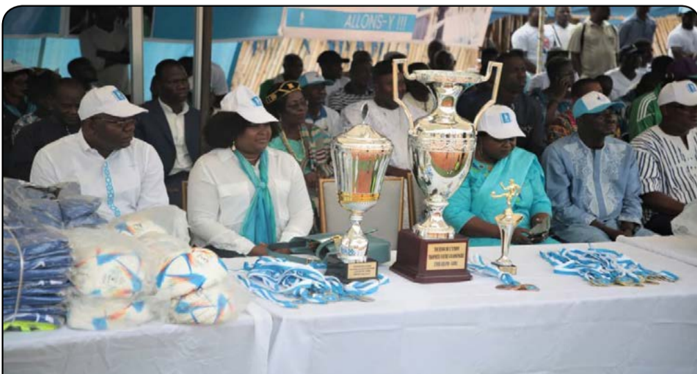
Dans le Grand-Lomé, le parti UNIR sème les graines de l'union et la cohésion sociale à travers le foot