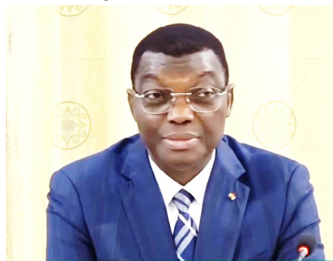
Gal. Damehane Yark, Ministre de la Sécurité et de la protection civile

Et pourtant, les activités préventives sont menées par la division de la sécurité routière, notamment la sensibilisation des usagers de la route sur le code de la route, les causes des accidents de la circulation, la nécessité et la procédure d'obtention du permis de conduire catégorie A. « Ces sensibilisations sont faites dans les églises, les mosquées, les établissements scolaires, les marchés et dans les sociétés publiques et parapubliques », lit-on dans le rapport de la Police. Le ministre de la sécurité a donc exhorté tous les usagers de la route particulièrement ceux d'engins à deux roues à la prudence sur les routes et à se faire former sur le code de la route pour l'obtention du permis de conduite catégorie A. Il a félicité les populations pour