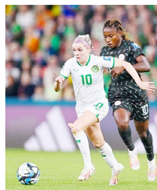
1999, où elles avaient atteint les quarts de finale.

Les Super Falcons a réussi à mettre fin à un conflit salarial et à se qualifier pour la troisième fois de son histoire pour la phase à élimination directe. Les Nigériennes, qui s'étaient déjà qualifiées pour la phase finale de l'édition 2019 en France, peuvent maintenant espérer faire aussi bien qu'à la Coupe du monde