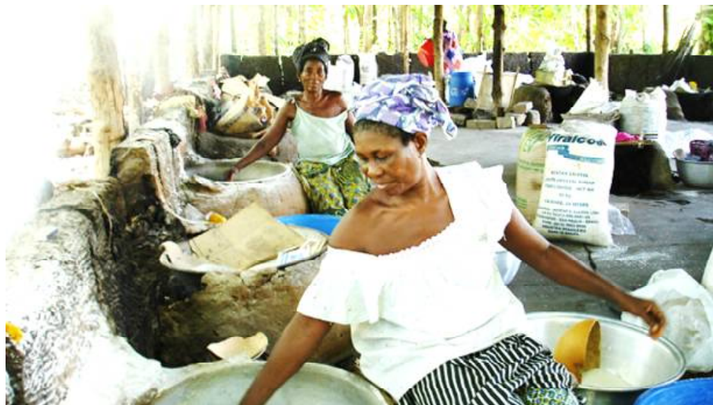
Des vies de femmes transformées grâce à un éco-village

Les auteurs du rapport parlent alors de leçons apprises. Ils affirment que la mobilisation de ressources internes de l'Etat togolais a permis d'autofinancer certaines activités qui étaient entièrement financées, par le passé, sur les ressources du PNUD. Comme l'acquisition d'un véhicule pour la coordination qui a réduit les demandes de financement de location de voiture pour les missions de la coordination, le financement à plus de 60% des activités de reboisement par l'Etat qui a contribué à