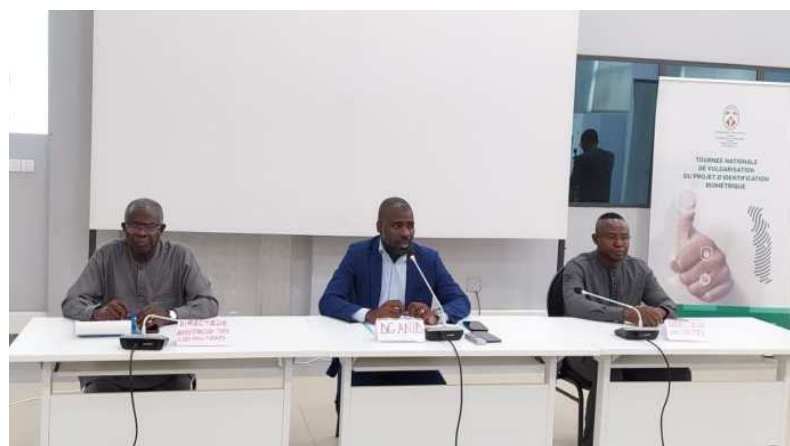
LA table d'honneur. Au milieu, le DG de l'ANID

Au cœur de tous les secteurs d'activités, le numérique est adopté par le gouvernement togolais comme un outil régulier pour surmonter les défis de l'inclusion financière et de la sécurité sociale. Cet engagement à une réelle dynamique de transformation numérique se manifeste aussi à travers le projet d'identification nationale biométrique (e-ID Togo) visant à attribuer à toute personne physique de nationalité togolaise ou résident au Togo un numéro d'identification numérique (NIU).