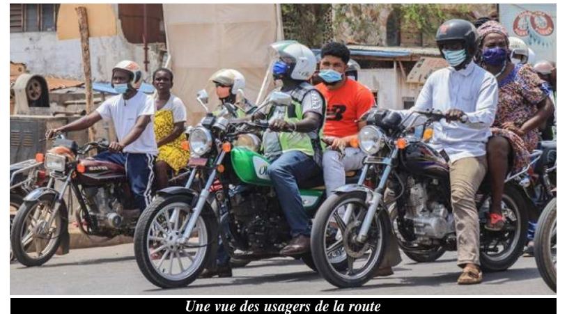
Une vue des usagers de la route

cles. Dans la foulée de cette mesure, nombreux sont les citoyens qui se sont conformés aux normes. Cependant, il existe des poches de résistance et certains qui ont la volonté de s'y conformer mais se butent aux spéculations des prix de casques sur