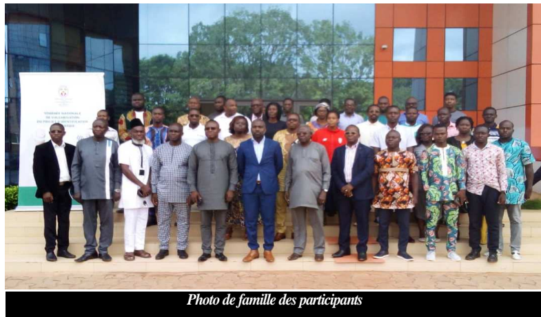
Photo de famille des participants

Au Togo, l'Agence Nationale de l'Identification (ANID) a récemment tenu une réunion cruciale avec les médias pour discuter du Programme d'Identification Unique, de l'Intégration Régionale et de l'Inclusion en Afrique de l'Ouest (WURI), phase 2, dans le District Autonome du Grand Lomé (DAGL). Cette rencontre visait à sensibiliser les organes de presse sur ce projet ambitieux et à les inciter à le relayer à travers tout le pays. Les discussions ont couvert divers aspects, de la présentation du Projet WURI-Togo aux journalistes, jusqu'à la législation sur la protection des données personnelles, l'identification biométrique et le mécanisme de gestion des plaintes. Le Projet WURI-Togo occupe