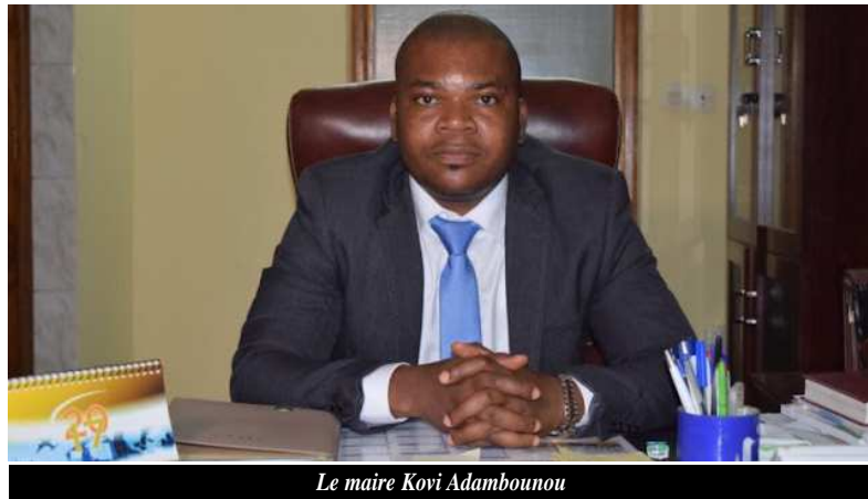
Le maire Kovi Adambounou

Nombreuses sont les communes de la capitale qui font face aux inondations en ces périodes de pluie. La commune d'Agoè-Nyivé 1, n'est pas à l'abri de ces sinistres. Face aux menaces d'inondations en cette saison pluvieuse, la municipalité a entrepris des travaux de voirie et d'aménagement dans les zones à risques. Cette initiative intervient au regard des prévisions pluviométriques et risque d'inondation annoncés par l'Agence Nationale de la Météorologie au Togo.