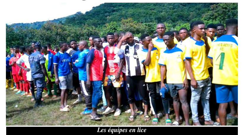
Les équipes en lice

togolaise Faure Gnassingbé est aujourd'hui un chantre de la paix, un ambassadeur du vivre-ensemble, un champion de la cohésion sociale. Même au-delà des frontières, le Président Faure Gnassingbé est admiré et donc c'est le moment de lui rendre cet hommage mérité. "Le Chef de l'État s'est assigné une noble mission, de promouvoir les valeurs de notre grand parti telles que la paix, la cohésion sociale et la sécurité partout dans le monde entier, cette vision est reconnue dans le monde entier, et il est important que nous partagions cette vision avec notre base, nos populations, nos frères et sœurs. Aujourd'hui tout le monde entier sait que le président Faure Gnassingbé, notre champion est le chantre de