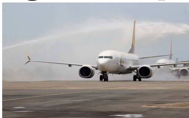
Un des deux Boeing 737 MAX de ASKY

La réception de ces deux avions a permis à la compagnie d'élargir sa flotte, qui compte désormais 15 avions de types Boeing 737 de nou-