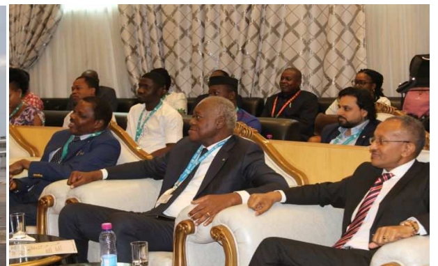
Une vue de l'assistance

velles générations et B737-MAX dans sa flotte, et opère sur 27 lignes à destination de 25 pays sur le continent africain. Le 737 MAX est un avion de la 4ème génération des Boeing 737. Il se différencie princi-