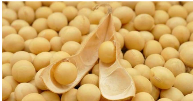
Le soja togolais

Aussi plusieurs mécanismes d'accompagnement de l'Etat, notamment le PAEIJ-SP et le MIFA ont-ils incité les banques commerciales et les