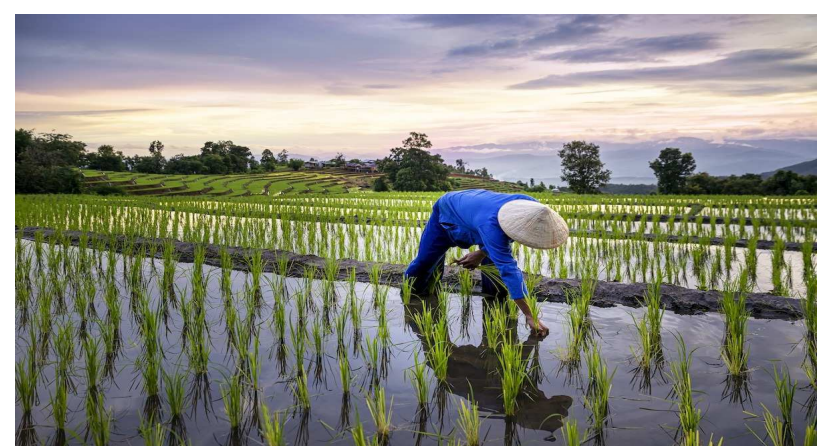
Un champs rizicole

Les 4 innovations agricoles axées sur les synergies positives entre l'agriculture, le climat, l'eau, l'énergie et la biodiversité doivent porter sur les axes d'intervention suivants : le développement des systèmes de maîtrise de l'eau en agriculture en valorisant les res-