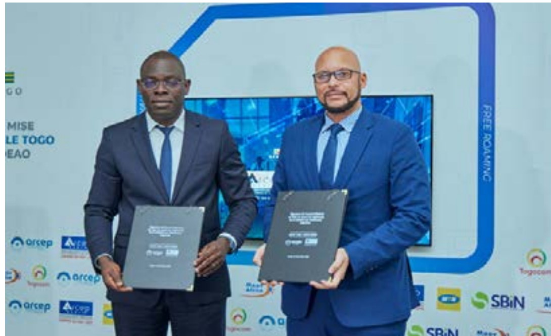
Signature d'un protocole d'accord de baisse des tarifs Roaming entre le Bénin et le Togo

jusqu'à 15 fois moins cher. L'effectivité de cet accord va donc se traduire par une baisse significative des tarifs pour les services