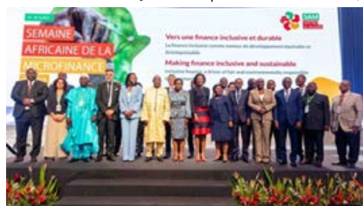
Lancement officiel de la Semaine africaine de la microfinance, ce 17 octobre à Lomé

échangé avec le ministre de l'Inclusion financière sur l'importance de la finance inclusive à atteindre les Objectifs de développement durable. Dans un autre registre,