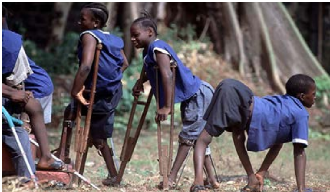
Les conséquences de la poliomyélite

« L'éradication de la poliomyélite est à portée de main, mais les progrès sont fragiles et nous devons rester entièrement concentrés sur notre objectif », a déclaré Catherine Russell, directrice exécutive de l'Unicef. « Ce nouveau financement contribuera à faire en sorte que tous les enfants soient vaccinés afin d'éradiquer la poliomyélite, tout en renforçant les systèmes de santé de proximité. Aucun enfant ne devrait souffrir d'une maladie facilement évitable », a-t-elle précisé. Plus précisément, le partenariat de financement devrait inclure une nouvelle enveloppe financière de 500 millions d'euros en faveur de l'initiative mondiale pour l'éradication de la poliomyélite ; 500 millions d'euros d'investissements et de subventions pour améliorer l'accès aux innovations de santé, renforcer les systèmes de santé et se préparer aux futures pandémies ; 80 millions d'euros de subventions pour l'assistance technique.