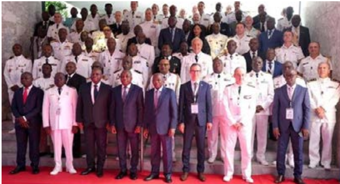
Photo de famille des officiels et participants

des défis et opportunités liés à l'amélioration des dispositifs sécuritaires et de la sûreté maritime dans le Golfe de Guinée. A travers