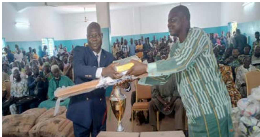
Remise symbolique du don par le député

Yendoukoa, en présence des maires, du représentant de la Direction régionale de l'éducation (DRE), des chefs traditionnels, gardiens des US et coutumes, des chefs