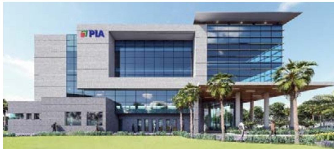
Le bâtiment abritant le guichet unique

vient adouber l'engagement écologique de la PIA suite à son association avec le Français CrystalChain, spécialisée en matière de traçabilité des gaz à effet de serre, en vue d'atteindre la neutralité carbone. Le système d'évaluation LEED est un programme de