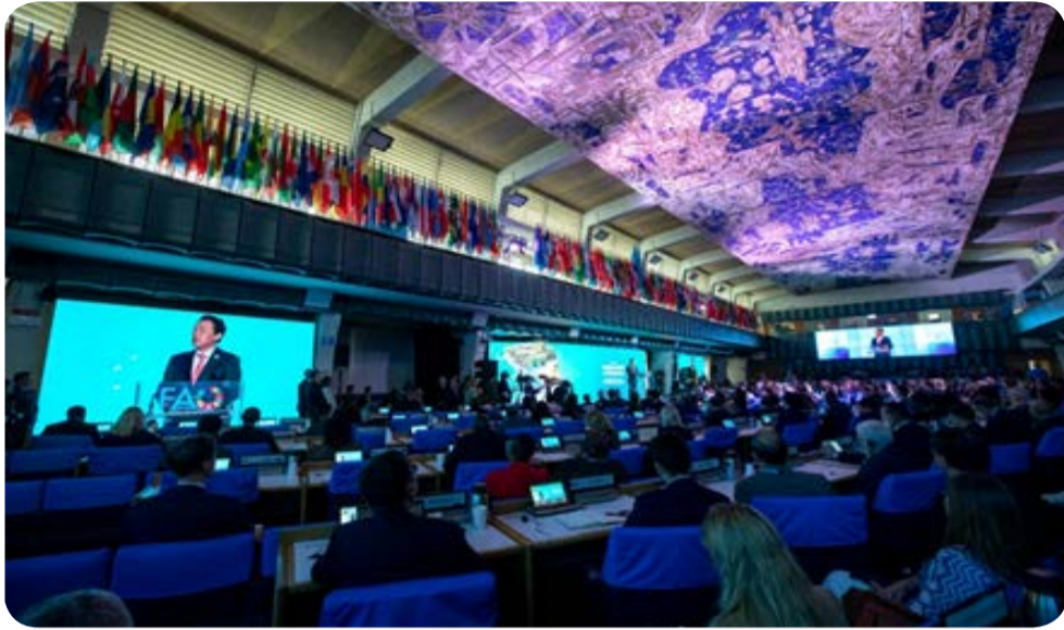
Le Directeur général de la FAO, QU Dongyu, s'adresse à la cérémonie d'ouverture de la Journée mondiale de l'alimentation. 16/10/2023

La FAO rassemble la communauté mondiale dans le cadre du thème de 2023 : L'eau c'est la vie, l'eau nous nourrit. Ne laisser personne de côté.