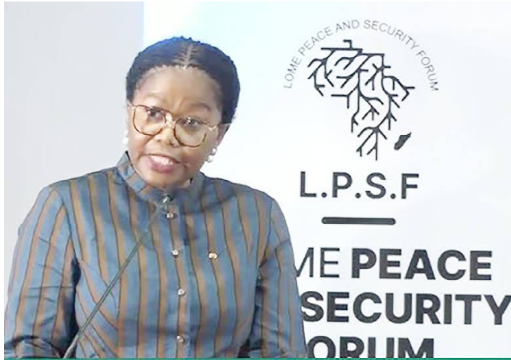
Mme Victoire Tomégah-Dogbé, Premier ministre

Cette propension du Togo à venir à l'aide aux Etats en difficulté, le Premier ministre l'a si bien rappelée lors de son allocution à l'entame du forum. Victoire Tomégah Dogbé a réitéré l'engagement du Togo à toujours privilégier les voies pacifiques de dialogue, de concertation et de médiation dans la gestion et la résolution des conflits qui ont coûté à l'économie mondiale 17.500 milliards de USD en 2022. « La moitié des mis-