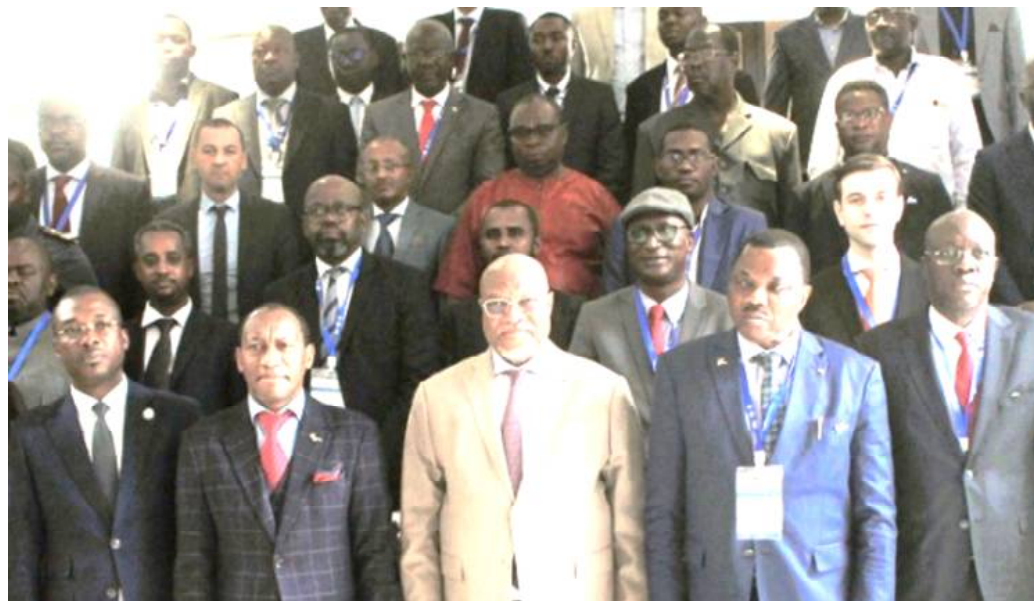
Photo de famille des participants à la 9 e réunion de l'AFPP