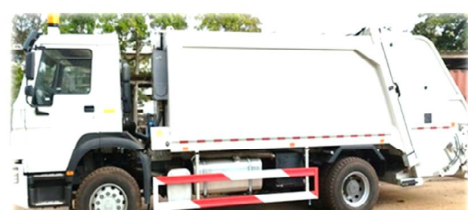
Le camion de ramassage d'ordures

Financé à hauteur de 527 568 300F CFA, Il est prévu de réaliser : l'EIES et le PAR des travaux ; construire/réhabiliter 127 toilettes publiques et scolaires ; acquérir et installer 400 poubelles ; acquérir de matériels roulants et divers