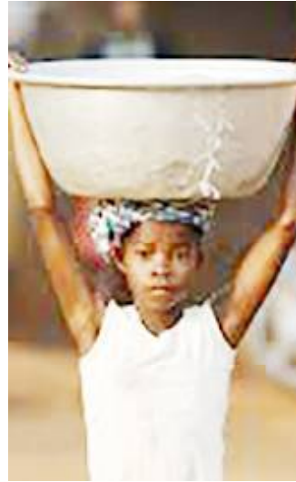
adultes comme antidote au travail des enfants

En Afrique subsaharienne, la croissance démographique, les crises récurrentes, l'extrême pauvreté et des mesures de protection sociale inadaptées ont abouti à ce que plus de 16 millions d'enfants supplémentaires soient astreints au travail des enfants au cours des quatre dernières années. « Le Travail des Enfants se produit rarement parce que les parents sont mauvais ou ne s'en soucient pas. Non, il s'agit plutôt d'un manque de justice sociale », a ajouté M. Houngbo.