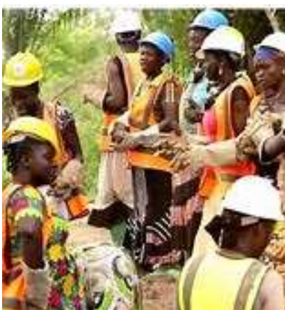
Des femmes engagées pour le développement de localité

Selon, l'Agence nationale d'appui au développement à la base (Anadeb), qui coordonne les actions du programme sur le terrain, l'objectif global du PDC-Zu est d'amener les habitants des quartiers les plus vulnérables des villes du Togo à mieux se prendre en charge pour assurer leur épanouissement et contribuer au développement du pays. La stratégie déployée pour y parvenir prend en compte la participation totale et responsable des bénéficiaires à la réalisation de leur vision de développement, avec l'appui des partenaires. S'agissant de la période d'exécution,