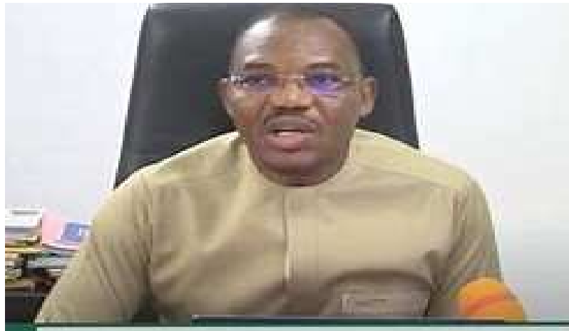
Le Procureur de la République

les agents préposés à la surveillance de ce marché, ont observé de la fumée monter d'un hangar au centre du marché. Y ayant accouru, et ayant constaté l'ampleur du feu, ces agents ont alerté la permanence du poste de police du site, dont le chef de poste qui a, sans désespérer, appelé l'équipe des sapeurs-pompiers. Ces derniers à leur arrivée ont fait face à un feu dévastateur qui embrasait presque tout. Aux côtés des sapeurs-pompiers, d'autres forces de soutien se sont mobilisées dans la lutte contre cet incendie gigantesque. Ce ne fut qu'au petit matin du vendredi 22 décembre 2023, que le feu fut maîtrisé. " La journée du ven-