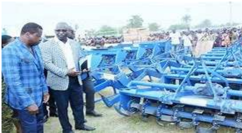
La mécanisation de l'agriculture, le cheval de bataille du Président Faure

Sur les 130 ZAAP érigées et mises en valeur pour une superficie totale de 12 608 ha sur l'ensemble du territoire national, les résultats des évaluations portées sur 76