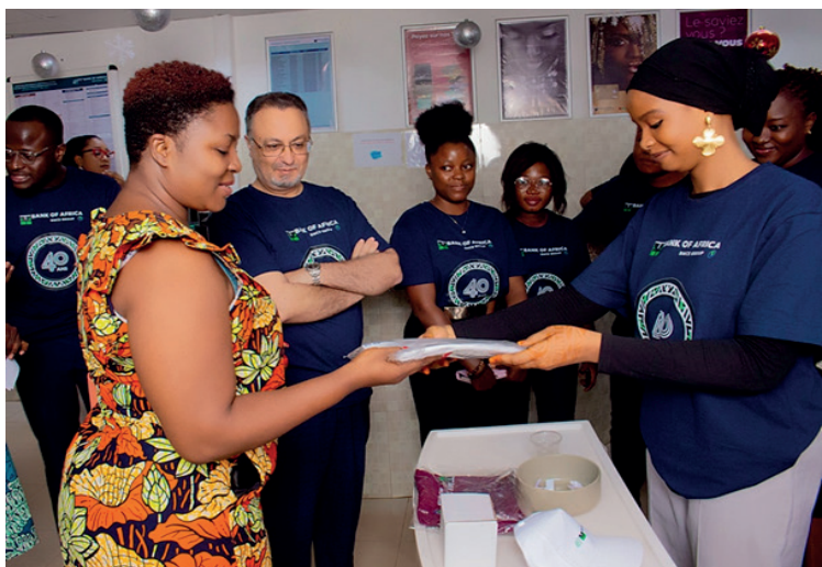
Des clients mis à l'honneur dans toutes les agences de la BOA-Togo

La semaine spéciale dédiée au client du 29 janvier au 2 février, a accueilli