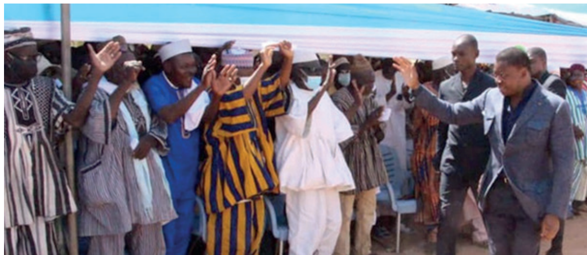
Le chef de l'État, Faure Gnassingbé saluant les communautés de la région

« Ne dormez pas sur vos lauriers. Continuez d'être vigilants, continuez d'aider les Forces de défenses et de sécurité ainsi que les autorités administratives et politiques, car c'est ensemble que nous allons préserver la paix et la sécurité dans les Savanes » a