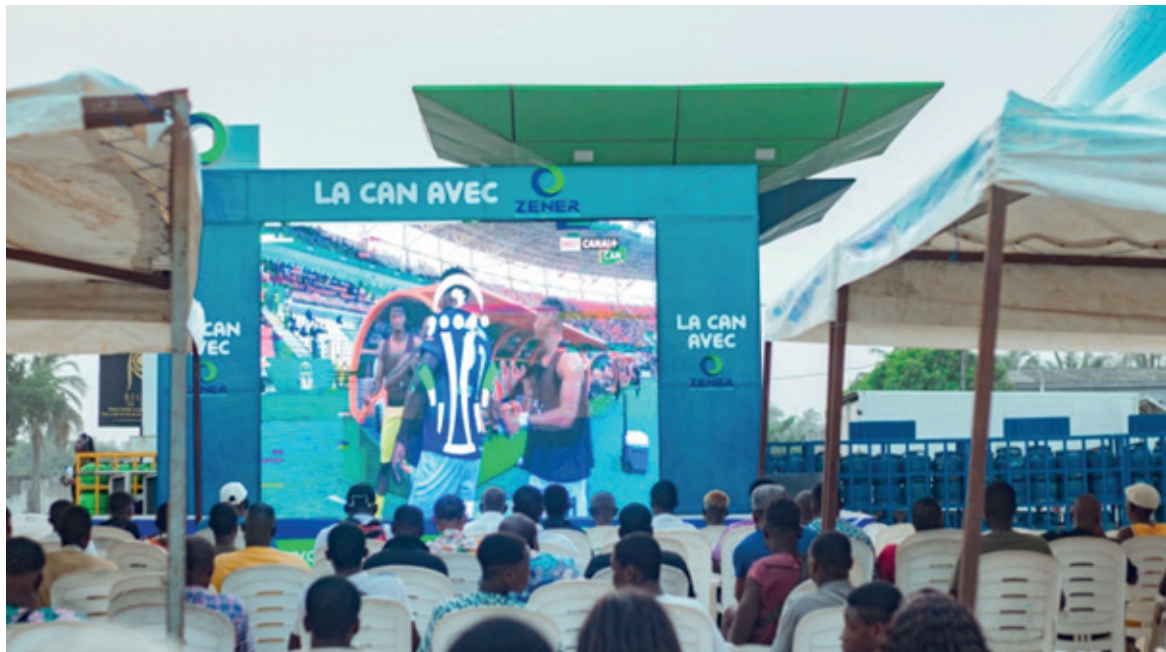
Le géant écran installé dans la fan zone de Zener