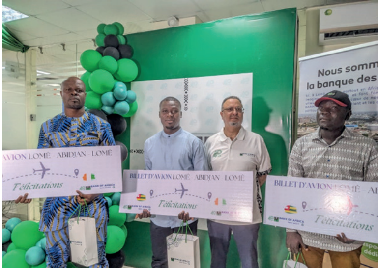
Des heureux gagnants des billets d'avion aux côtés du DG de la BOA-Togo

Dans le cadre de la semaine du client qu'elle a organisée du 29 janvier au 3 février, et pour célébrer les 40 ans d'existence de la Bank Of Africa, la filiale togolaise de la banque a organisé plusieurs activités notamment des jeux-concours dotés de prix. Ces activités ont permis de récompenser les clients avec des cadeaux spéciaux, dont des billets d'avion Lomé-Abidjan-Lomé pour suivre la grande finale de la Coupe d'Afrique des Nations (CAN 2023), qui aura lieu le 11 février prochain. La cérémonie de remise de prix aux lauréats a eu lieu, à cette occasion, le vendredi 2 février au siège de la BOA-Togo à Lomé. Ils sont une quinzaine à être récompensés. Trois d'entre eux