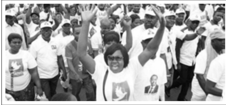
avec le vice-président chargé de la région, pour désigner les

« A cet effet, il est demandé à chaque secrétaire préfectoral et à chaque secrétaire communal du Grand-Lomé, de prendre les dispositions, en rapport