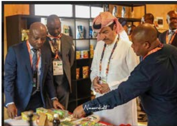
Le pavillon togolais à l'Expo 2023 Doha

Organisée en collaboration avec le Bureau international des expositions (BIE) et l'Association internationale des producteurs horticoles (AIPH), l'Expo 2023 a démarré depuis le 02 octobre 2023 et prendra fin le 28 mars prochain.