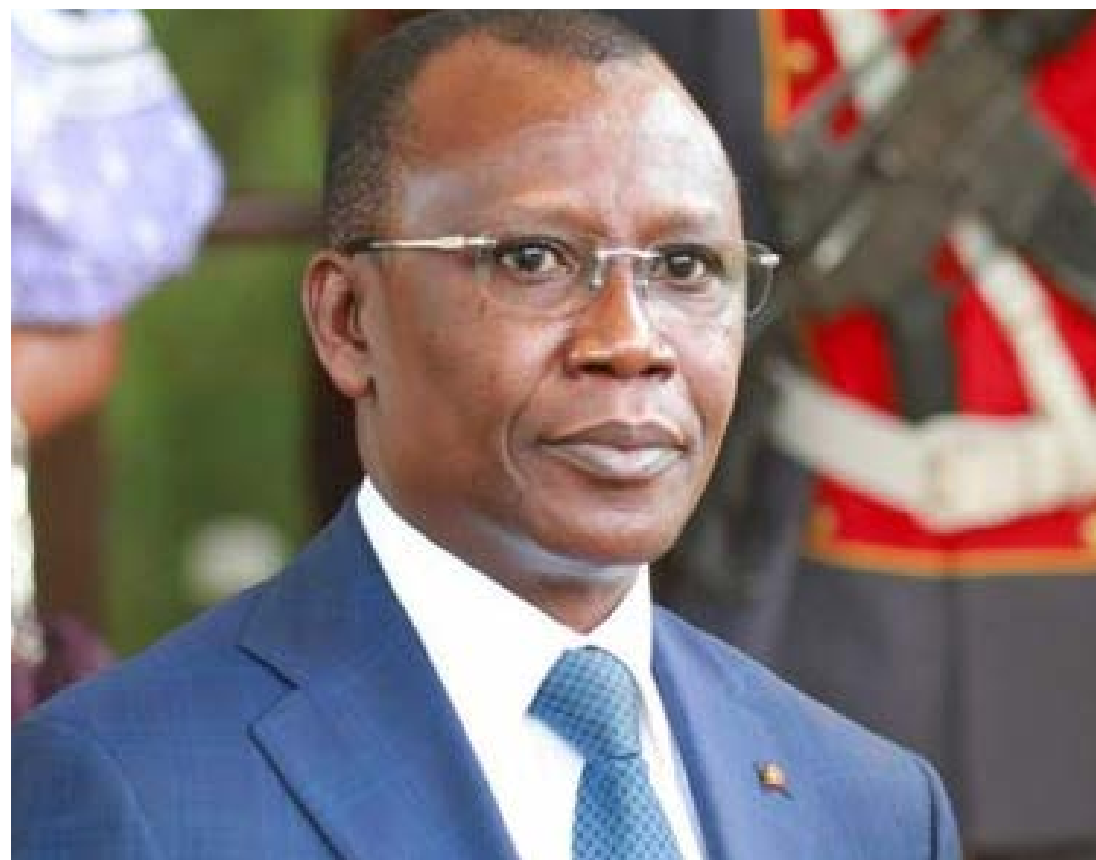
Ministre de l'Économie et des Finances

Un montant de 669,2 milliards de francs CFA est consacré aux secteurs sociaux. Par ailleurs, en 2024, neuf ministères pilotes bénéficieront du budget vert.