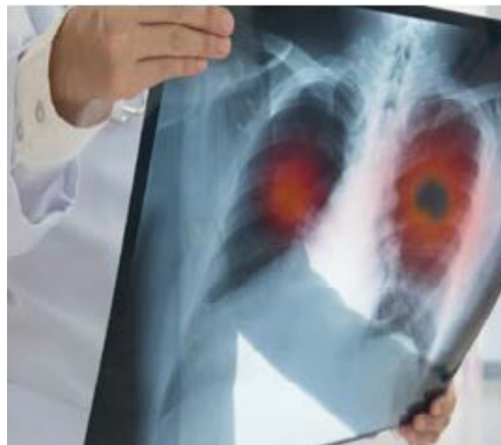
Imagerie des poumons atteint par le cancer

cancer le plus courant au niveau mondial et constitue la neuvième cause de décès par cancer (661 044 nouveaux cas et 348 186 décès). C'est le cancer le plus fréquent chez la femme dans 25 pays, parmi lesquels de nombreux pays d'Afrique subsaharienne. Même en tenant compte des différents niveaux d'incidence, il est possible d'éliminer le cancer du col de l'utérus en tant